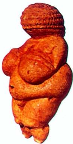
圖2 新石器時代的維納斯（奧地利）

從藝術與科學誕生的先後比較：人類以其自身的器官為媒介工具，快樂了要跳躍，憤怒了要吼叫，恐懼了要顫慄，悲哀了要哭泣；當其內在的感情，受到外來的