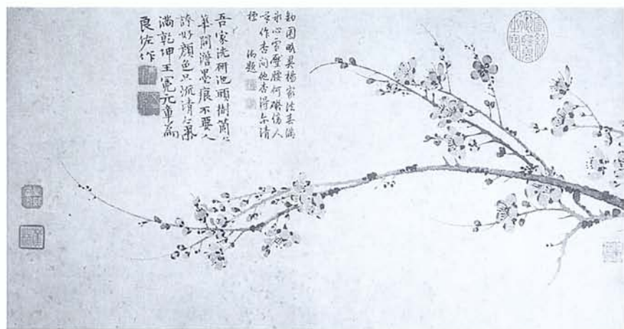
元 王冕 墨梅