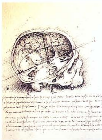
►圖7 達文西 醫學解剖圖手稿

因此，「離科學愈近，離藝術愈遠」的說法，不能成為定論，藝術與科學之間的距離尚待研究。