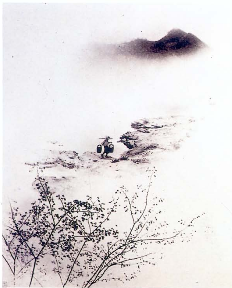
◀ 圖9 郎靜山攝影作品 晚汲清江

在學習過程中，它比筆省力；在表知的條件上，它比筆便利，比筆的表現更為完善而經濟。這是媒介工具的進步，也就是科學對藝術的幫助。科學幫助藝術增加了新的媒介工具，不僅影響了技術，也改善了技術，學習易而效果好。近年來正發展中的電腦和雷射，為藝術創作提供了更活潑的媒介，這種科學化的創作技術，包括了人類更多的心血和更高的智慧，不應單純視為機械。而由於幫助藝術表現工具的進步，喚起了更多潛在的天才，樂於接近藝術，以業餘時間完成驚人的傑作，豐富藝術的新生命，增加藝術的總成績，顯然也是科學對藝術另一重要的貢獻。因此藝術與科學合則兩利，分則兩害。應該互相容忍，互相溝通，才線藝術與科學之福。