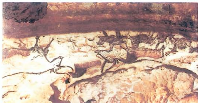
◀ 圖1 拉斯考洞穴藝術

世界是一個客觀存在的整體；並非既有一個藝術世界，又有一個科學世界。藝術家用他的眼光看世界，好像世界充滿了藝術氣氛，到處都是藝術材料，甚至許多自然景物，風花雪月本身就是藝術；這只是藝術家片面的看法。同樣地，在科學家眼中，這個世界無一不是科學研究的對象；不但天文、地理、植物、動物、礦物、聲光化電等等，屬於科學範圍；就是人類