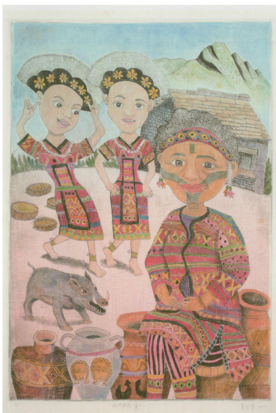
◆（圖六十一）我們都是一家人 黃月華作（民國104學年度版畫 類國小高年級組特優作品）

就變得亮麗起來。至於高中組來自新北市中正高中的余書青作品「生與死的軌跡」使用木口木版技巧利用各種動植物和骷髏意象，再以反覆的對稱形式，拼貼出死亡糾纏與輪迴的主題意涵，作品雕工細膩，黑白反差效果強烈，尤其是以一位高中學生能刻這麼大塊的木口木版，可以想像