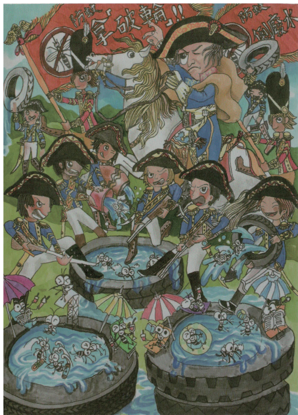
◆（圖五十六）拿破「輪」 朱晨昕作（民國104學年度 漫畫類國小中年級組優等作品）

推動漫畫，應是有很多教學人才對，期待這項孩子們最喜愛的類別，能為臺灣培養出另一位迪士尼大師或是宮崎駿大師。我們可以欣賞 104 學年度獲優等的高雄市加昌國小朱晨昕的作品「拿破輪」（如圖五十六），用「諧音」取「拿破崙」之聯想，對高雄長期以來受登革熱困擾，作反思式的創作，人物也都用著拿破崙