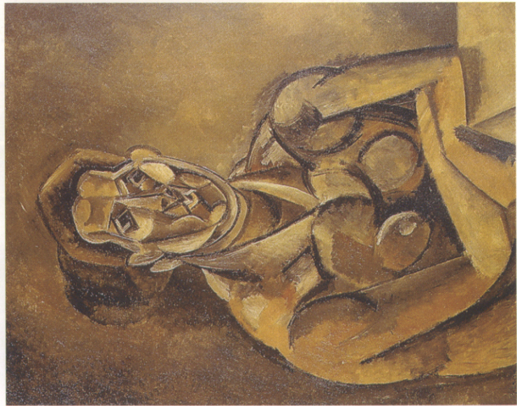
「女人(費南特)的半身像」(1909年)，左角是局部圖。