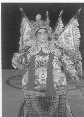
圖二十一 武生／又稱長靠武生