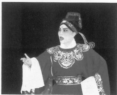
圖十五 唱工小生／讀書人