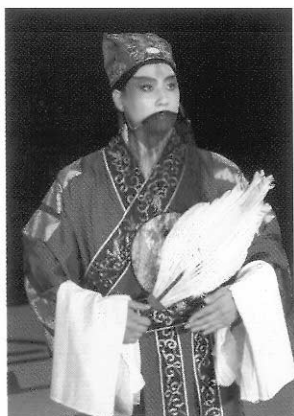
圖八 「老人」角色的孔明