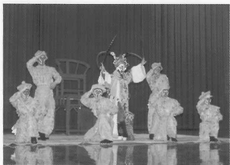
圖二十五 短打武生／孫悟空