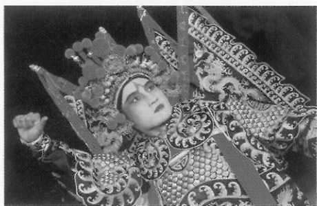
圖二十二 武生／演大將的服飾