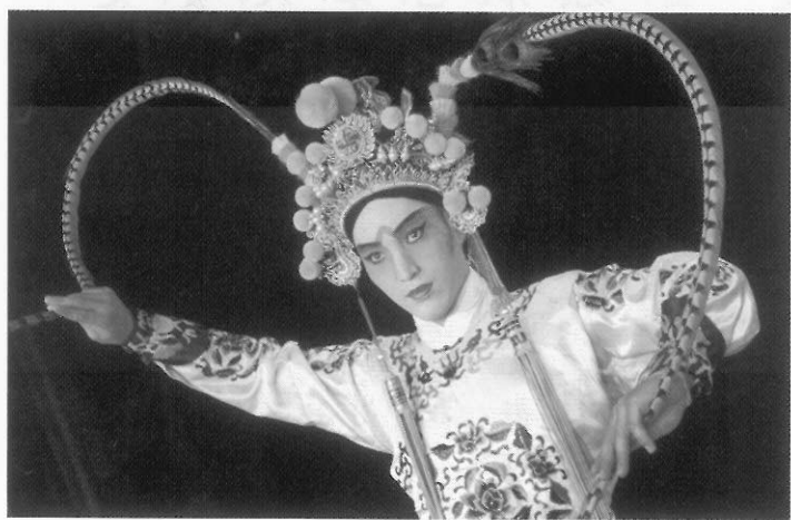
圖十七 雉尾小生／呂布