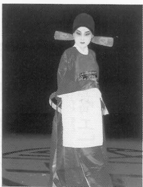
圖十四 唱工小生／官人的服飾