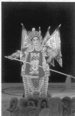
圖十九 武小生／越雲武裝