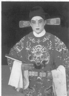
圖十二 官人／優美的扇子生