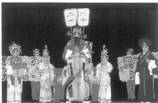
圖五 鬚生／天官與南極老翁