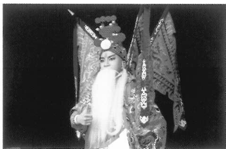
圖七 黃忠武裝服飾