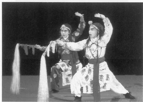
圖二十六 短打武生／神將