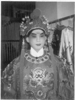
唱工小生／皇帝的服飾