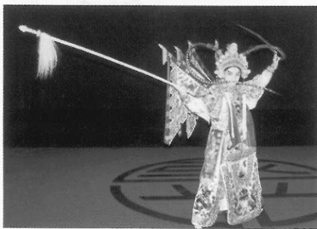
圖二十 武小生持槍於戰場