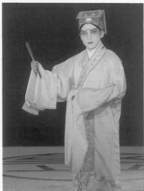
圖十一 拿扇子小生