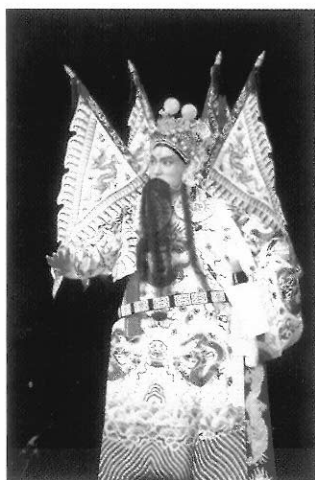
圖六 岳飛武裝服飾，又稱「靠」