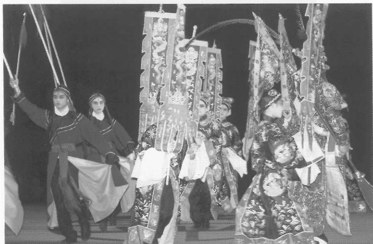
圖七十八 龍套／二軍會陣