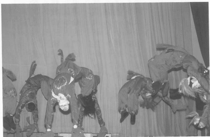
圖八十二 武行飾妖怪的肢體語言