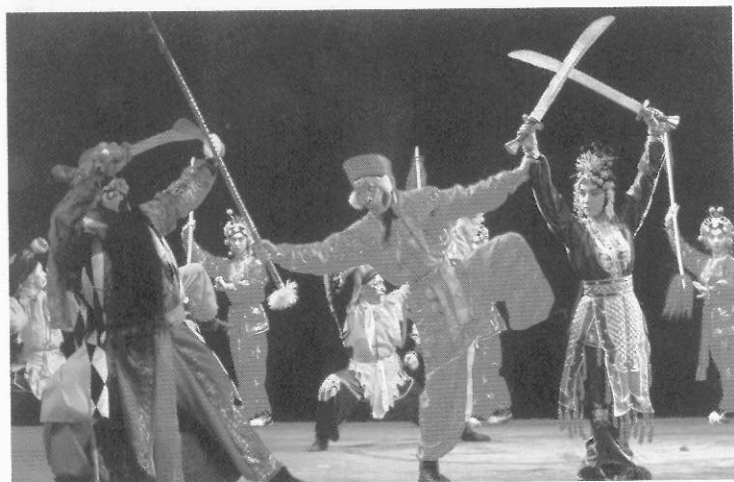
圖八十三 武行飾妖怪，小猴構成武打場面