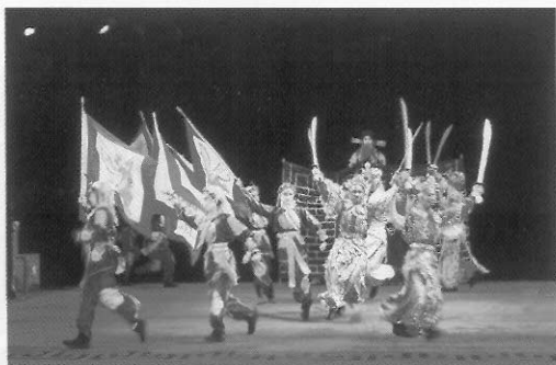
圖八十 上手代表正方兵將