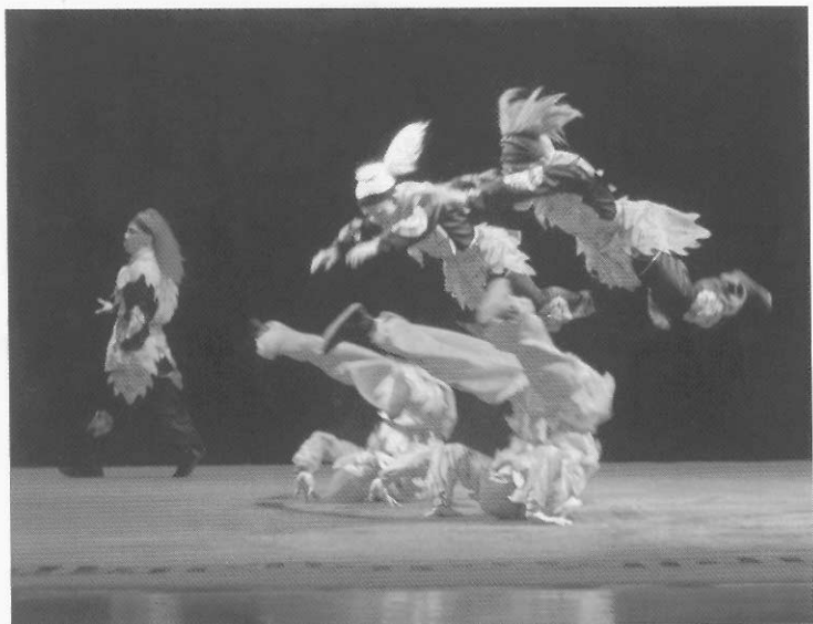
圖七十六 神仙、妖怪翻滾