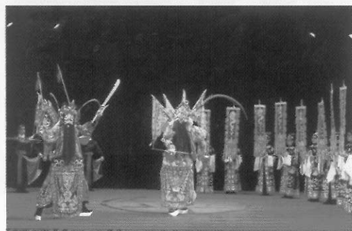
二軍陣前／龍套與將軍