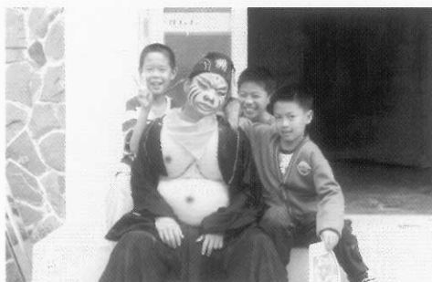
圖八十五 想睡覺的豬八戒