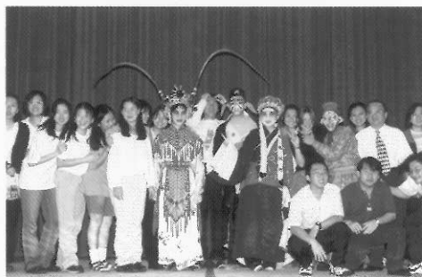
圖八十六 大家一起來看戲