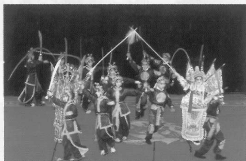
圖八十一 下手代表反方兵將，女兵隨女將出場