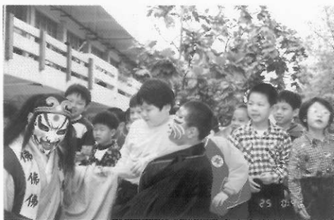
圖八十四 豬八戒與沙悟淨在校園