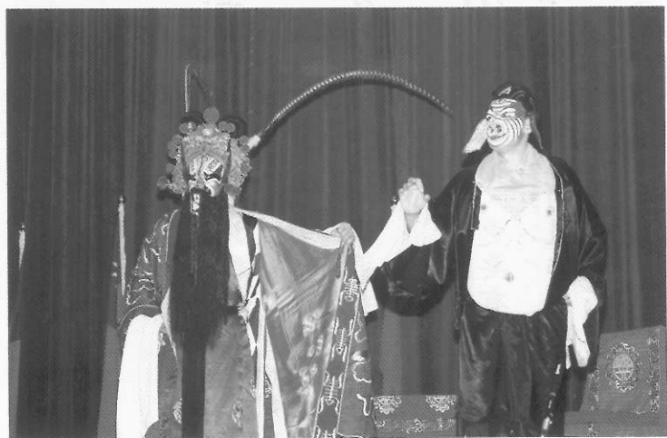
圖七十七 豬八戒與牛魔王