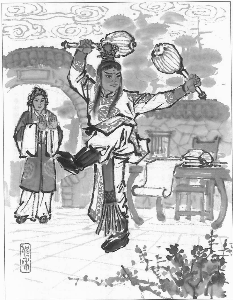
練武是岳雲最開心的事