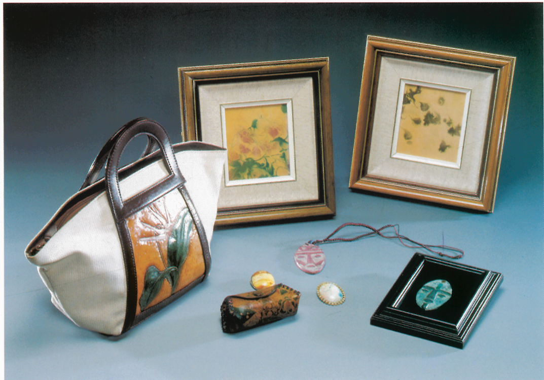
皮雕 胸針、項鍊、小錢包、相框、仕女包、紋面 (表框)、秋冬 1件 皮革、糊染