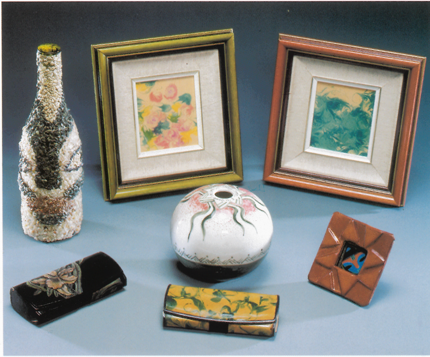
皮雕 眼鏡盒 (A) 眼鏡盒 (B) 圓花瓶 石彩花瓶 春夏 1件 皮革、糊染