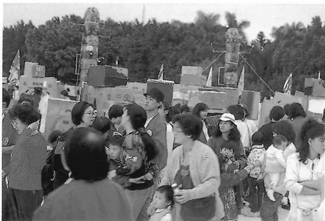
▲親子共同參與社區大型美術活動，是親子共同成長的好機會。