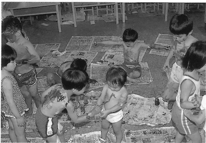
▲身體的化粧可以解放心靈，也可以做為人際關係的成長。

都涉及人與人之間的合作關係，教師在設計這種活動時除了要重視學習成果的好壞之外，更要注意孩子在共同使用工具、場地或甚至場地的收拾上是否有積極參與。這些活動都是幼兒人際關係的良好機會教育，家長及老師都應密切關心。