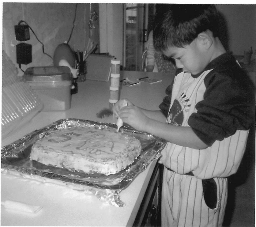
▲ 自製糕餅也是一種手藝

四、不要因為幼兒常常將紙撕裂、樹枝折斷、積木推倒，就認為這是表示幼兒具有「喜歡破壞」的心理傾向，為了避免養成偏差的行為而加以阻止。