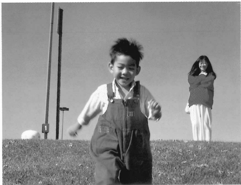
▲造型教育在提供給孩子一個歡樂的童年