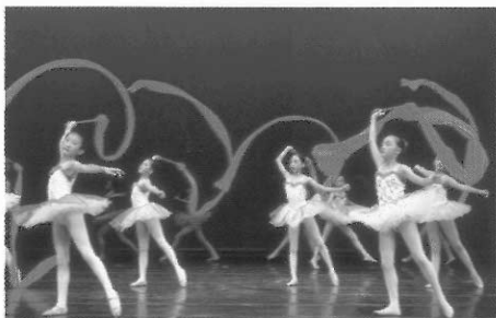
▶ 臺灣有許多小朋友學習芭蕾舞。

芭蕾舞源自於義大利宮廷舞，因為義大利凱撒琳公主嫁到法國，而將此宮廷舞蹈引進法國王室。在西元一六六一年法國皇帝路易十四，又稱太陽王，創立了第一所芭蕾舞學校，由於這所芭蕾舞學校，芭蕾舞才逐漸流傳至俄羅斯國，然後在俄羅