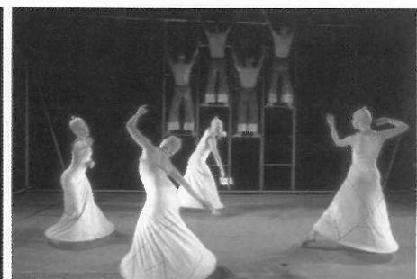
▲ 多變的服裝、道具、燈光及肢體運用。