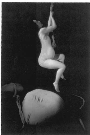
▲ 爲人母的心情也可以編成舞蹈。