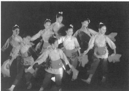
▲中國民間舞蹈近年來普遍地被國人喜愛。

由臺北市中正國小及敦化國中的學生所組成，結合舞蹈與扯鈴，舞動出極具特色的舞蹈風格，小小年紀的他們多次代表