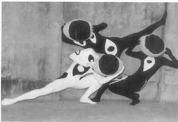
▲眼睛也可以如此表現，是不是充滿想像力啊！