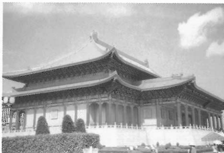
▲國家劇院經常演出高水準的舞蹈表演。