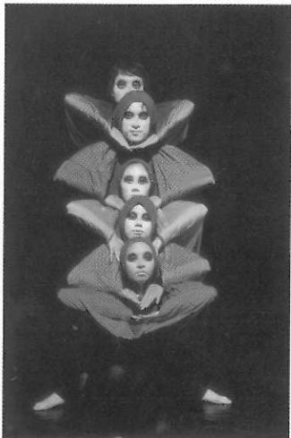
▲多讓兒童接觸不同的舞蹈演出，有助於兒童對舞蹈鑑賞的能力。

由於國內的學校舞蹈教育中，除了教導一般學校教育舞蹈，如：土風舞、大會舞及各項節慶所需的舞蹈表演活動外，亦有舞蹈資優班與舞蹈科系給予比較專業的舞蹈訓練大致以民族舞、芭蕾舞、現代舞為主，在此為各位老師簡單的介紹國小課程標準中的國小舞蹈種類以及讓各位老師認識一般性舞蹈類