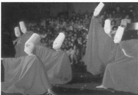
▲ 誇張的面具也能營造出特殊的效果。