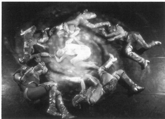
▲劇場效果也是舞蹈欣賞的一環。

關於芭蕾舞的表演因為要許多專業技術上的配合，所以大部分只在正式的劇場中才可以表演，以下就劇場禮儀、舞蹈主