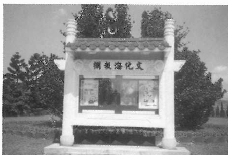
▲多留意文化看板，會找到許多舞蹈演出訊息。