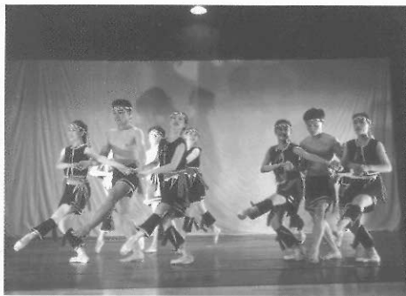
▲臺灣芭蕾舞編舞家也嘗試編創臺灣本土的芭蕾舞風。

十九世紀初，此時期也稱為「白色芭蕾舞」，主要經典作品是吉賽爾，臺上的女舞者穿著白色長裙，跳著以村姑、仙女或