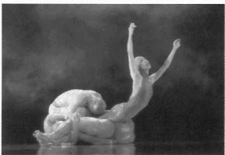
▲ 現代舞給觀眾相當大的自我詮釋空間。