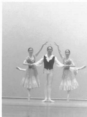
▲女舞者穿起硬鞋，踮起腳尖，使芭蕾舞的技巧更上一層樓。