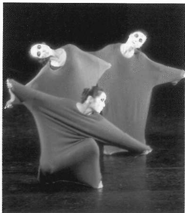
▲在校內舉辦適合給兒童觀賞的舞蹈演出。