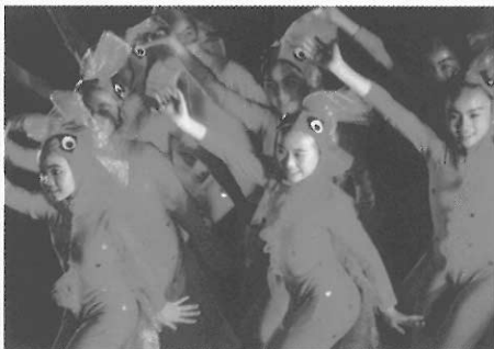
▲俏皮討喜的兒童舞蹈表演。