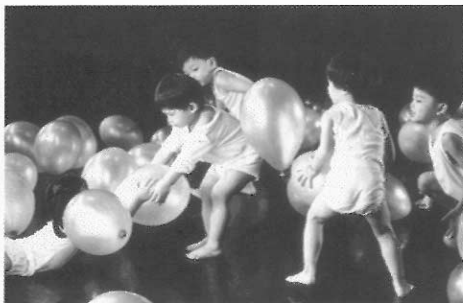
▲ ◀ 媽媽與自己的小孩同臺演出是畢生難忘的經驗。