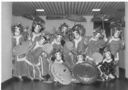
▲臺灣民間的藝陣「十三婆姐」也登上了國家劇院的舞臺了。

老師可以和小朋友從文化意義、表演形式、個人感受三方面去討論他們參與民族舞蹈觀賞的經驗。同時，在討論中，老師也可以藉機再次提醒該民族文化的重點，讓小朋友可以從民族舞蹈的觀賞，對各民族文化有更深刻的認識。