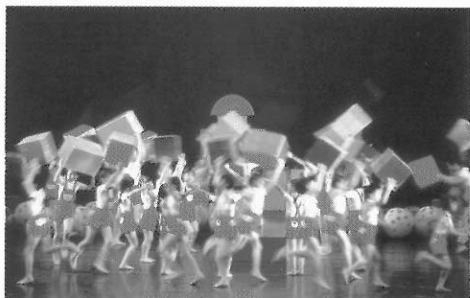
◀明快的節奏能使孩子更投入情境中。