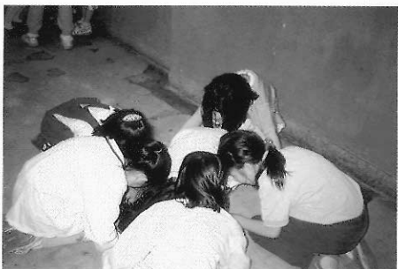
▲圖六一 「有一粒種子睡在泥土裡」。