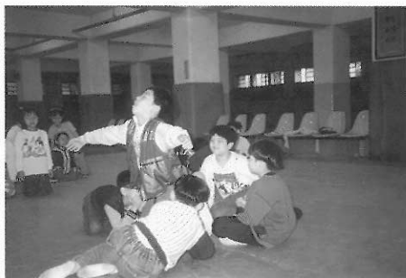
▲圖四三 種子發芽，「喝一口春天的雨水」。

社會課程領域相當廣泛，舉凡與我們成長相關的社會環境，都是學童要學習的內容。藉由戲劇可以運戲劇化的方式，老師引導學生對人的行為、組織與社會規範，作更深入的探索，如加拿大有一位老師，便運用創造性戲劇教學方式，經過學生決定要玩一個搶銀行的遊戲，老師透過老師入戲和學生入戲，以及不斷討論的方式，讓兒童深切了解搶匪式的英雄主義，造成自食惡果的下場，以及對週邊親友與旁人的傷害，改變學生錯誤的英雄崇拜的觀念。