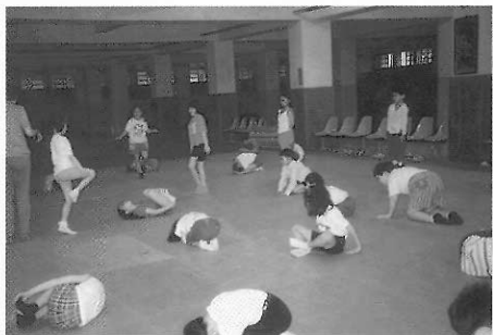
▲圖四一 用身體占據一個「最小」的空間。