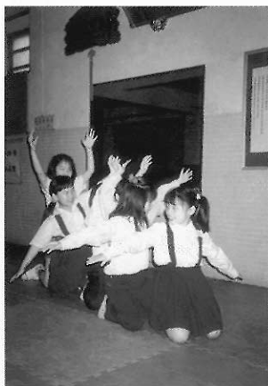
▲圖六八 這是另一種陽光。