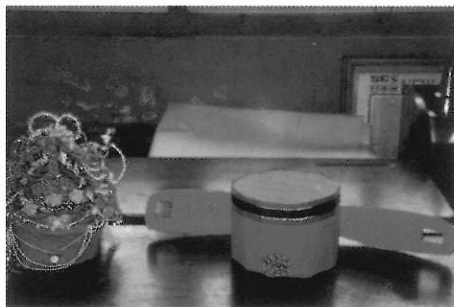
▲圖六十 秀朗國小學生自製的官帽與鳳冠。