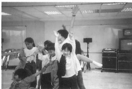
▲圖五六 全班作一棵大樹。