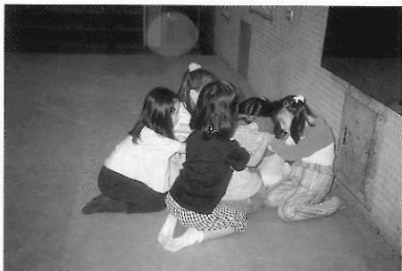
▲圖六二 另一種睡在泥土裡的種子。