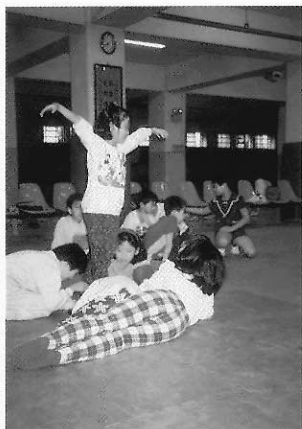
▲圖六六 「身體長得更高了」。