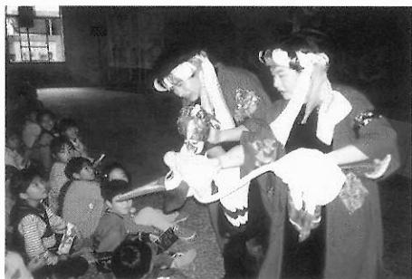
▲圖四四 九歌兒童劇團「國王與鶴」。

如秀朗國小、華江國小皆曾辦兒童戲劇營，成果不錯；校園演出的活動，主要可以包含邀請兒童劇團到校演出，如九歌、鞋子、紙風車等劇團（圖四四），在校園常見他們的蹤跡；此外，還有師生同臺，學生演出等型態。