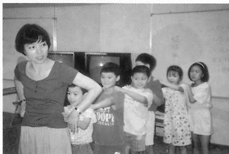
▲圖四六 老師運用旁述的方式，與兒童共同創作。

譬如從日常生活入手，引導學生反思自己的生活記憶，例如清晨起床所作的事，讓兒童分組即興發展場景。