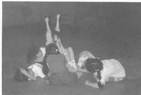
▲圖六三 小種子醒了過來。