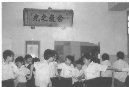
▲圖五三 想法子解開這個結。