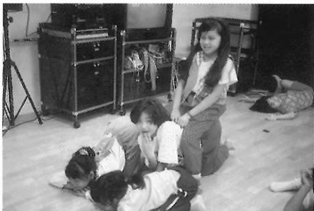
▲圖五十 「白女巫坐在雪車上」，前二人是拖車的鹿，中間是駕雪車的小矮人，高高在上的是白女巫。