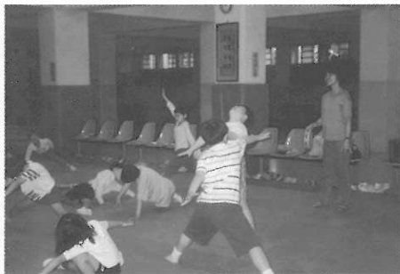
▲圖四二 用身體占據一個「最大」的空間。

習動機；遊戲式的肢體活動，可以增進對幾何造形的認識，或探索立體空間的大小（圖四一、四二）