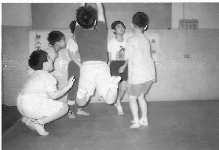
▲圖六五 另一種較「撒野」的雨水。