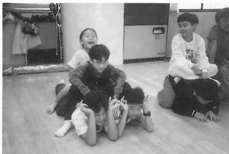
▲圖五一 瞧！我們的鹿和別人不一樣呢！