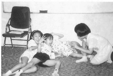
▲圖四九 老師只要一張老鼠遇見貓的照片，就好像你們在做事情時，被別人用照相機偷拍下來一樣，……。