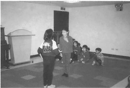
▲圖四五 兒童演出「獅王、女巫、衣櫥」的故事。

接著她繼續向學生拋問題「可是我們一群人，需要一個領導者，誰來帶領我們？」她以積極催促的口吻問她的學生，本來學生要她當領導者，她拒絕，要學生自己找出一位領導者，她提醒學生只有一位領導，於是學生很快投票決定了領導，落選者有的支持新的領導，有一個「憤而離去，拒絕合作」，此時這位老師開始協調，達成共識後，她很快切入主題，以堅定且催促的語氣要求領導者分配工作，她不斷向領導者施加壓力說「時間不夠、天快亮了」，一面向其他學生詢問意願，於是