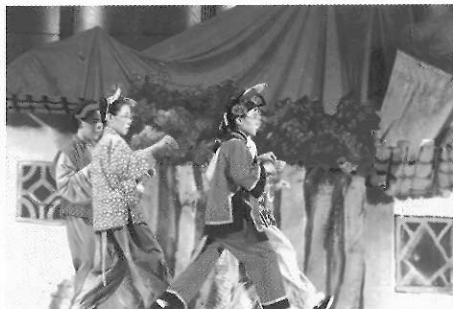
▲圖五七 秀山國小的「老鼠娶親」劇照。

一種載歌載舞的演出，如鞋子兒童劇團的「稻草人與小麻雀」、牛古演劇團的「螃蟹與男孩」，九歌兒童劇團為秀山國小指導的歌舞劇「老鼠娶親」，便是齣專為兒童設計的歌舞劇。（圖五七）