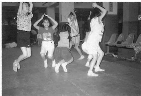
▲圖六四 這是春天的雨水（民權國小學童上戲劇課情形）。

作法上，在經過暖身活動後，讓學童六人一組，即興發展種子發芽、春天的雨水、太陽光照耀的過程，每組呈現時，其餘童學則在一