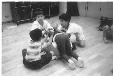
▲圖五四 大樹上選開著小花。

一、二、三，木頭人」（一人當一棵小樹）…「一、二、三，木頭人」（兩人作一棵樹）…「一、二、三，木頭人」（全班作一棵大樹）（圖五四、五五、五六）。「木頭人」的遊戲，可與角色扮演技巧的「停格」遊戲互相搭配進行。