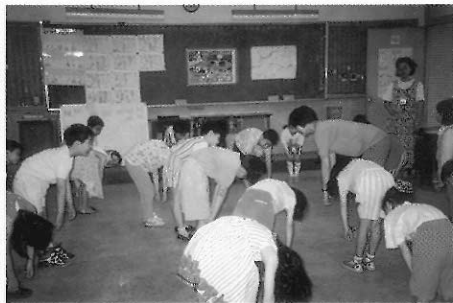
▲圖五九 身上腰部的線和頭上的線都放掉了。