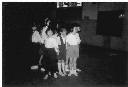
▲圖五二 打一個又緊又密的結。