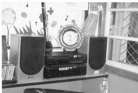
▲圖六九 秀朗國小的音響設備之一。