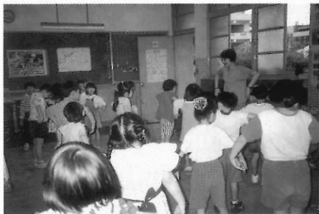
▲圖五八 我們變成提線傀儡了。

由美國導演 Paul Sills 所創，故事劇場是一種結合故事中第三人稱和第一人稱的劇種，使用的劇本往往忠於原作，運用表演和劇場製作來發展戲劇演出，目前在臺灣，這種表演型態才剛被引入。這是一種很容易處理的劇種，老師若在學校排練