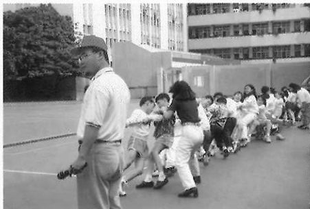
▲圖二七 團隊精神經常表現於競賽活動。

這時期兒童身體的發展進入了一個相對平穩的階段。身體發育較平緩和幼兒其比較起來變化不大，除了身高體重穩定成長外，已不似幼兒期體型成長的快速。到了學齡中後期，因為