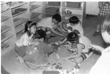
▲圖二二 教室的一角可以當作表演的場地。

觀察是對生活所接觸到的任何事物的感受能力，觀察有外在及內在兩部分，外在的是形體、行動和特徵的構成，如雞是怎麼走路，蛇是怎麼爬，花的形狀，人的聲音……等舉凡在人所處的環境中，可以用感官察覺的任何人、事、物。內在的觀察在於人的情感的表達，情緒