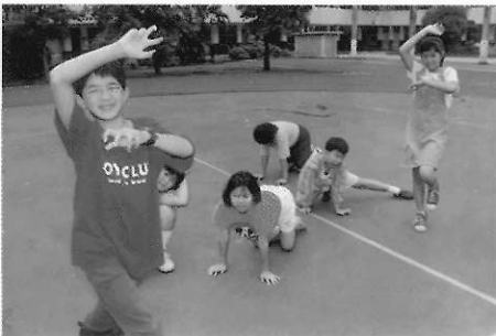
▲圖二一 戲劇課程並沒有被列爲正式的小學課程。

戲劇活動課程其實是教育改革思考的原點，在講究活潑化教學，學生自主學習的前提下，學習不只是認知的學習，而是在解決生活上的問題。戲劇活動的各個元素，可以檢驗學生各方面的能力。如語文能文，在戲劇內容的構成和表達時，學生是否有足夠的詞彙，語言能否適當的表達，能否將戲劇素材構成一個完整的故事。這些能力可以輔助語文教學在認識字詞的形音義之外，還讓他能夠真正地體會使用語文的方法。並觀察到學童的能力。在社會行爲方面，更可以觀察到學童是否能夠與人合作，不能合作的同學，在講究整體活動中，必須學習和別人溝通合作的技巧，才能完成學習的任務。