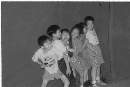
▲圖三十 低年級的小朋友情感比較直接。