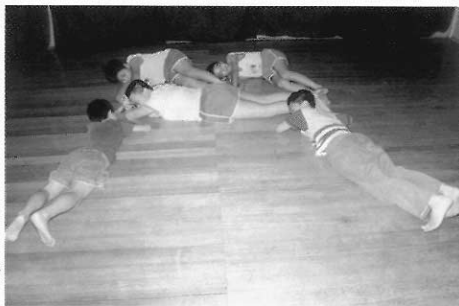
►圖二六 由肢體構成的眼鏡造型。

國小時期的學童我們統稱為學齡前期，進入國中後進入另一個學齡中後期的階段。在學校目前大都以低、中、高三個年段來區分這時期兒童身心狀況差異，低年級是處於幼兒期與兒童期的在過渡時期，這時候還保有幼兒期的特徵，有幼兒的臉型的特徵，對於團隊的概念含很薄弱，比較自我中心，對於異性並沒有非常嚴格的區分。到了中年級稚氣的娃娃臉通常在這個時期褪去，兒童開始準備成熟，對於團隊的約束力慢慢地增強，認識到自己是團體的一分子，異性之間的對立慢慢形成。高年級由於第二性徵的出現，兒童的身體出現非常大的改變，這時候在外形上，成人的特徵都已經出現，對於異性也由對