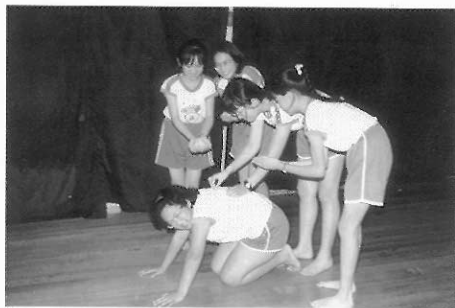
▲圖三八 精忠報國的故事正在發生。

對於創造性戲劇活動的學習，城鄉兒童對於環境的認知可能完全不同，除了依據兒童的身心發展之外，必須針對不同兒童的特質，給予不同的戲劇形式或材料，在想像力激發方面，兒童的想像通常依據他的生活經驗，同樣年齡的兒童生活經驗不一定相同，鄉下的小孩和城市的小孩對麥當勞的認知可能完