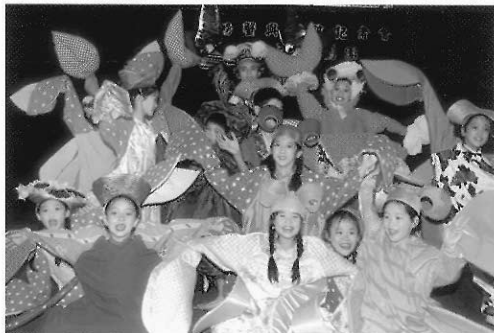
▲圖二四 牛古演劇團《螃蟹與男孩》。

如京劇、歌仔戲等。現在有許多劇團也不斷從戲曲的表演形式上變化，再加上現代舞臺劇的表演觀念，轉化成新的