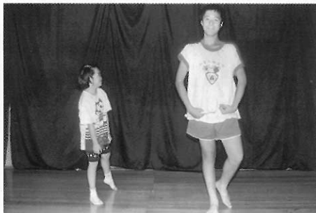
▲圖二八 小學階段身體的發展差異極大。