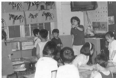
▲圖三五 老師和學生的距離更接近。

在上課時必須提供每一位學生有同樣的機會，活動性課程經常會出現表達能力強的同學經常獲得比較多的表演機會，表現能力較弱的學生往往沒有表現的機會，老師必須隨時提供給能力較弱的學生機會並給予肯定，簡單的創造性活動，儘可能詢問這些學生的創意。在整體表現上，能力強的學生會自然成爲領導者，老師也不必刻意去壓抑，因爲整體的學習是透過整體的協調討論，跟從者在活動中他可能因爲接受同學分配的角色，而得到表現的機會，這種自發性的學習比老師提供的學習更能深入學生的內心。(圖三五)