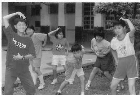
▲圖二三 外在的模仿是表演的開始。

模仿是透過觀察後以自己的肢體感官去再現一個目標物，模仿的對象可以是動物、靜物，或是想像中的事物。模仿最重要的是如何抓住模仿對象的型態和特徵，通常模仿都是以目標物某一特點的放大，來達成模仿的效果，這通常是和外在的觀察相連結，所以我們可以模仿蛇的爬行，雞的叫聲，或是政治人物、明星等，因為他們的特徵明顯。然而表演是人的生活情境的模仿，如何觀察到模仿對象的內在思考模式，及行爲特質，則又是表演的另一個層次。（圖二三）