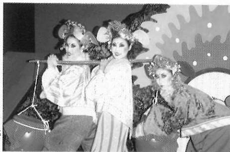
►圖二五 牛古演劇團《老鼠娶親》。

以各種材料作成各種角色來作為表演形式的演出都可以稱為偶戲。在家裡的襪子套在手上可以成為偶的表演，洋娃娃能夠當成傀儡戲、布偶劇、手偶、人偶……等。比較特殊的有紙風車劇團演出過的《小口袋》是利用各種顏色的彈性布，縫成