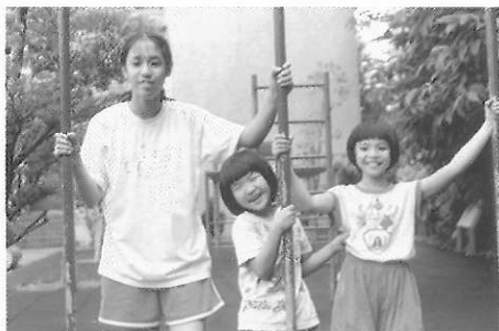
▲圖三三 良好的友誼是互動的基礎。