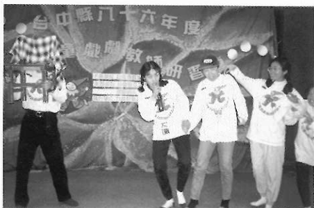
▲圖一六二 教師研習活動。