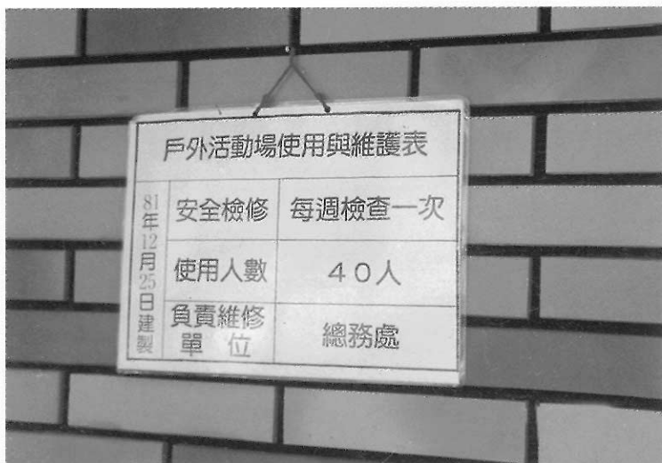
▲活動場應做定期檢查與維護。