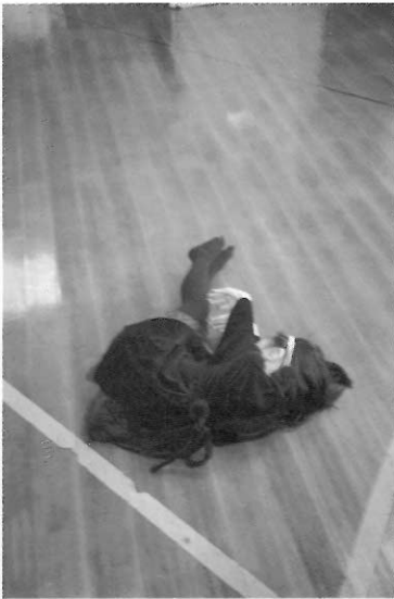
▲舞蹈活動宜著輕便褲裝以利活動。

設備方面希望園方能採購基本安全配備，避免課程中造成運動傷害；器材不足時，可以從生活中的事物取材，例如：以汽水瓶裝米粒來製造樂器(注意材料的安全性)、厚紙板疊鋪於地上，作為臨時地墊，同時也引導幼兒運用生活材料，開發他們的變通性與創造能力。