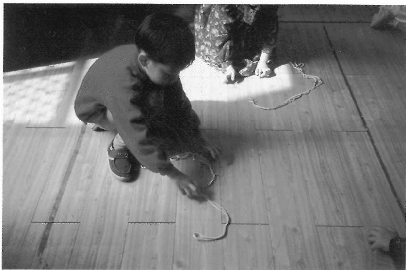
▲局部的肢體運用，也可以讓幼兒享受創作的樂趣。