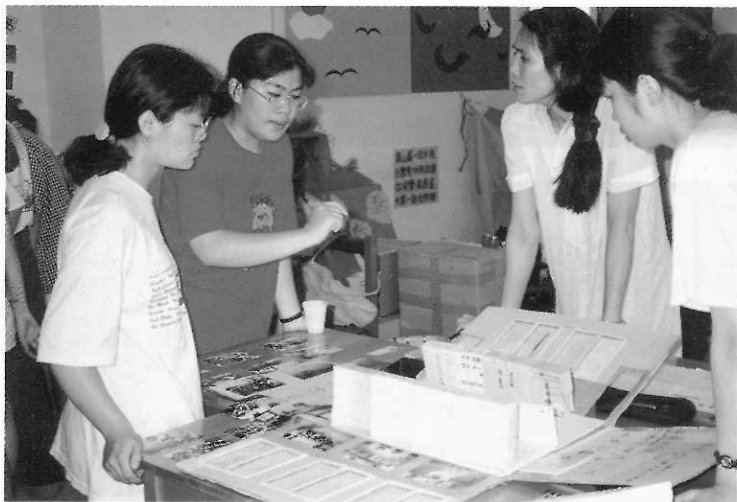
▲教師定期討論教案的設計與執行結果，並做適度的修正及延續。

答：本研究小組在建構撰寫內容以及委請幼稚園教師進行試教時，即有感於手冊書面文字的侷限性，無法明確而詳盡地傳達課程實例的實際教學執行。由於這是國立台灣藝術教育館第一次策劃的幼兒藝術教育教師手冊，必定有許多實際教學執行上的疑難和困境，希望未來能和各園所、相關社會團體、以及專家學者合作，舉辦系列教學研習營，讓幼教老師從動態的教學示範、交流座談會與學術研討會中，更深刻瞭解此手冊的意義與實用性。