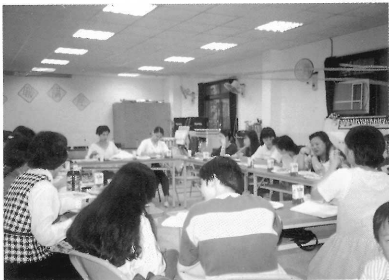
▲座談會中，教師們熱烈討論試教的情形。