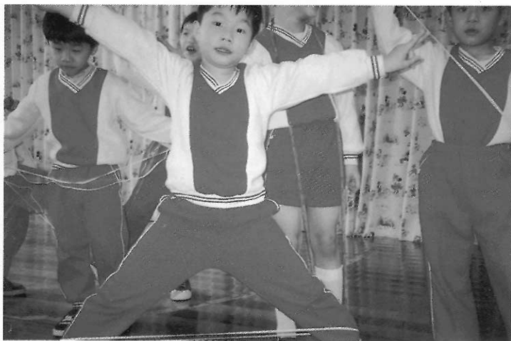
▲創造性舞蹈教學著重於幼兒肢體表達能力的開發。

幼教老師有了這樣的共識，對於幼兒的肢體動作就不會有「對、錯」的二分法，應該進一步去觀察動機、引導發展。至於動作的「美」與「不美」，我們希望能超脫舞蹈技巧性的觀賞角度，融入生活中的動作趣味，彎腰採茶的農婦和踮高足尖的天鵝公主，各有他們巧妙的肢體語言；重要的是表現者是否對自己的肢體動作有足夠的信心，有自信的教師，才能引導出有自信的學生。