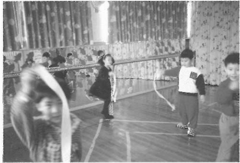
▲穿襪子在木質地板上活動，很容易滑倒、摔跤。