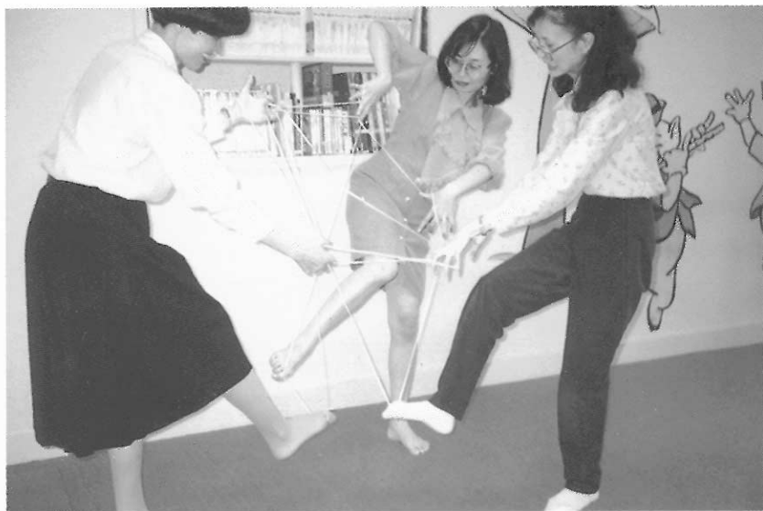
▲教師親身體驗課程的設計，以發現教學的疑難。

面對舞蹈藝術與一種新的教學法，教師總有許多教學上的疑難，希望尋得解決之道。本研究小組透過座談會與個別訪談，以下列舉出幼教老師所提的疑慮，並提供解決策略以供參考。