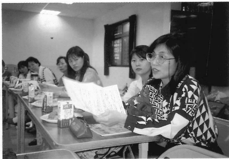
▲教師提出對教案的修擬意見。