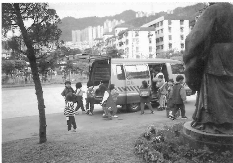
▲交通工具要符合安全規定。