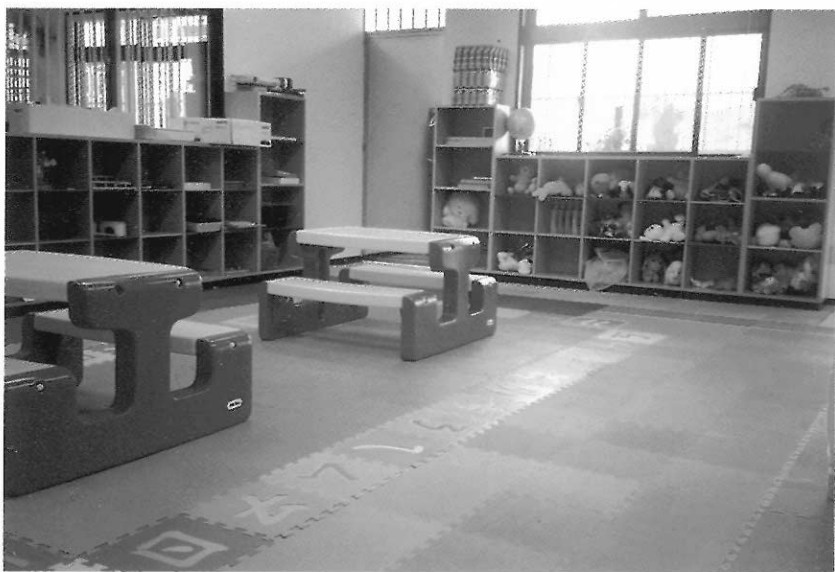
▲肢障幼兒的教學環境規劃要特別注意安全性。