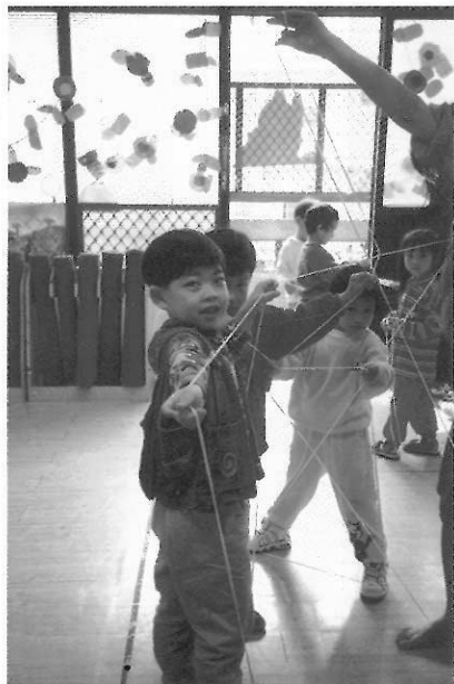
► 重視每個幼兒的獨特性。

答：每一個幼兒都是獨特的個體，天賦的資質和才能都不同，個別差異很大，而且同一個幼兒在不同層面的能力發展(認知、語言、身體機能等)，速度上也有快慢的不同。基本上幼兒和成人的思考方式不同，幼兒並不是大人的縮影，更不是一個空容器，幼教老師應該根據幼兒的發展能力、需求與興趣，提供「引導」而不是「灌輸」。