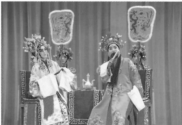
圖29 「合歌舞以演故事」的傳統戲曲。