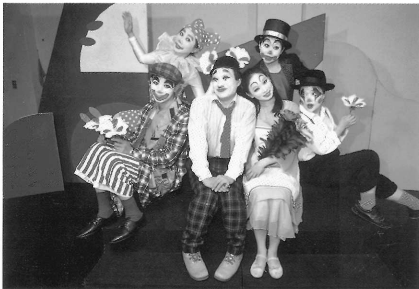
圖26 默劇經常用誇張的臉部位化妝。

默劇演員中比較令人耳熟能詳的有卓別林、馬歇馬叟。卓別林在無聲電影時代利用他獨特的造型，和特殊的身體與語言，創作了許多令人感動的作品，流傳至今仍受到相當多觀眾的喜愛。馬歇馬叟則在舞台上創造了白臉的畢普這個角色，在舞台上千變萬化的戲劇情節，都在他一舉手一投足、一顰一笑的肢體動作中表達的淋漓盡致。現代流行舞蹈中許多摸牆壁、拉繩子的動作都是從基本的默劇動作發展出來的。國內的兒童劇團也經常使用默劇表演的方式來創作，九歌劇團的《不要眨眼睛》、紙風車劇團的《聖誕鈴聲》都是屬於默劇型態的演出。