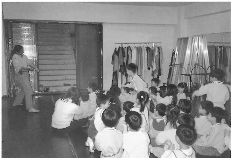
圖24 參與劇場，觀眾與表演者互動。