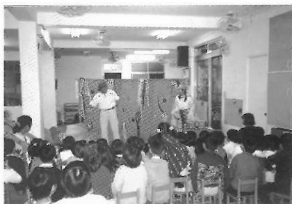
圖21 大人演給孩子看。