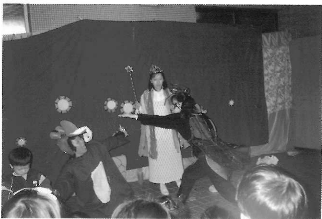
圖31成長幼兒學園的演出。