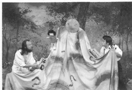
圖22 九歌兒童劇團「李兒上山」劇照。