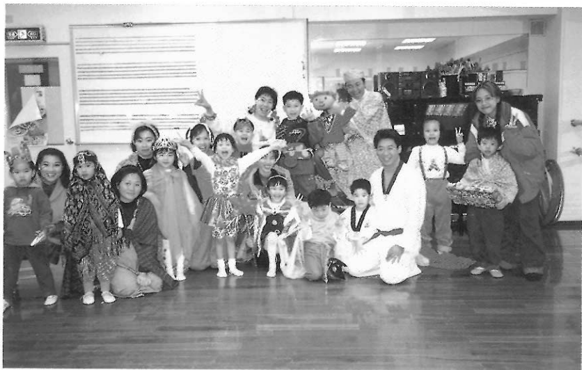
圖20 演員與幼兒交流。

事實上，透過戲劇的形式，演出一些經過設計，極有創意巧思的故事或舞蹈，讓小朋友在劇場內感受到快樂的氣氛，喜歡演出的故事、演出的人物、舞臺的裝扮，或是能夠引起他們對於表演的好奇，對於故事結局的感覺，或是演員們為什麼能在舞台上自在的演出，有什麼困難？還是有什麼特質？這樣便是一場最佳的戲劇教育。因此，不管任何類型的表演，只要觀眾的設定為兒童，內容上也能夠以兒童的理解能力為前提的演出，就應稱為兒童劇。