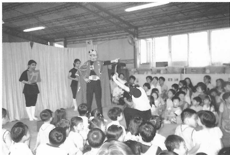
圖25 市師幼教系於聖恩幼稚園演出「圓圓國與方方國」，形式為教育劇場。