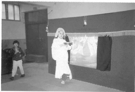
圖34 隨著自己打擊節奏起舞的幼兒。