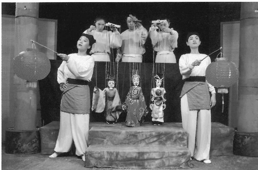
圖28 九歌兒童劇團製作的「皇帝的願望」是由懸絲偶和演員一起演出。