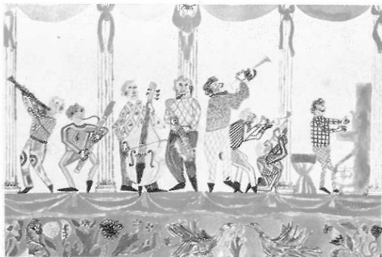
► 兒童作品中，流露出個性、知性、群性、價值等訊息。