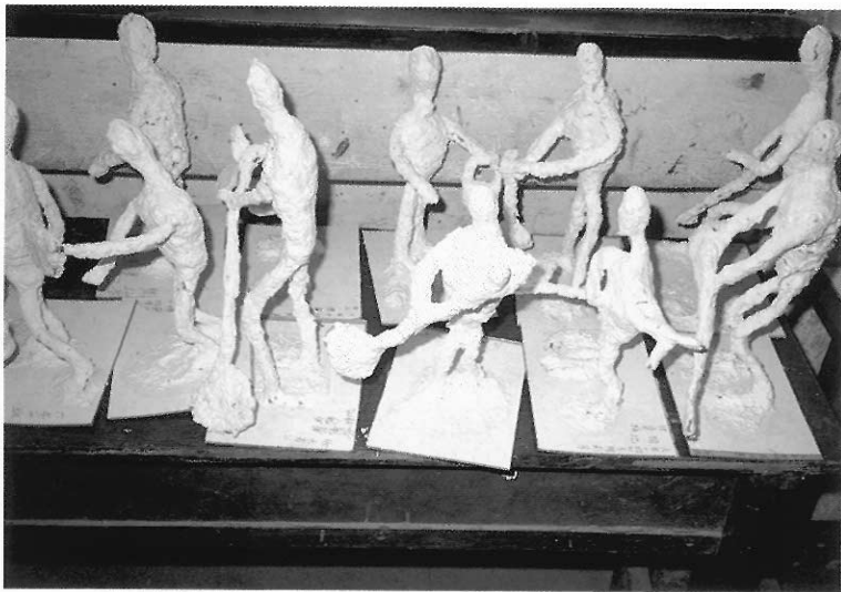
▲不同素材，可體驗多元美感。

硬體教具包含各種媒材，諸如繪畫類、版畫類、雕塑類、設計類等表現領域之材料、工具、幻燈、機器；軟體教具應包含各種技法研究、上述審美教學資源、錄影帶、幻燈片、各種書籍等。