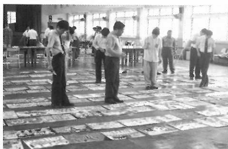
▲大型比賽之評審，要歷經數個階段。