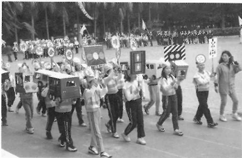
▲▲▲配合學校重要慶典展開美勞活動；彩繪校園、化妝遊行，展現成果。