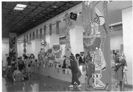
▲指導兒童共同創作大型作品，有較壯觀的展示效果，亦可培養分工合作的態度。

位)。較多作品之評審可分初選（以流水式，每件作品流經每一位評審前），複選（共同投票），決選（投票、討論、表決）等階段。