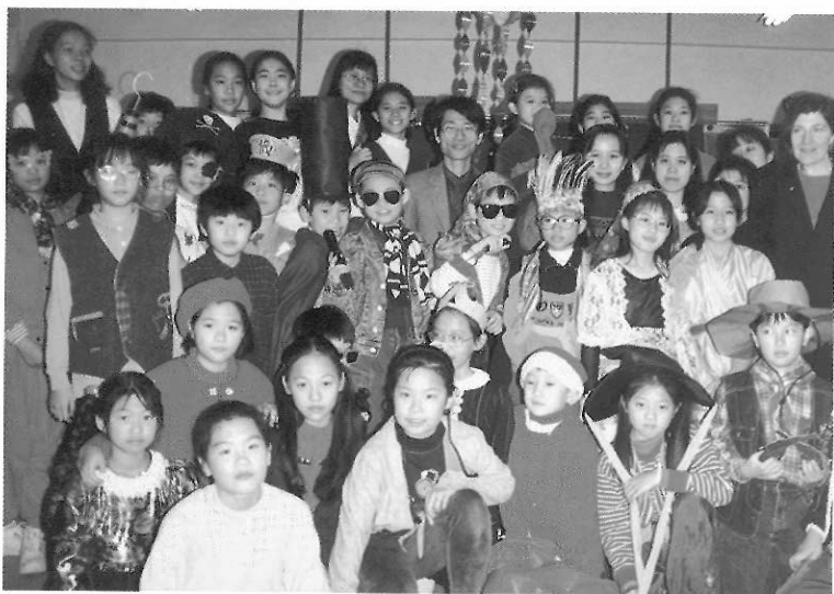
▲美術能力資優兒童，對美術有較濃厚興趣且富創意。