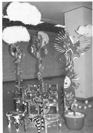
▲化腐朽為神奇—運用廢棄物共同創作，不僅是環保，更是創意的展現。