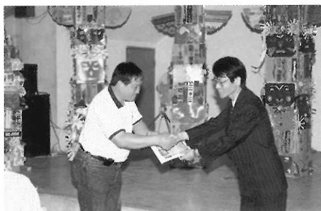
▲運用社會資源可協助美術教育之拓展。

帝門藝術教育基金會與北市民族國小、師大附中等校合作的藝術家駐校計畫，安排藝術家到校指導學生特別藝術單元，並舉辦成果展。