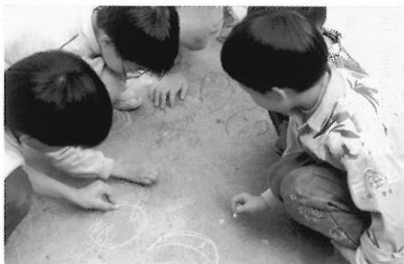
►美勞教學應指導創作與欣賞活動，並重視習慣態度之培養。