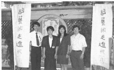
▲藝術走進校園—美術導賞到校服務。