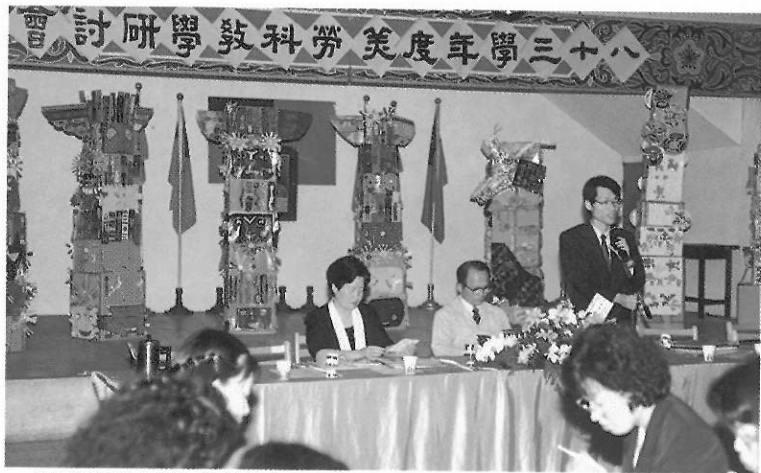
▲美勞科研討會研討美勞教學問題。

教師應配合教學時間與學生程度，將教材作適度的調配，如果確因教學需要，必須三節課連貫（如參觀活動或不易分階段之單元等）可作彈性處理，和其他科協調，作臨時性的調課，並向教務處報備。