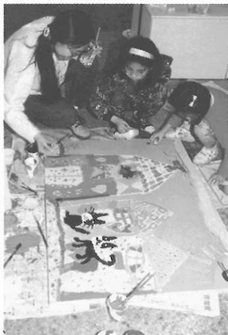
▲小學美勞教師應具備教育、美勞及兒童領域之素養。

因此，小學美勞教師應具備的基本知能甚為廣泛，非幾頁篇幅所能道盡。有關教育的基本素養如教學法、教育心理、班級管理、獎懲原則等，與一般科目教師大體相同；有關兒童心理與發展可參閱本書籍其他有關資料。本章就美勞部分依筆者經驗，略舉主要項目簡述之，作為參考或提示，如需較詳盡資料可參閱有關書籍。