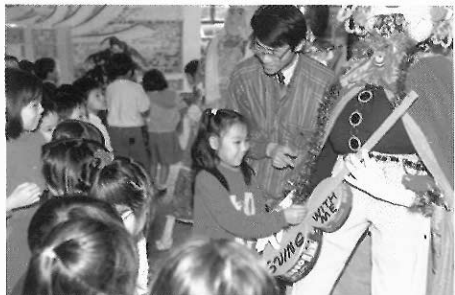
▲運用不同媒材做多樣性的表現，可教學相長。