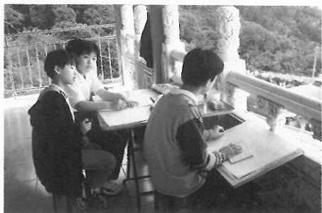
▲美勞教學之安全要有充分的準備。