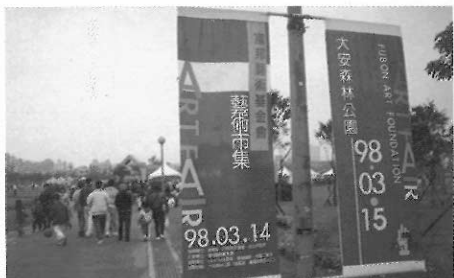
▲藝術基金會辦理藝術市集，是美術教育的拓展。