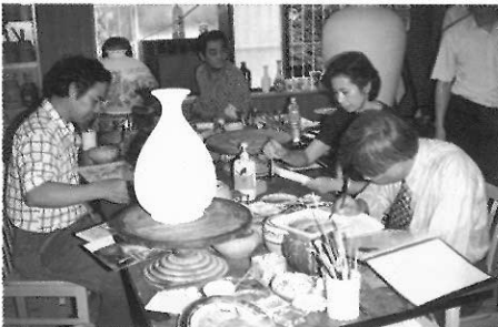
▲美勞教師應持續創作以體驗創作歷程。