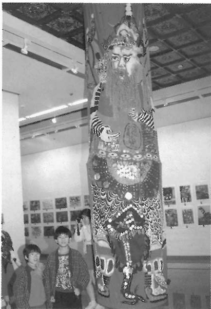
◀▶參觀與欣賞的指導是小學美勞教師愈來愈重要的素養。