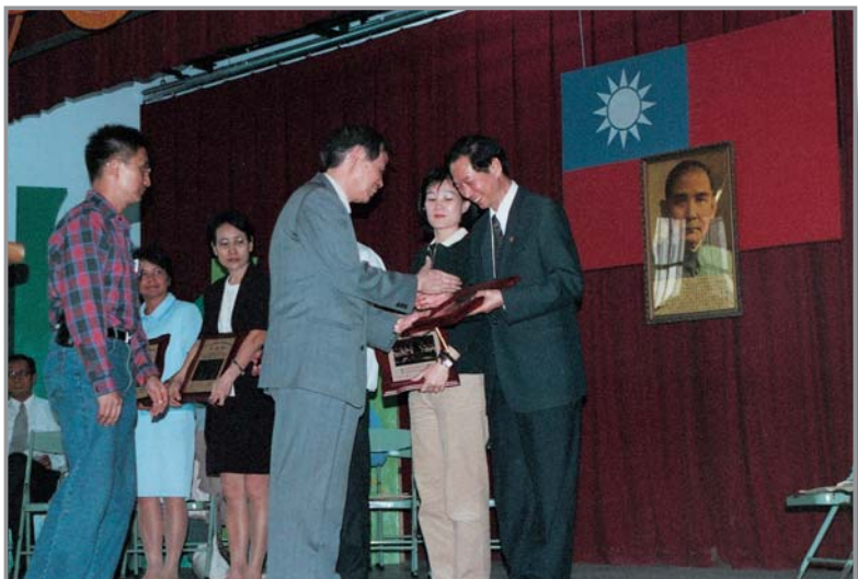
國立臺灣藝術教育館陳館長頒獎給六所績優學校