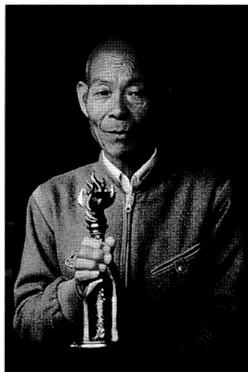
謝 苗 硯 雕

十四歲開始習藝後，數十年如一日，親自手工製作硯臺，目前其姪隨傳習藝，獲獎後更引起二水地區對硯台的重視。