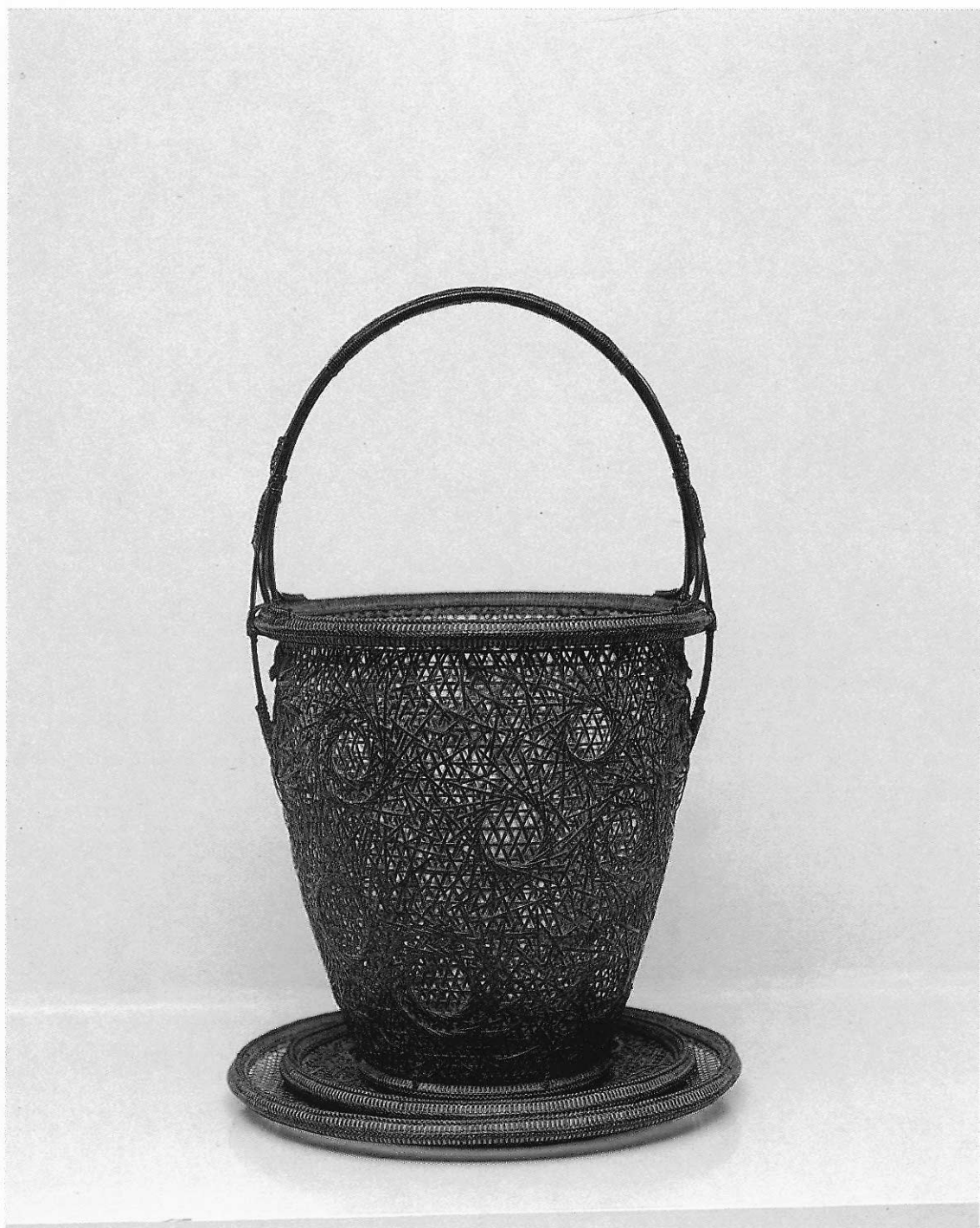
▲ 薄 滴