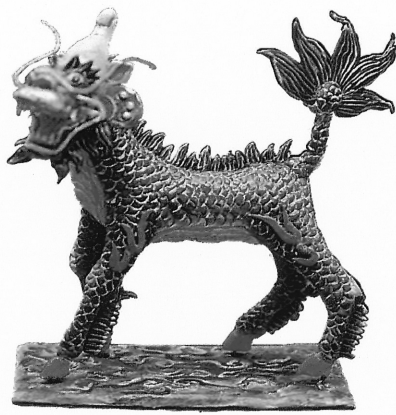
▲ 麒 麟