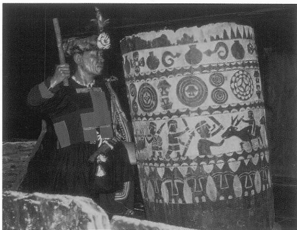
排灣族藝術家撒古流早期的木雕創作