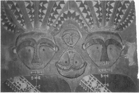
排灣族的木雕立柱（局部）