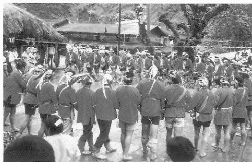
除了日常生活之外，宗教儀式是保存藝術的重要途徑

原住民自己的文化工作者來說，部落間新興的文化財產權概念也可能阻礙文化的記錄與傳承。個人創作的雕刻作品之一切權利，固然屬於創作者而無疑義，但部落整體多年流傳下來的圖像，其權利何屬，如何保護，也尚有討論之餘地。此外，部落共有的歌謠、歌詞等都產生同樣問題，更使文化工作者徘徊擺盪在傳承與利益之間。孔吉文提出「尊重」及「互惠」作為解決原住民文化財產權問題的兩大原則。他舉例，若新聞製作或文史工作單位於前往部落拍攝、採集之前能先予通知，說明前來的用意及日後影像的用途，就是「尊重」；若所得的影像或資料將被運用在商業上而有所收穫，就進入「互惠」的層面 71 。事實上，我們更需要關心不同社會體系對文化財產權的不同定義，以及發展藝術的社會基礎。