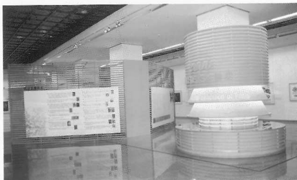
12. 2000年國際版畫邀請展展場