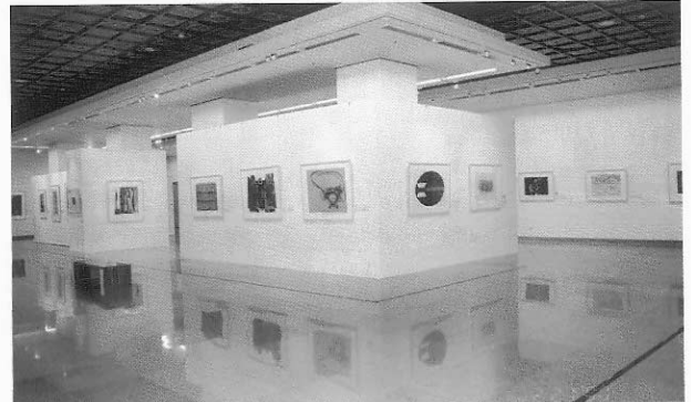
15. 2000年國際版畫邀請展展場