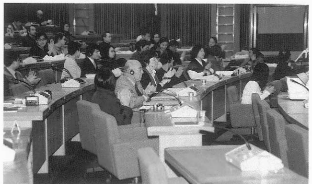
7. 2000年國際版畫學術研討會會場情況