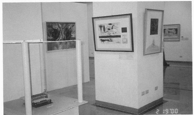
14. 2000年國際版畫邀請展展場，左下為迷你壓印機