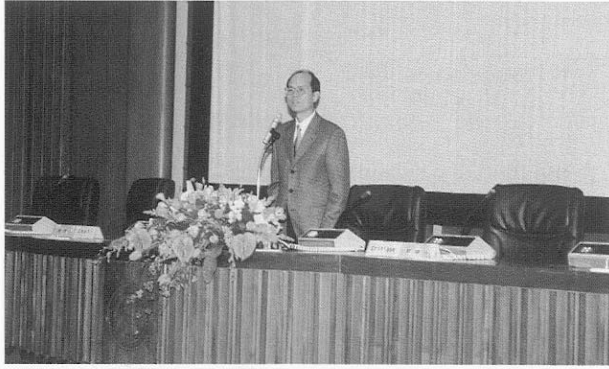
1. 教育部呂木琳常務次長蒞臨致詞