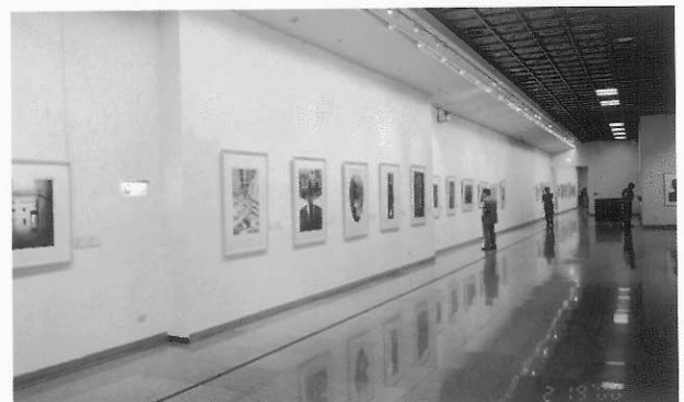
16. 2000年國際版畫邀請展展場