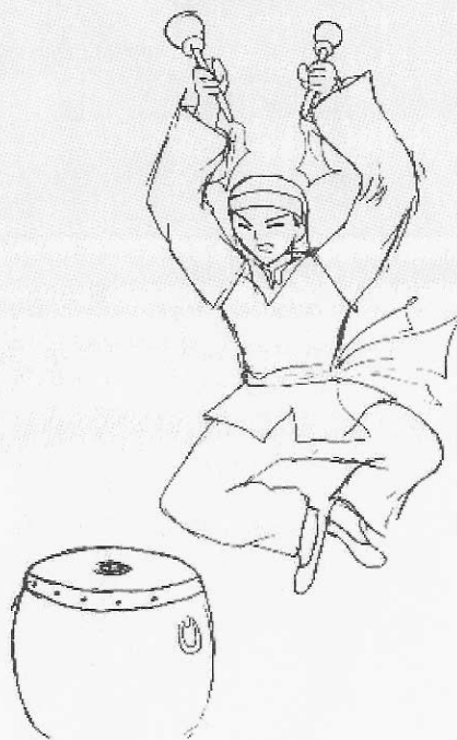
●麻雀蹦（又稱十番鑼鼓）