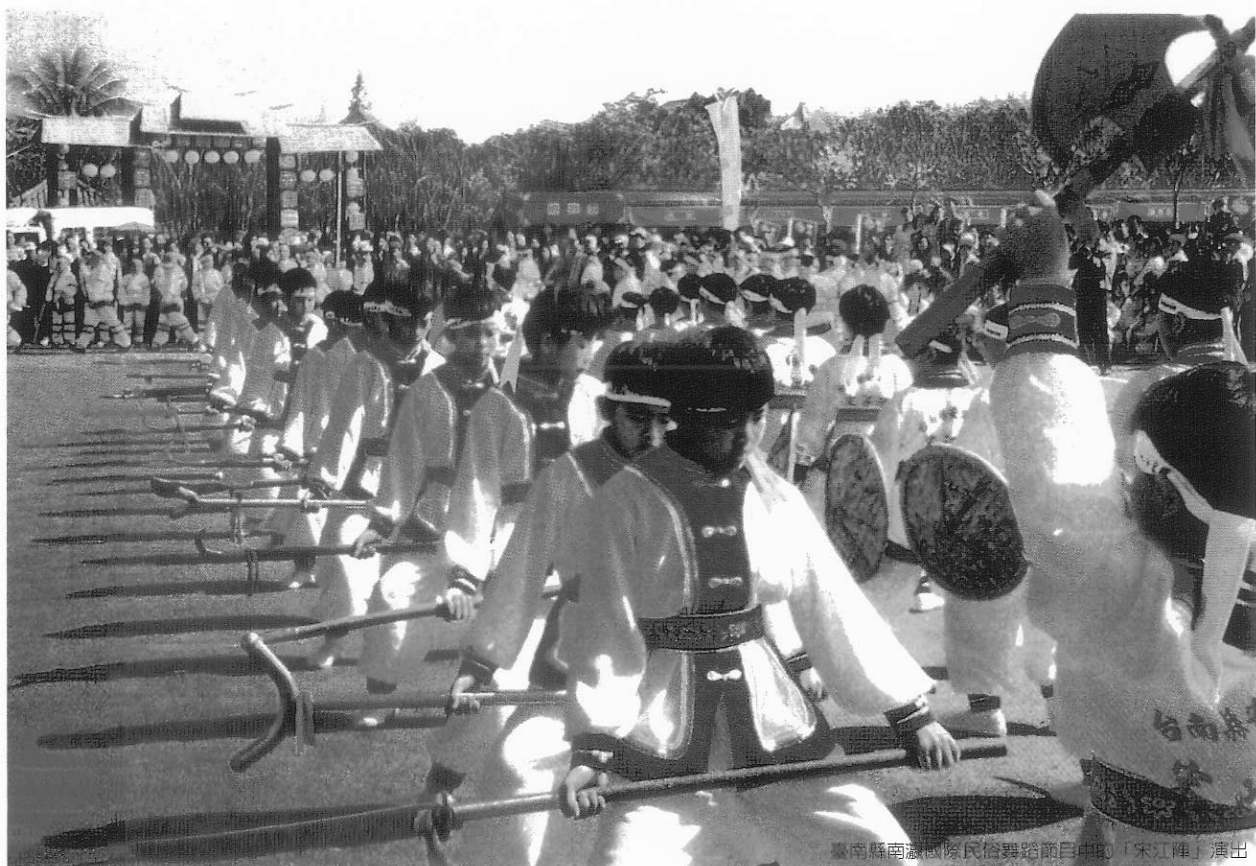
臺南縣南瀛國際民俗舞蹈自中即「宋江陣」演出