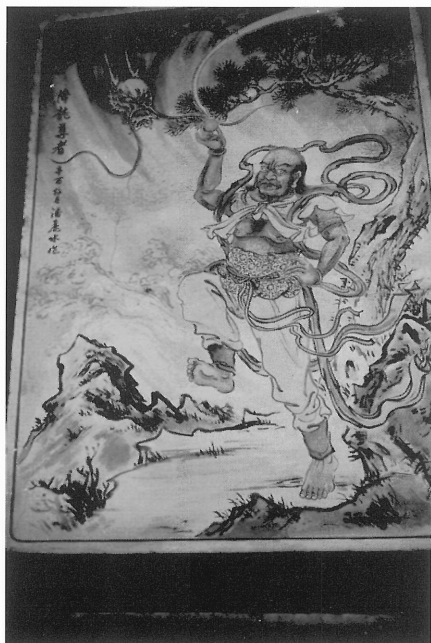
5-24 降龍尊者彩繪壁畫