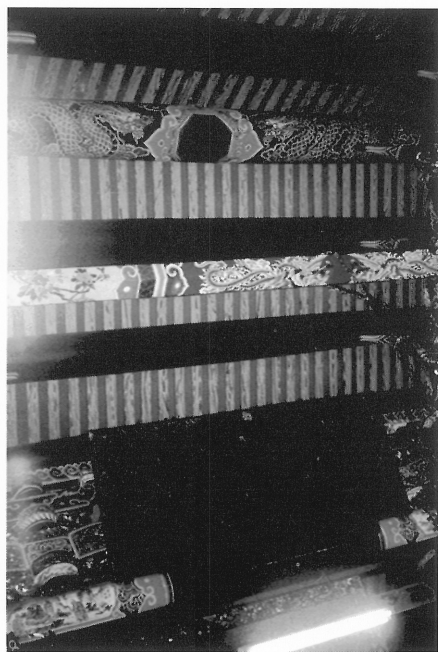
5-23 台北市萬華清水祖師廟主殿匾額樑脊彩繪 中柱脊樑之太極八卦樑繪畫