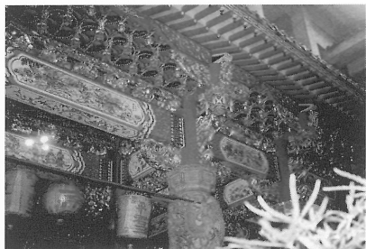
5-19 樑枋斗座雀替之彩繪