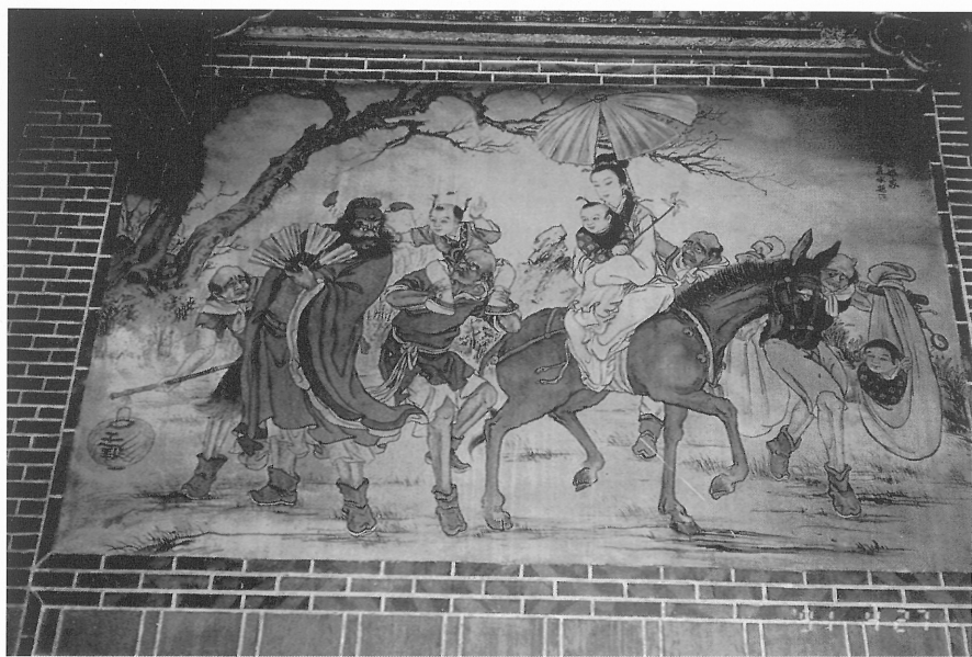
大龍峒保安宮彩繪壁畫，鍾馗嫁妹