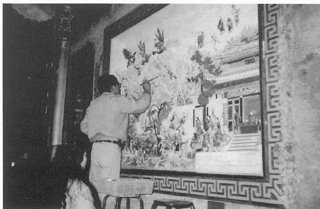
5-21 彩繪封神榜演義壁畫