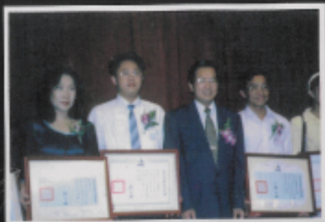
藉由教育工作來創造無窮的期待與希望，讓青少年朋友感到無限的希望與快樂！