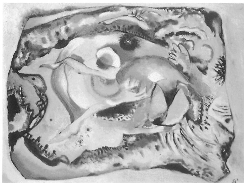
圖 21-7 背景亮麗的畫 康定斯基 1916

在這樣進階的學習過程中，也許我們開始喜歡原先不了解的或排斥的藝術。或者也許我們始終對寫實風格以外的繪畫無動於衷，但是至少知道了很多美術製作的常識和美術史的知識。這種結果雖看似無用，但已對日後我們