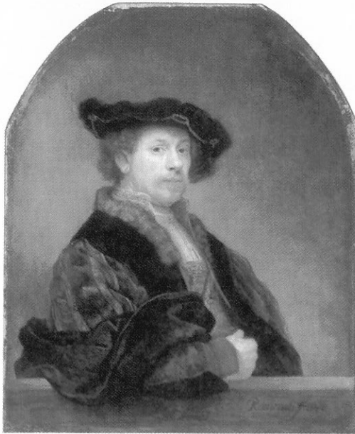
圖 21-1 自畫像(Self-Portrait) 林布蘭 1640