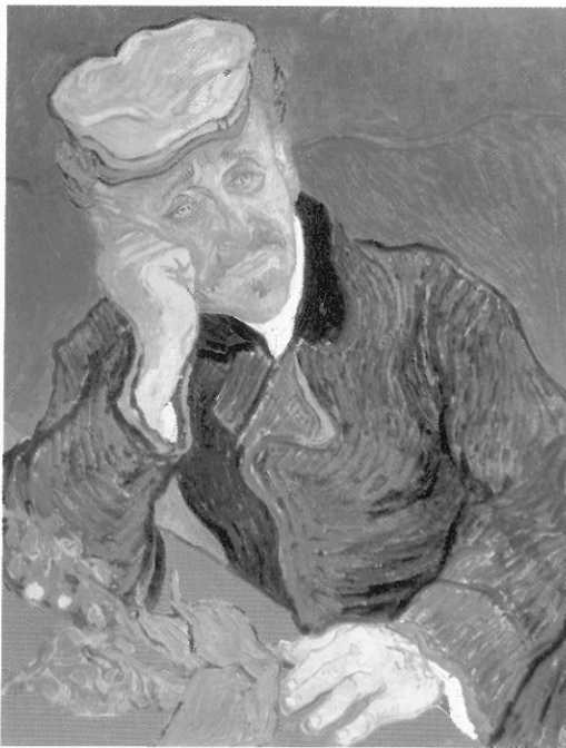
圖 21-3 賈歇醫師的肖像(Portrait of Dr. Gachet) 梵谷 1890