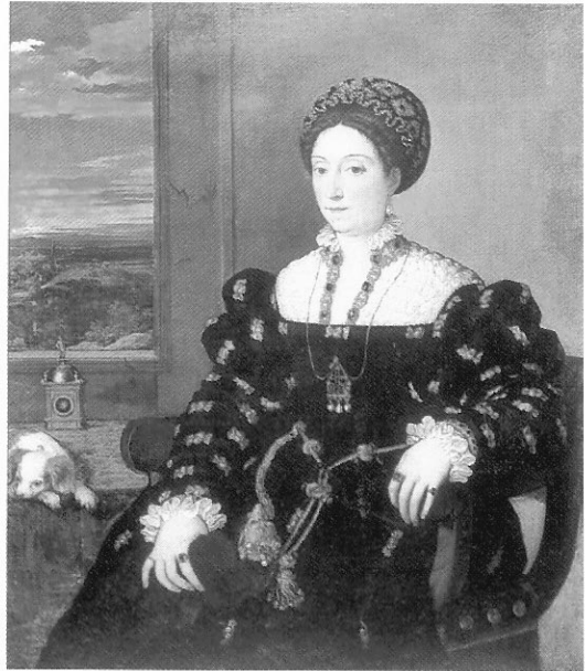
圖 21-2 伊莉諾拉的肖像(Portrait of Eleanora Gonzaga) 提香 (Titian Vecellio, c.1487/90- 1576) 1538