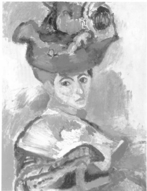
圖 21-4 戴帽子的女人(Woman with the Hat) 馬諦斯 1905