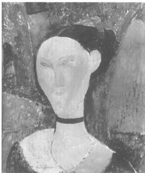
圖 21-6 戴著黑絨絲帶的女子(Femme au Ruban de Velours) 莫迪里亞尼(Amedeo Modigliani, 1884-1920) 1915