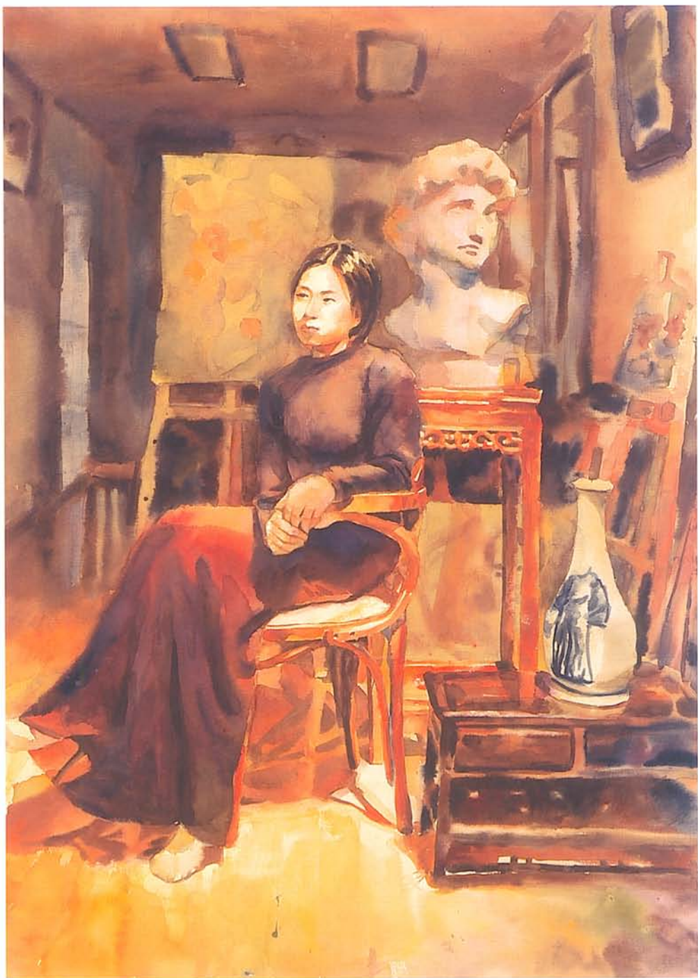
水彩《第三名》 成至中 無題