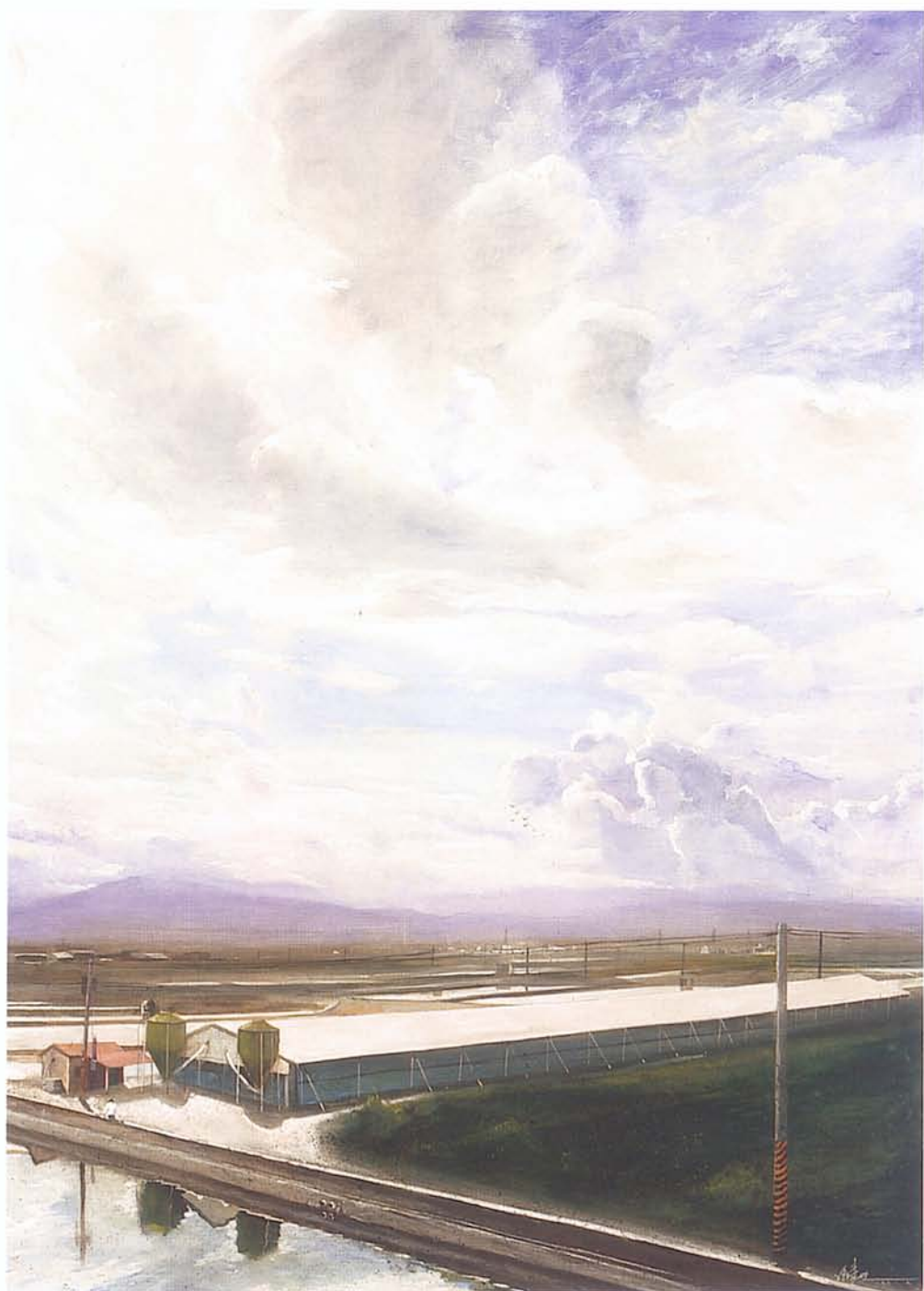
水彩《佳作》周珠旺 我家旁边（二）