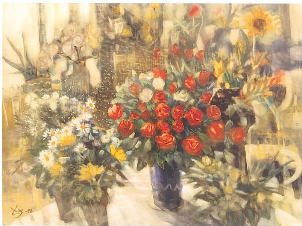
水彩《佳作》 張培均 燦爛時光