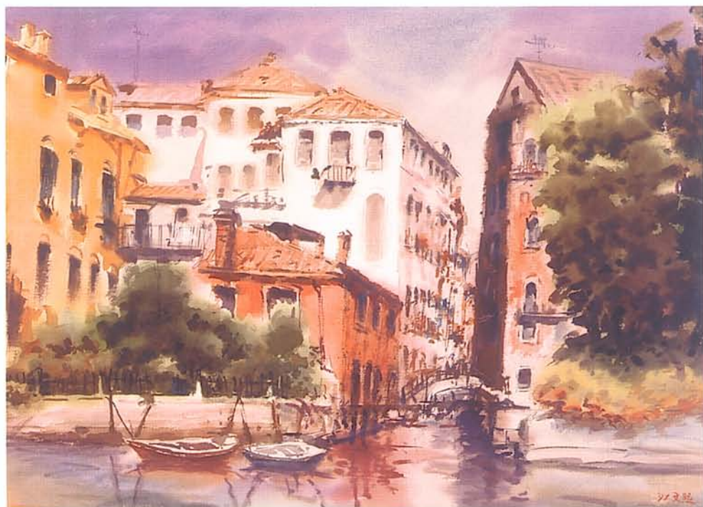
水彩《佳作》林文照 水都威尼斯