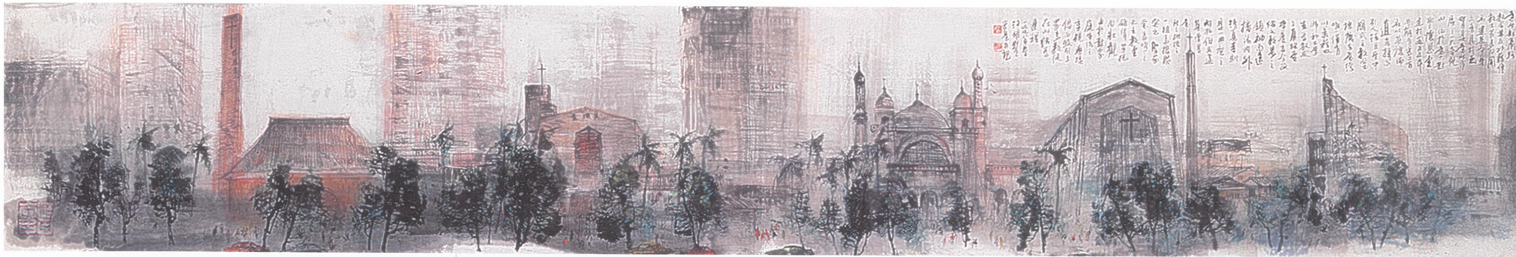
台北天堂之路 【 240×40cm 】

不變的車陣和車速；相異的街衢風貌，新生南路一棟棟巨大奇觀的建築，正為台北市宗教信仰做下註記。不論是古典或新潮，整條教會街散發著一股沉穩的美麗。