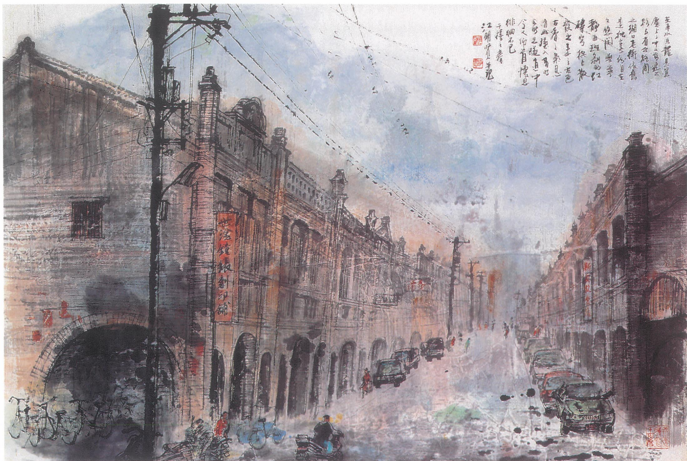
湖口鄉韻 【 90×62cm 】

有一條老街，就在新竹縣湖口鄉的土地上，它沒有太多聲音，沒有過多喧嘩，以至於大家的印象中只有三峽老街、迪化街。