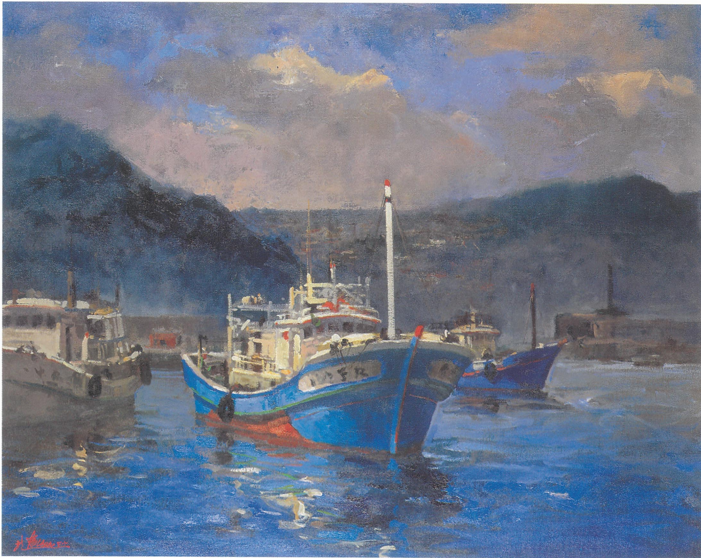
映象·番仔澳 【 30F 】

台灣北部的「海神樂園」在哪一方？「番仔澳」怪名字沒聽過？第一次接觸，「紅毛番」（印地安人）的側面造型遙遙在望，印象極為深刻；第二次，任誰都會忘情其鬼斧神工般的海蝕地形景觀；多次往返後，漁村綿實渾厚的生命樂章，正是畫家所追尋的……。