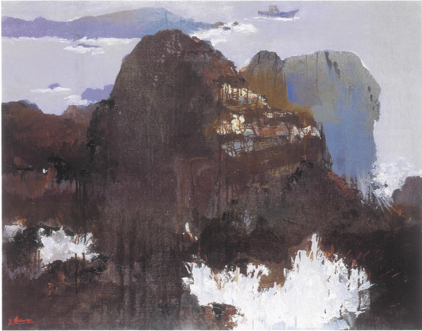
海奇崖 【 50F 】