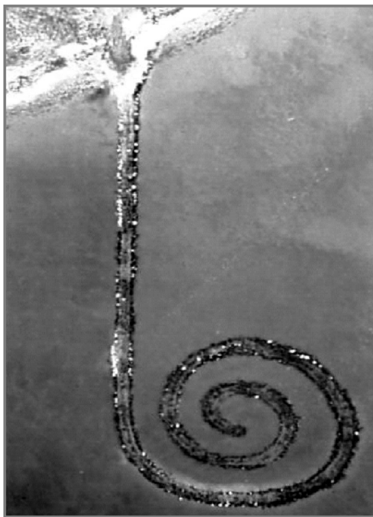
圖2-1 Robert Smithson 1970 螺旋形防波堤 猶他州大鹽湖