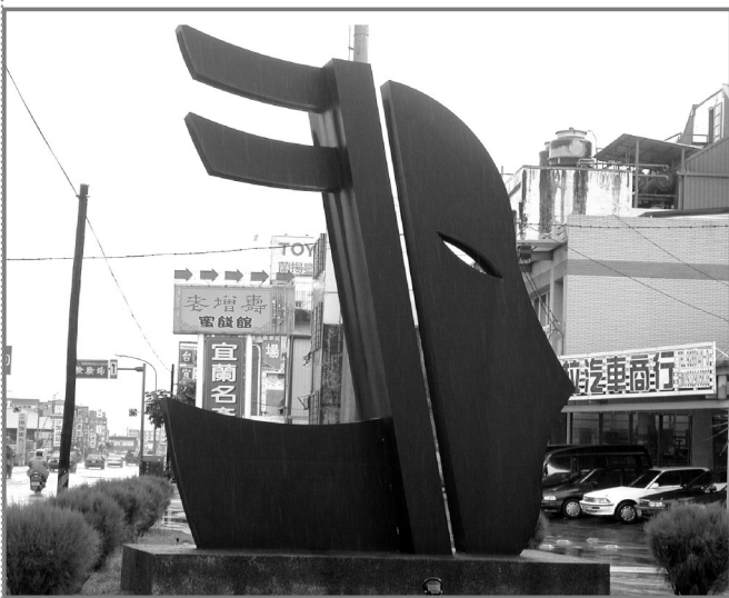
圖1-1 宜蘭的地標：歌仔戲頭像