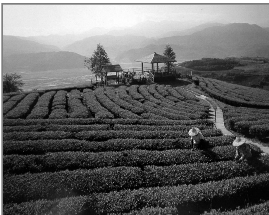
圖2-2 林宗評 1993 宜蘭縣 玉蘭茶園 120 45mm F16 S1/15