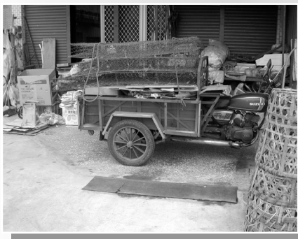
圖3-4 張鑫熙 2003 拾荒者（宜蘭縣）