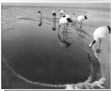
圖3-2 王徵吉 丹頂鶴 1995 中國札龍 Canon ESO-1N 70~20mm f8 auto