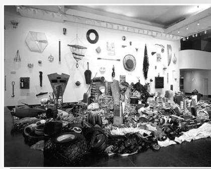
圖3-3 Donald Lipski, 1998, Pieces of String too Short to Save. Brooklyn Museum