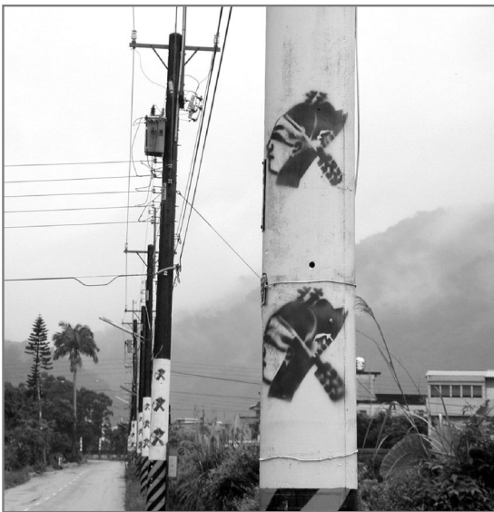
圖1-2 枕山村電線桿上的地標：歌仔戲頭像