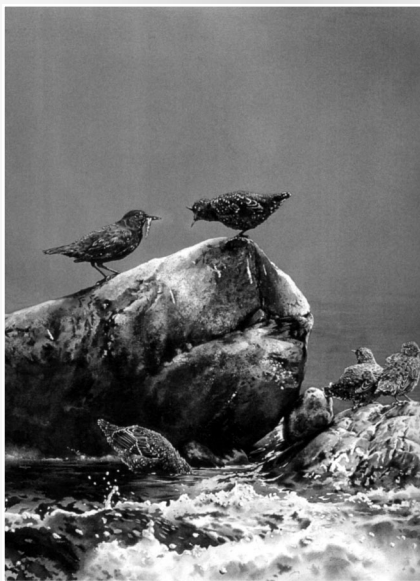
圖3-1 楊恩生 河鳥（局部） 1991 水彩、畫紙 150×100公分 私人收藏