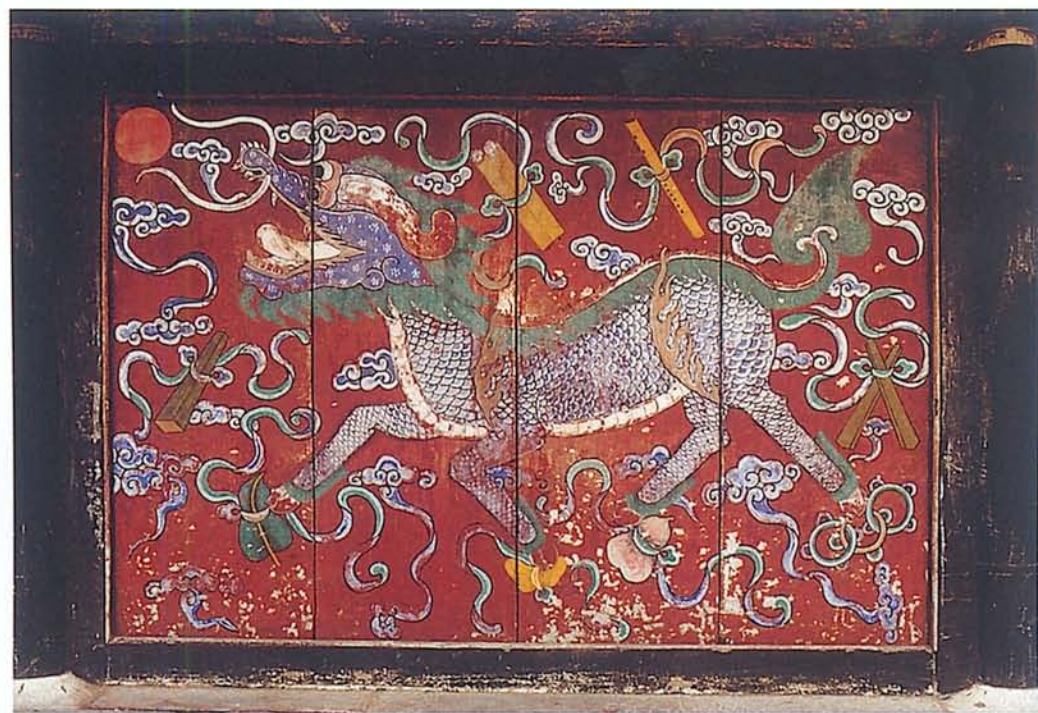
圖九·孔府屏門上巨幅麒麟圖。 傳說孔子誕生時天降麒麟吐玉書；意即太平盛世降臨。（一九九四年攝於山東曲阜）