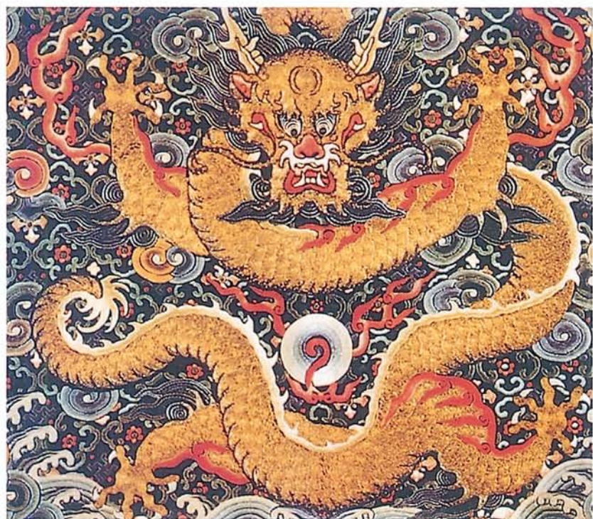
圖一〇·清代「正龍圖」。龍係由九種動物的特徵加以虛擬整合；是英勇、權威和尊貴的象徵。