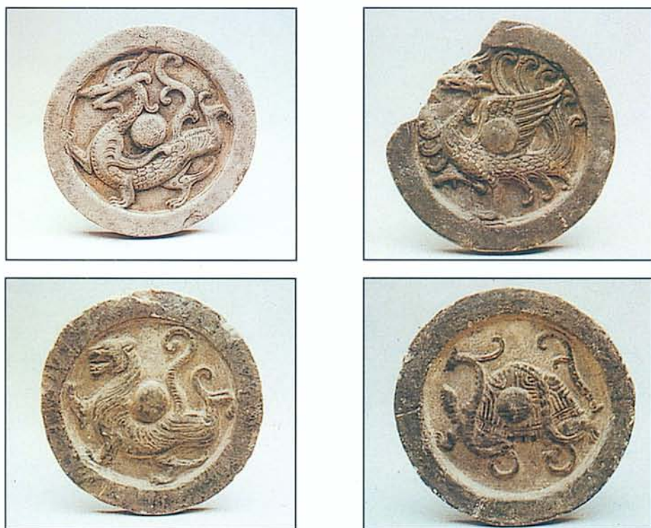
圖六·西漢「四靈」瓦當，分別為：1.青龍紋2.白虎紋3.朱雀紋4.玄武紋（中國西安·陝西省博物館藏）