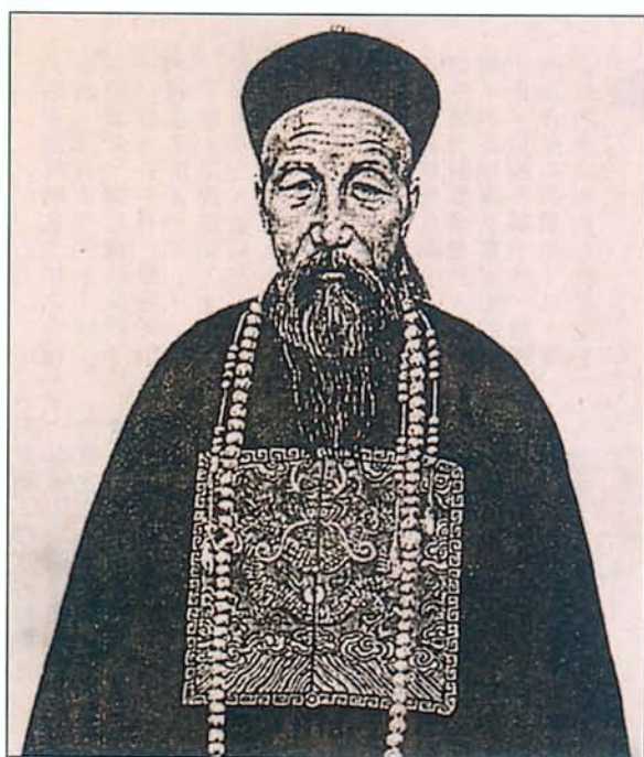
圖一·用「章補」做官服，最能彰顯身分品級的視覺焦點。 圖為清代中興名臣——曾國藩。