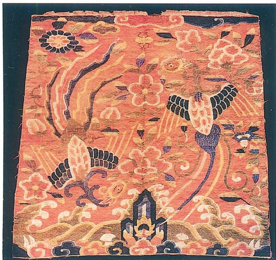
圖七·明代刺繡鳳凰補子，紅色背景是以納繡針法繡成菱紋地，此技法僅見於明代補子，不見於清代。（出自《錦繡羅衣巧天工》頁二六七）