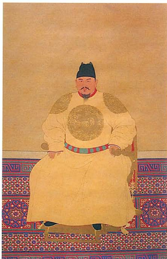
圖三·明太祖像，戴翼善冠，穿金線團龍袍（台北故宮博物院藏）。