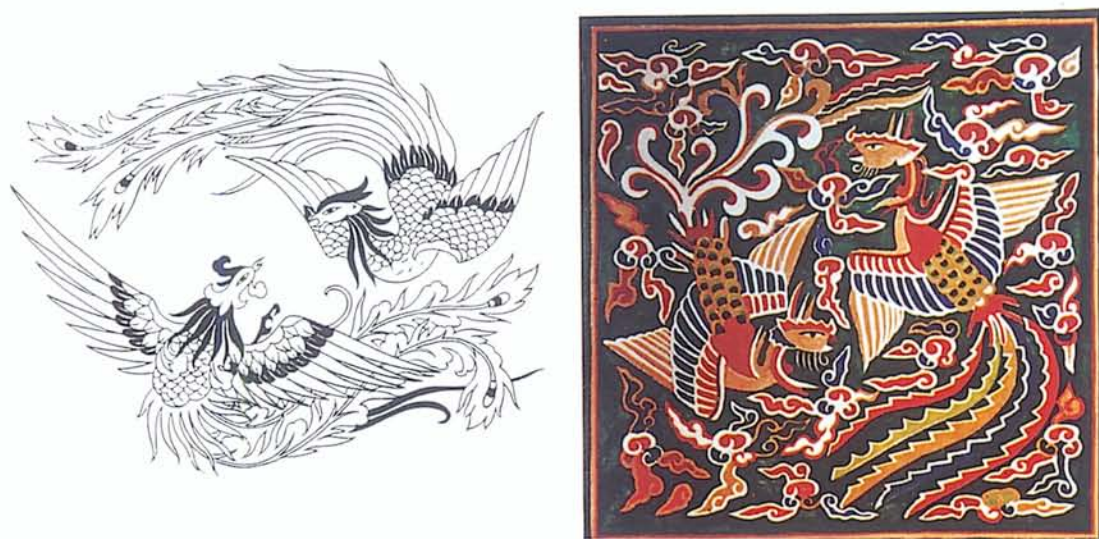
圖八·左圖為「鸞鳳和鳴」比喻婚姻美滿，夫妻和諧。右圖為韓國民俗畫家金萬熙手繪作品。