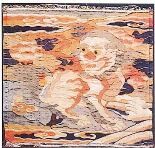
圖四·明代文武官補子， 左上圖為絳絲六品文官補子——鸞鷲。 左下圖是絳絲五品武官補子——熊羆。 (出自《錦繡羅衣巧天工》頁二五六，頁二五七)