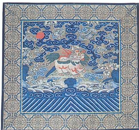
圖五·清代文官章補(右上圖)武官章補(右下圖) (輔仁大學織品服裝研究所「中華服飾文化中心」藏)