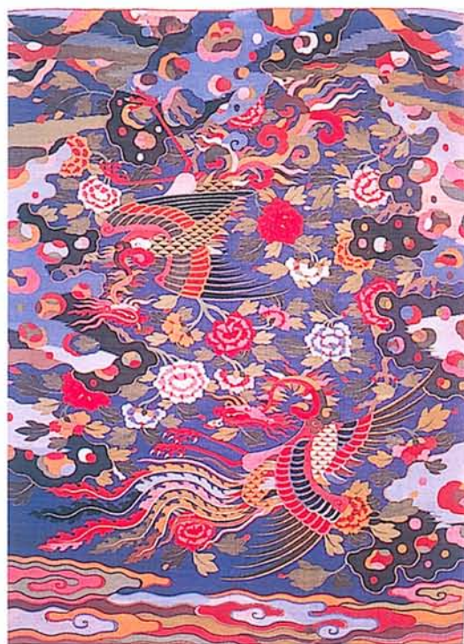
圖一一·被譽為「百鳥之王」的鳳凰，是封建王朝最高貴女性的代表，與帝王的象徵——龍相配。 右圖為絳絲雙鳳掛幅，約明嘉慶年間，244 × 183cm。