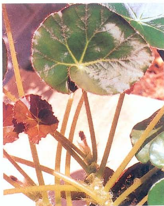
圖二 此圖若以花莖為「正」，花葉為「側」；則顯然在我們欣賞此花時，葉卻成了主體，就形成了以「側」代「正」的局面。

「袞袞清客夢；詩畫故人情」1895年作時年73。由於他不平凡的生活經驗，使他能體悟出枯寂的美感，並能把它表現於書藝中。其畫中所表現之枯寂感尤顯。此枯寂感亦「側」之一種。