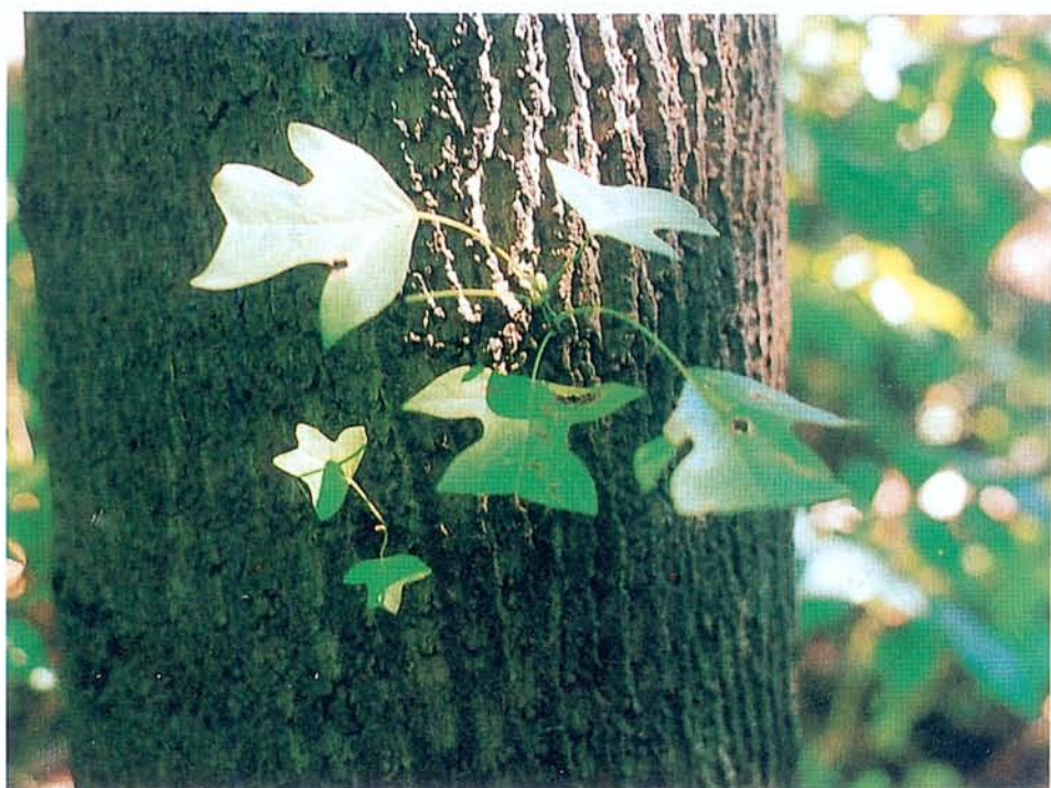
圖一 在一棵大楓幹上，突然長出一兩小枝幾片綠葉（入秋轉紅），有令人驚奇之美感。若以楓幹為「正」，此數片葉當可視為「側」。

天資低、意志弱，多不能自我振拔，倒不如狂狷之士，反能激揚亢進以達於道。由狂狷這條偏（側）路進入道，固然不放心，也不很理想；然總比老老實實毫無個性、全無進取心者好的多。