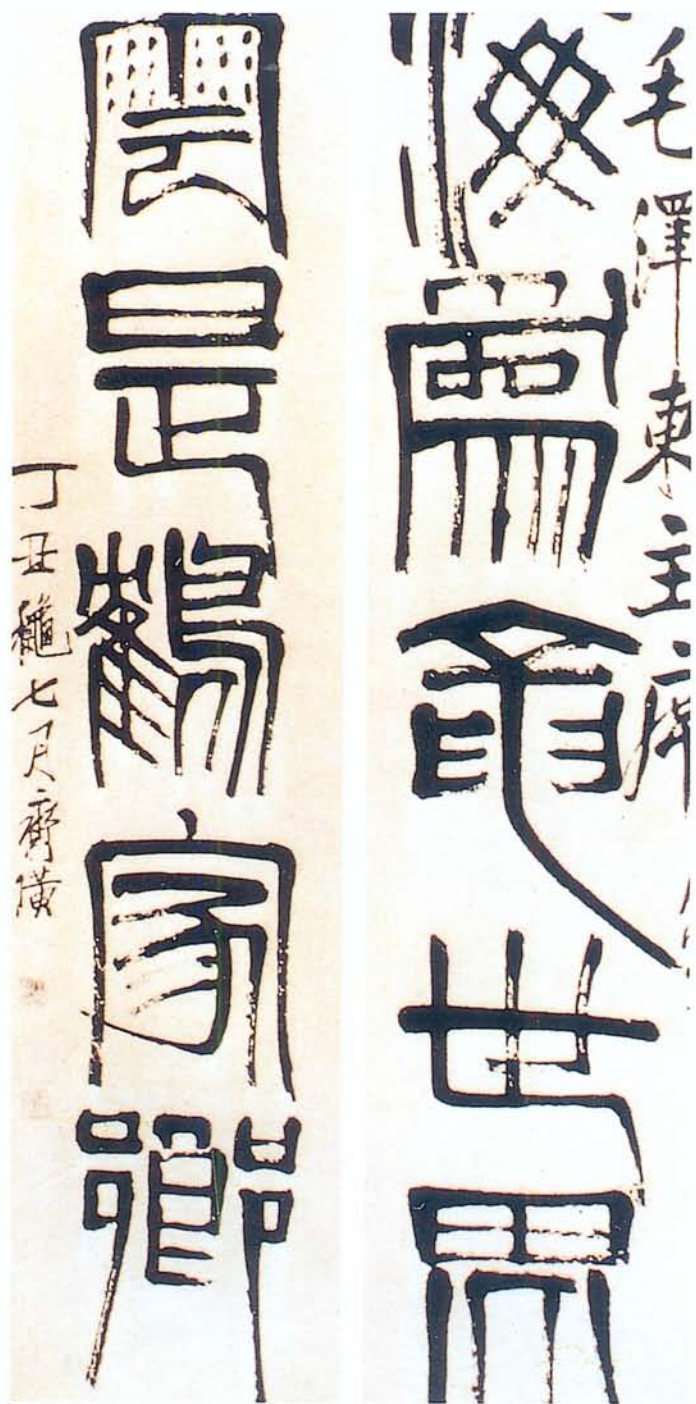
圖六 齊白石《篆書聯》1937作七十七歲

一九九〇年春某日，我在誠品畫廊地下室書店，無意中發現一本《齊白石（人與藝術）》：齊白石自述。張次溪筆錄，足之豐