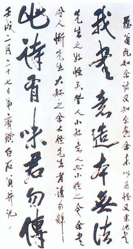
圖八 齊白石《草書聯》1922作年六十 此書比「海」聯早十五年。其時他的書還少為人所賞識，但此書卻很有味，也很難說出它的來歷。或正是聯語中的「意造無法」。

愚翁既知余詩，又知余畫，余未以為怪，又索此書，先生之好怪矣，昔人小稱意，人必小怪之，今余書令人慚，先生大稱之，余大怪先生者請勿辭。壬戌二月二十七日弟齊璜白石翁並記。