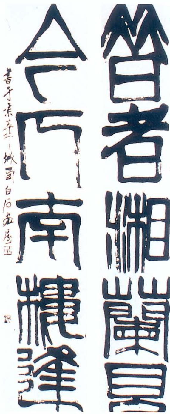
圖七 齊白石《贈秀儀篆書聯》1953作 此書很合於饒宗頤的「重」、「拙」、「大」三個標準，卻沒有「海」聯那樣精神抖擻，陽氣四射。