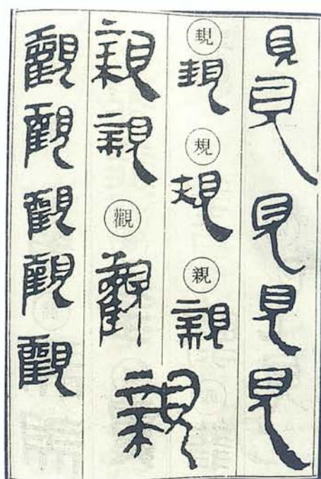
圖二 漢馬王堆帛書文字（採自李光正編《馬王堆漢墓帛書竹簡》，湖南美術社，1988）。漢簡、帛書中書法體勢右下傾斜的例子很多。章草右下傾的例子也很多。漢碑（隸）還有些字有右下傾之勢。六朝摩崖中右下傾者仍偶見之。此後則漸少。

愚省既知余前又知余愈余未以為怪又索此是 我老 意造 本無法 先生之好怪異，管人小稱，高人心小怪，二令余也 令人慚先生大稱之，余大怪先生者，請勿辭！ 此待有 味君勿傳 壬戌二月二十七日 齊白石印譜序