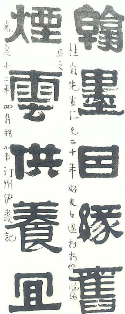
圖五 伊秉綬(1754~1815) 隸書聯 伊氏的隸書源於漢碑，有人說他加入了顏法，或說他隸中參以篆味。我認為伊氏在書法上有兩大特點：一是用方和用側，且保留了顏體的圓潤、富厚味；二是「白」的妙用。如此聯中「因」字中間的「三」，「宜」字中間的「三」均極妙。