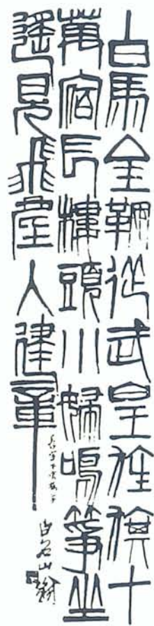
圖七B1 齊白石(1863~1957) 篆書立軸。白石老人法書傳世不多，但卻有不少「驚天地，泣鬼神」之作。此幅已將傳統篆書之章法（結構）完全打散，重新加以組合。拙味妙趣無邊。如「白」字，其內部之「二」，以二爻觀之可也。