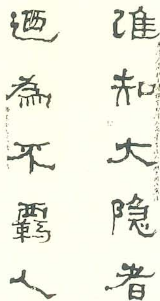
圖二B 臺靜農(1902~1990)隸書 此臺老晚年書，自稱「用漢人簡札書法」，與李瑞清、曾農髯相比，可見其創意較多。又李得年五三，曾亦未過七十。臺老此書應在八十之後，閱世不同故也。