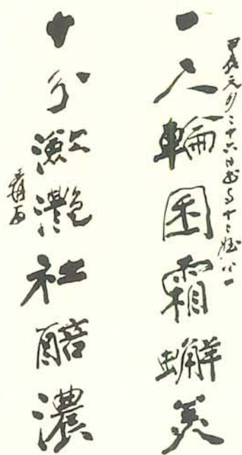
圖三A 張大千(1899~1983)贈姪心一聯。張氏人格崇尚唐宋，此書有蘇、黃趣味。結體用「側勢」，乍看有類鄧板橋。用筆則方(側)圓兼施。