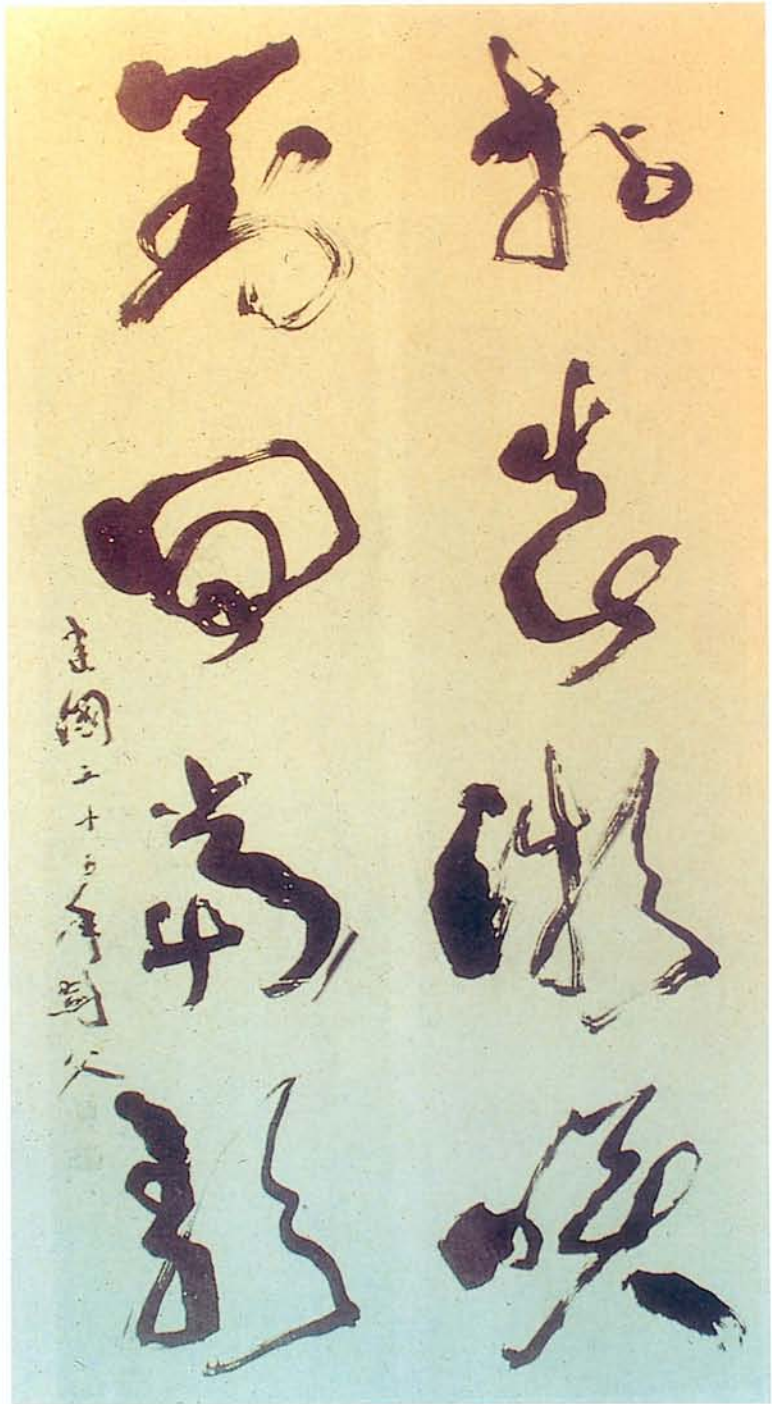
圖四 高劍父《草書聯》(拈花微笑，對酒當歌)