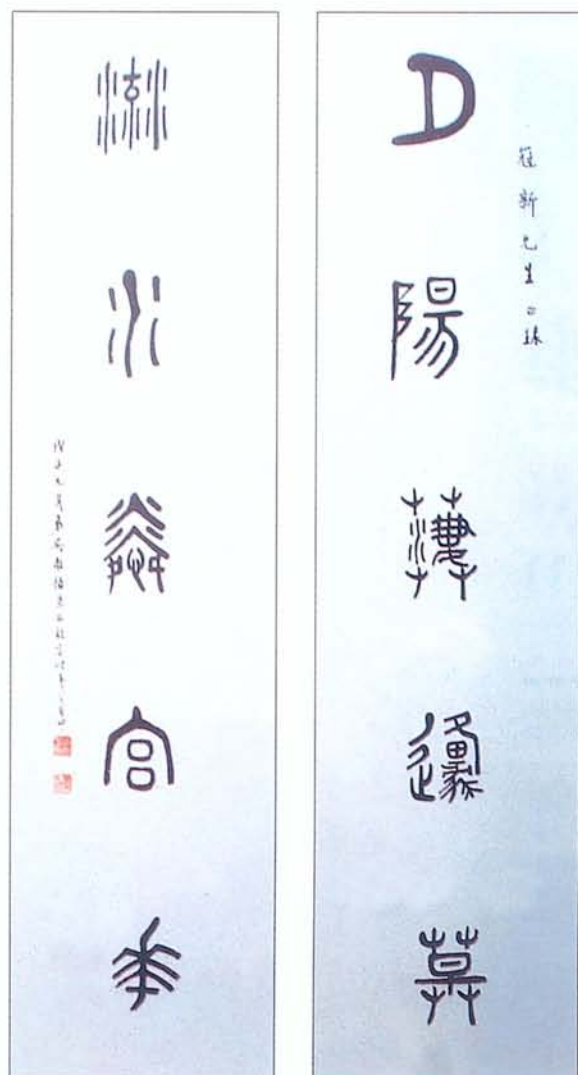
圖五 吳稚暉《大篆對聯》