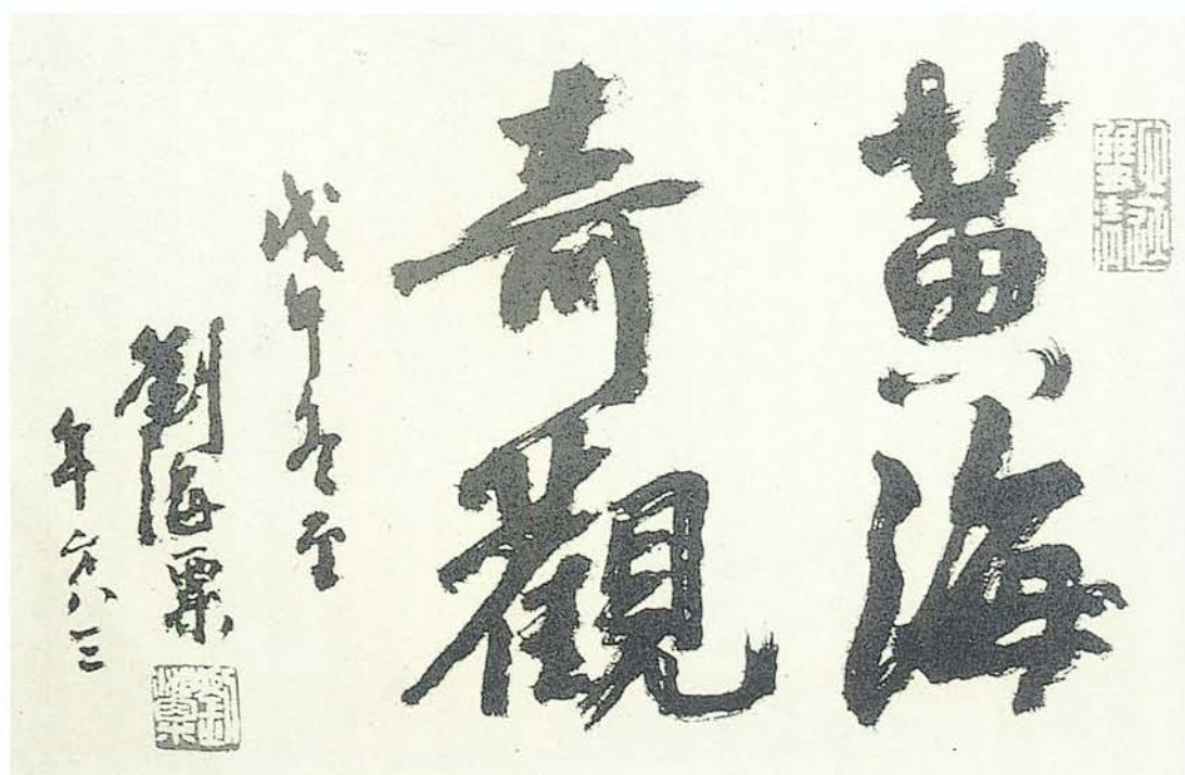
圖八《黃海奇觀》四字 劉海粟（1896～1994） 劉先生書法可列入「畫家書」一類。