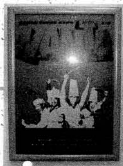
圖：亂打攝影劇場海報