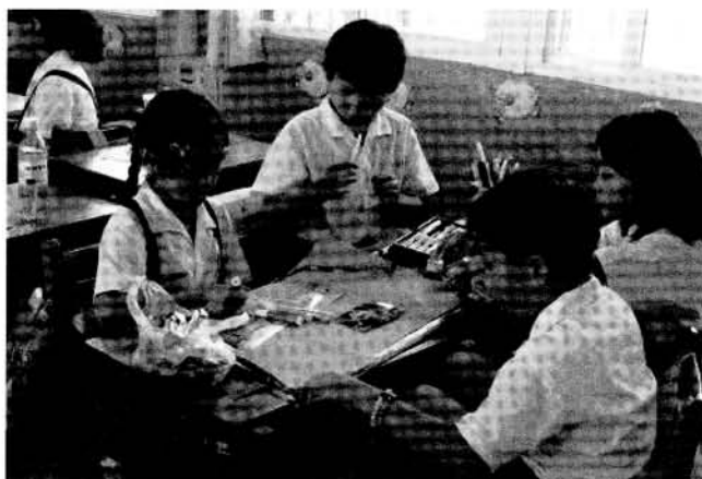
「我可以來畫沙灘和螃蟹，你呢？」(小組成員彼此分享並完成海報)