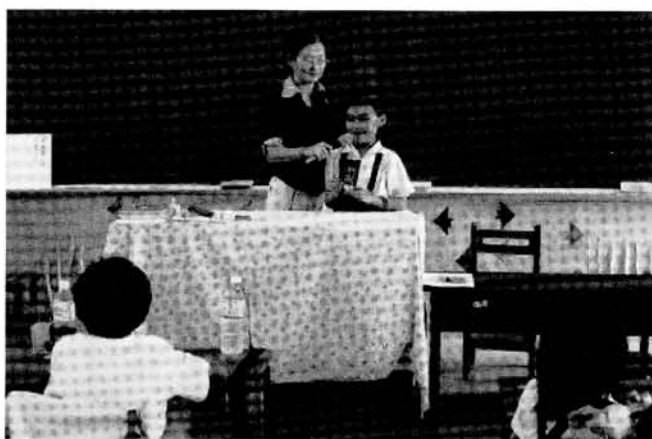
「爸爸帶我去黃金海岸放風箏……」(學生上台發表與家人同遊黃金海岸的經驗)