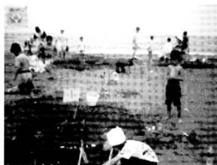
「猜猜看，我們創作的主題是什麼？」 (學生發揮團隊精神完成沙雕的創作)