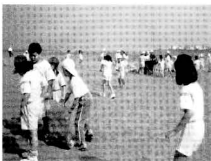
「加把勁，看來我們可是大豐收呢！」 (透過淨灘活動賦予黃金海岸新風貌)