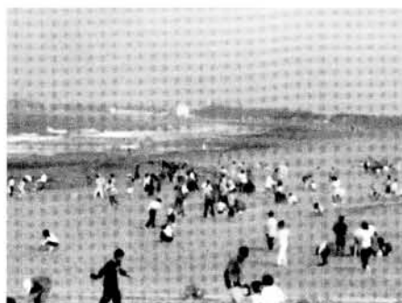
「比比看，咱們看哪一組撿最多！」 (學生們共同展開淨灘的活動)