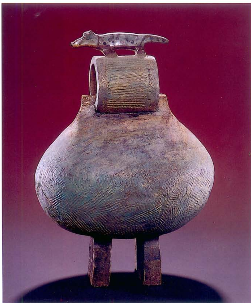
錢正珠 Chyan Tsien-Tsu 守歲 New Year's Eve 16×30×40 cm