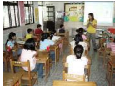
利用投影片講解雕塑作品的技巧及注意事項