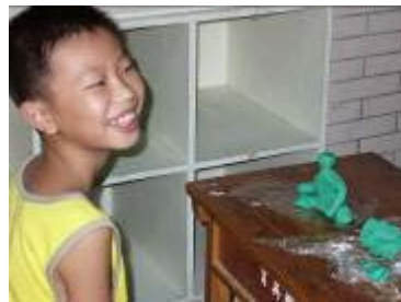
小朋友完成作品的開心模樣