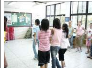
在通過舞台的這一小段時間裡，要把大家的創意都表現出來