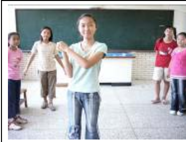
奧林匹亞運動會，在這裡展開了，猜一猜我表演的是哪個項目呀！