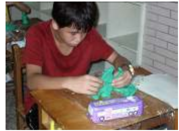
小朋友實際捏塑作品，展現創意