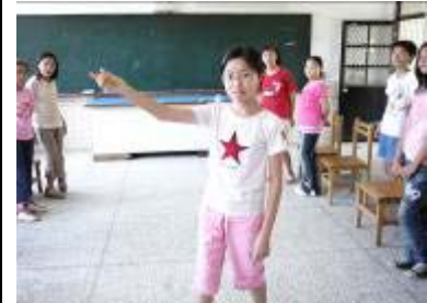
看我的動作如此優雅，你猜出來了嗎？我是在丟飛盤喔！