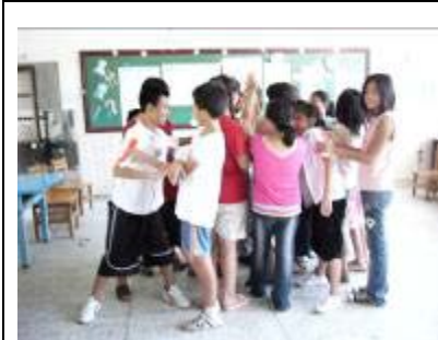
所有的子珊瑚都依附在母珊瑚的身上，拉近大家的距離