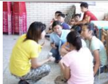
小組討論的時候，教師適時給予指導，會使表演活動更流暢