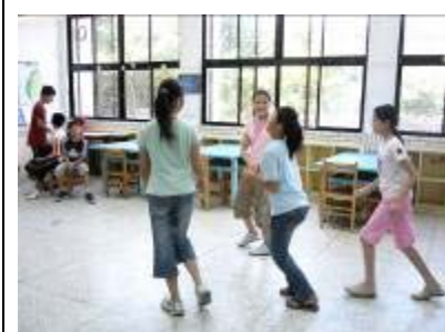
小組的即興表演最能展現創意，所有意想不到的創意，在這裡通通可以看到