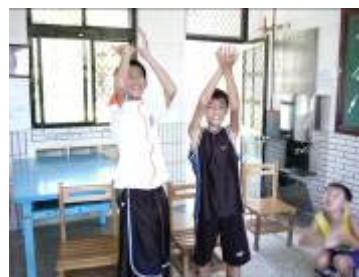
看我們一個人投球、一個人接球，就知道我們是好搭檔。