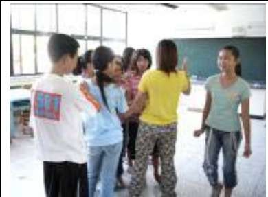
大家都在期待游移的子珊瑚能點到自己，這樣才有表演的機會