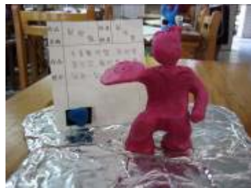
這個丟飛盤的作品，就是教學活動時小朋友創意的翻版