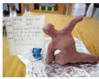
小朋友將教學活動的記憶都展現在泥土作品上