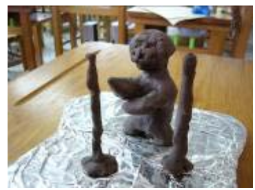
這個橄欖球員連護具都做得栩栩如生