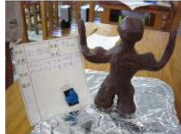
這個肌肉不是每個人都有的喔，我的夢想在作品中實現了