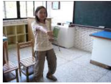
引導學生將動作由律動轉換成定格狀態，觀察肢體的力與美