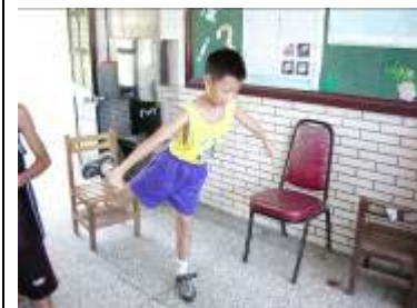
要表現出動作的特性，也要注意肢體的平衡。