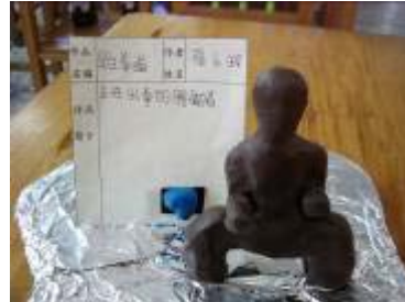
這個馬步是小朋友每天練習跆拳道寫真的寫真，作品與生活融合，生動又切實