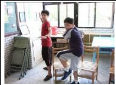
強棒出擊，打遍天下無敵手。