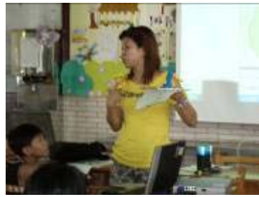
教師將實體作品展示給學生觀摩