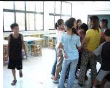
在外面游移的子珊瑚，盡情的舒展肢體、舞動肢體