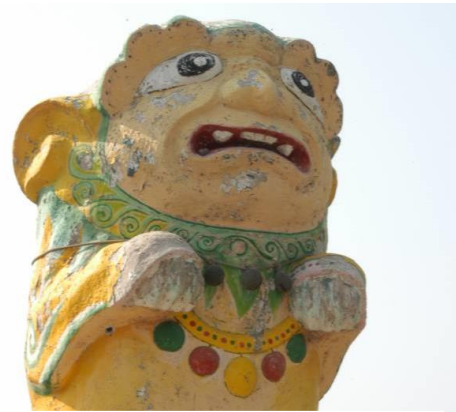
脖子上的項鍊裝飾