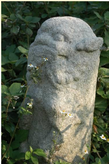
原色樸質的風獅爺

◎彩繪：風獅爺有些是未彩繪，保留原本的樸質色調；有些則是彩繪上各種鮮豔的顏色，色彩繽紛。