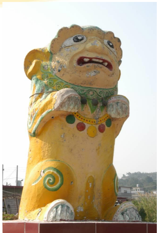
塔后村的風獅爺(雄)