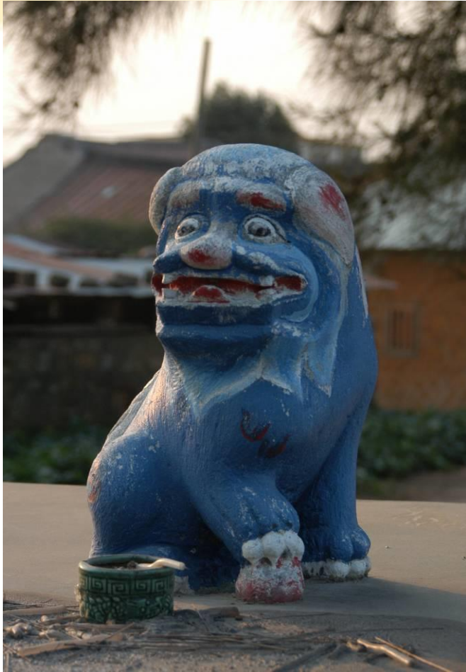
后水頭村-民宅後的風獅爺(雌)