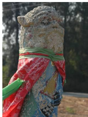
頭頂 脖子 臉部的 雕刻紋飾