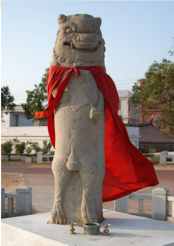
瓊林村的風獅爺(雄)