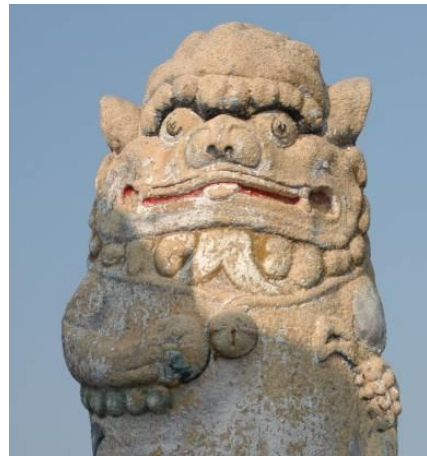
風獅爺 各式臉部表情與紋飾