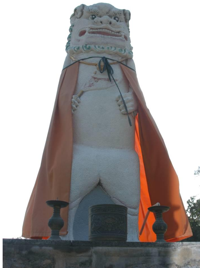
官澳村的風獅爺(雌)