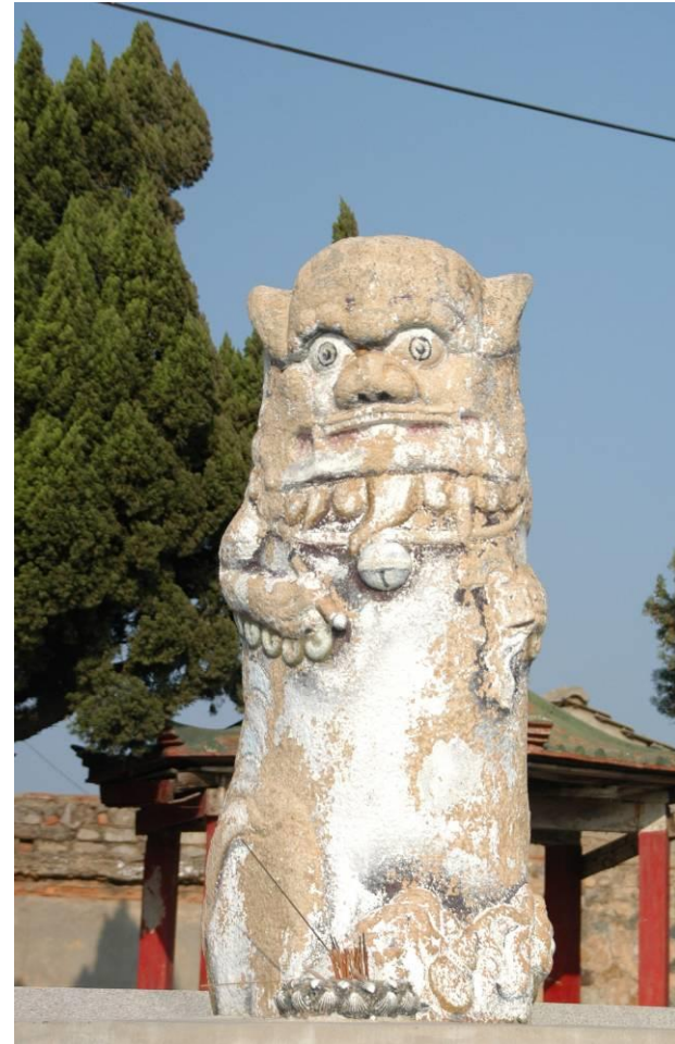
西園村-西園鹽場旁風獅爺(雌)