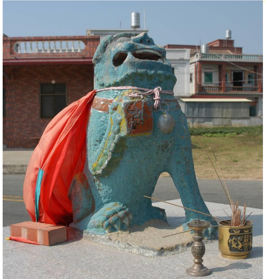
劉澳村的風獅爺(雌)