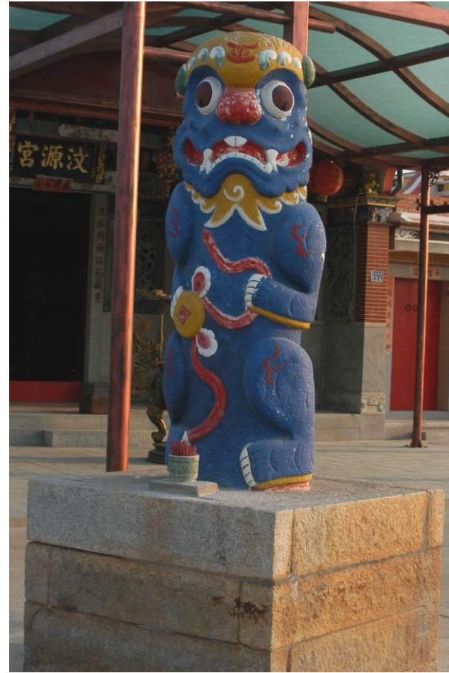
后水頭村-汶源宮前的風獅爺(雌)