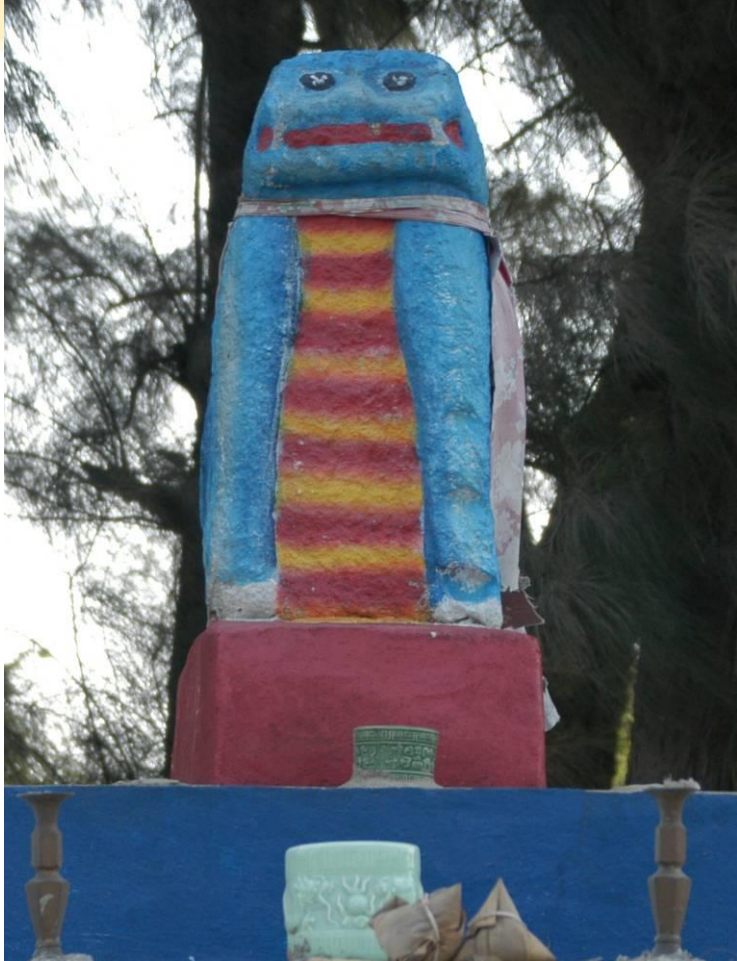
中蘭村道路旁的風獅爺(雌)