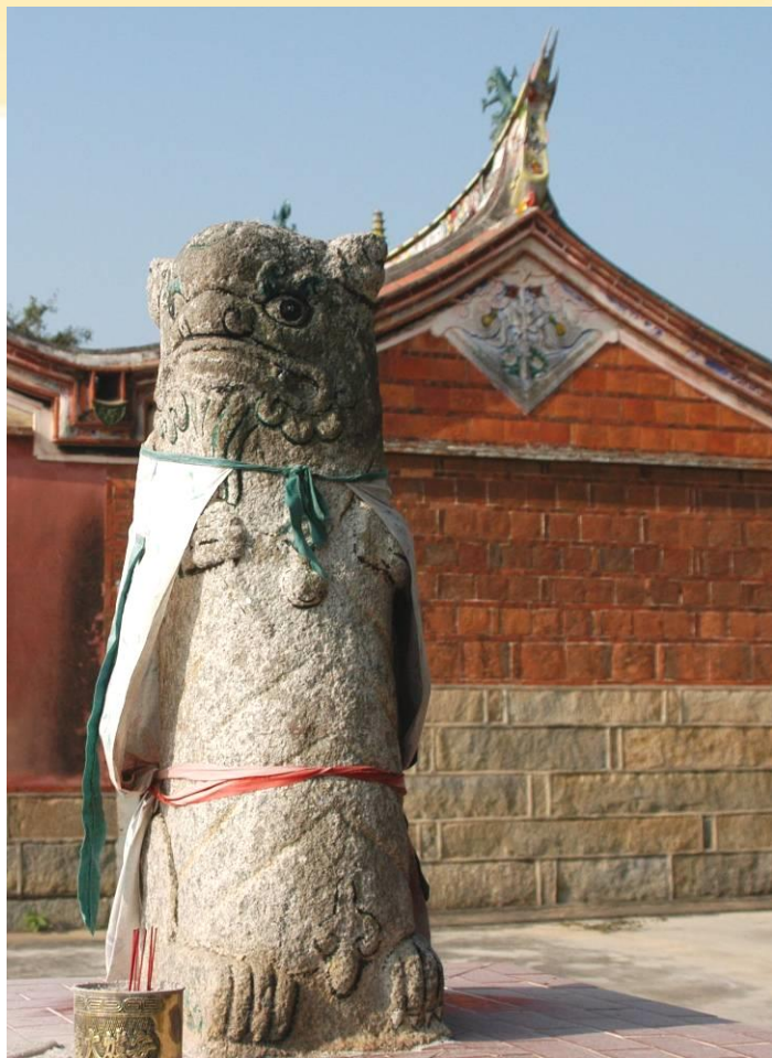
塘頭村的風獅爺(雄)