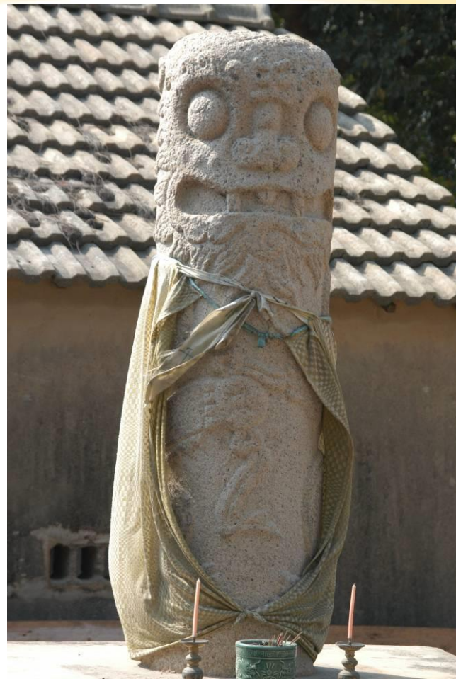
洋山村的風獅爺(雌)