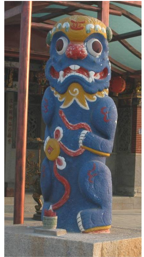
彩繪上顏色的風獅爺

◎彩繪：風獅爺有些是未彩繪，保留原本的樸質色調；有些則是彩繪上各種鮮豔的顏色，色彩繽紛。