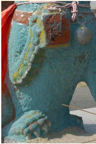
手腳上的 四趾雕刻

◎四肢：手部、腳部的四趾雕刻特徵均十分明顯而立體，有趾頭、趾甲，其手臂與腿腳上並刻繪有裝飾紋路。