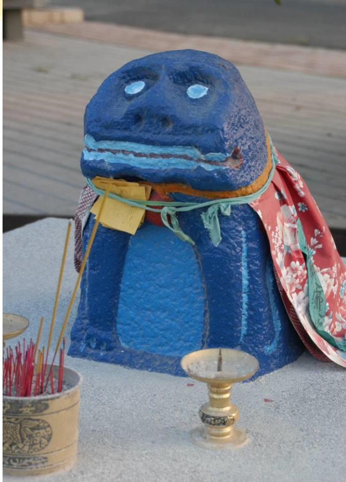
後浦頭村的風獅爺(雌)