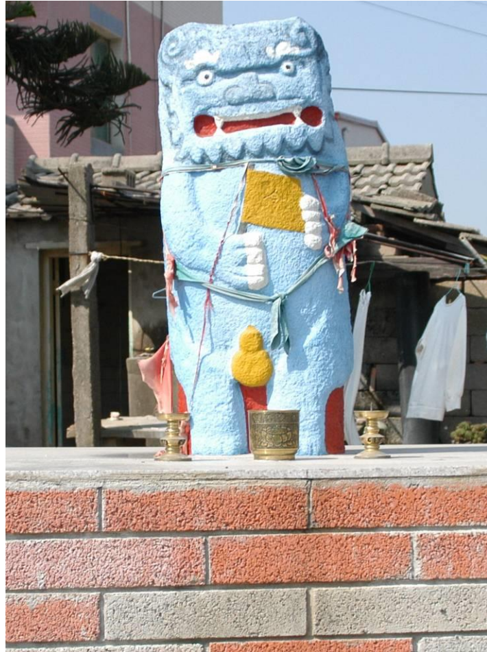
下蘭村-民宅後的風獅爺(雄)