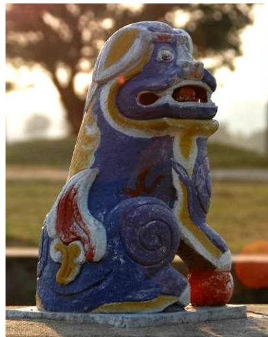
手臂與腿部的 裝飾紋路