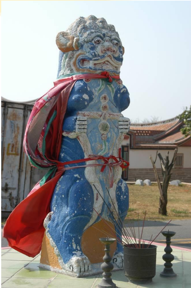
浦邊村的風獅爺(雌)