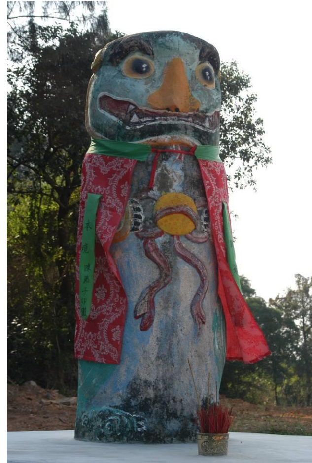
洋翟村的風獅爺(雌)