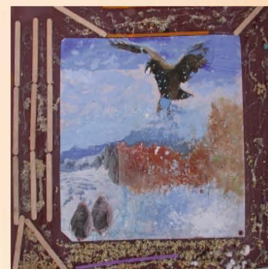
作者：蔡俊傑 題目：海鷗飛翔 用不規則的拓印紋，加上裱貼的海鷗圖案，整個畫面有浪花拍打岩石，海鷗飛舞的感覺。另外，邊框的垂直木樺襯托作品的動感，細碎的穀粒，強調浪花四濺的感覺。