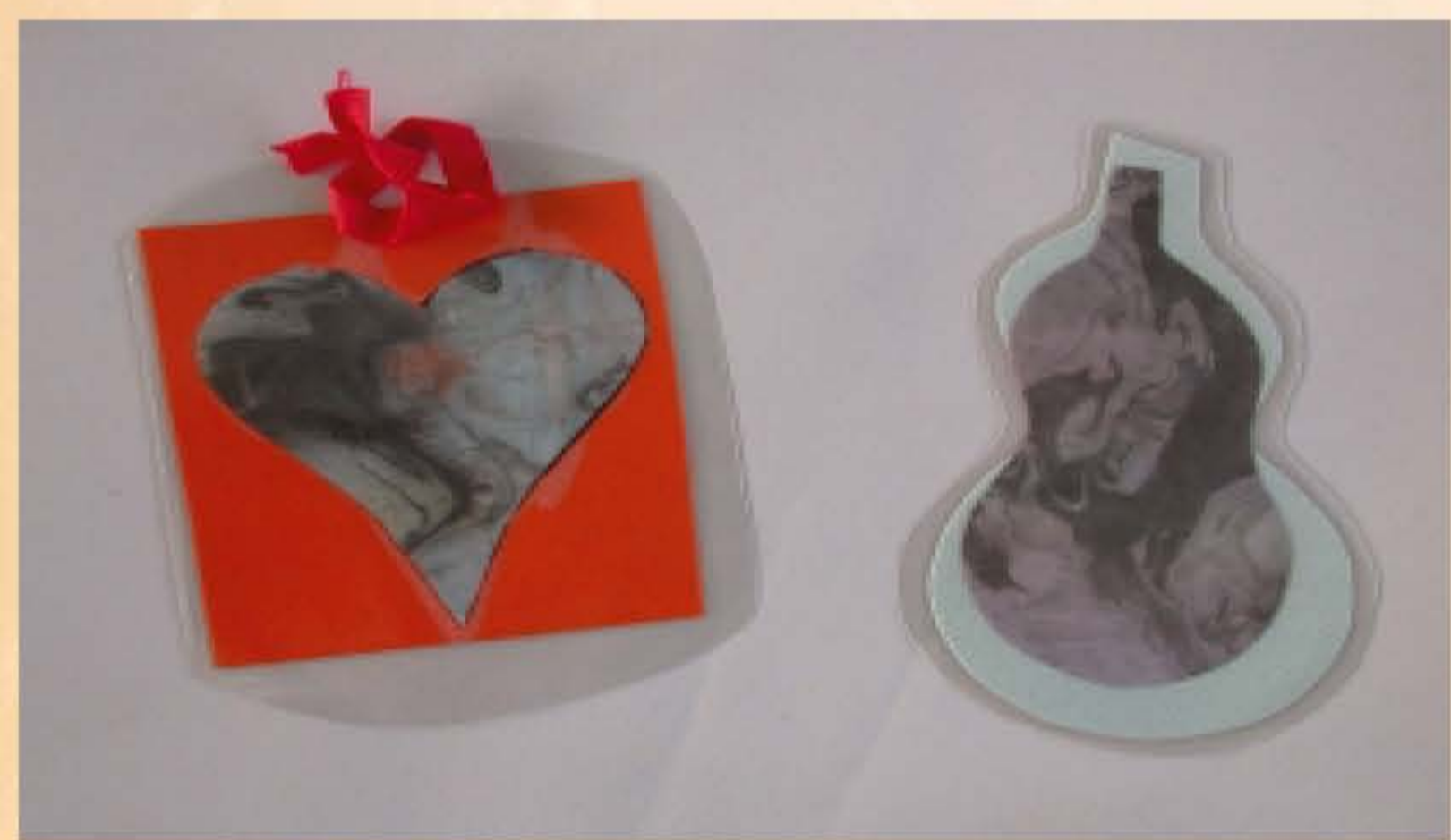
作者：陳俊傑 題目：書籤 將水拓圖案剪裁成心形及壺蘆形，產生不同效果的書籤。