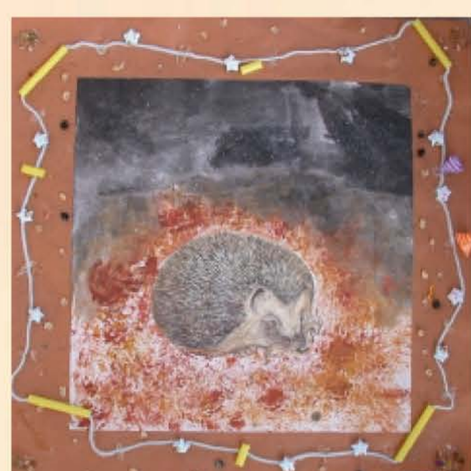
作者：陳慧玲 題目：可愛的地鼠 以不規則的拓印紋來表現泥土的感覺，以濃淡墨來表現地洞黑暗的氣氛，邊框再用毛線、吸管、紙星星、豆子、小石子等的材料作為裝飾，更強調出地洞的感覺。