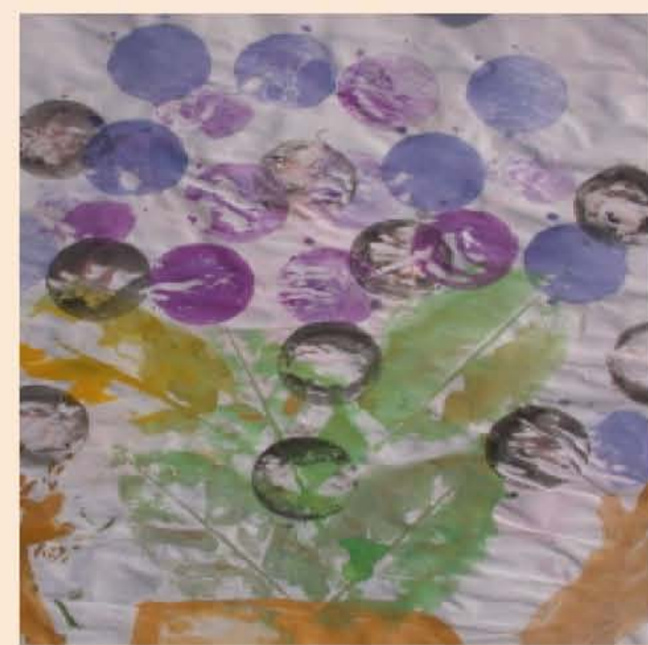
作者：林裕庭 題目：秋天 懂得利用形狀及排列組合，創造具體形象效果。並且在圖形紋中加以變化，增加空間感。