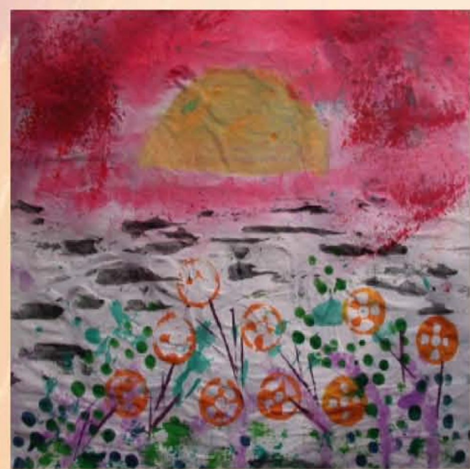
作者：吳姿雅 題目：夕陽景色 以不同的點狀紋、長條狀紋、不規則紋，以及實物拓印圖案，增加畫面的質感與景深，表現出夕陽西下，餘輝盪漾的感覺。