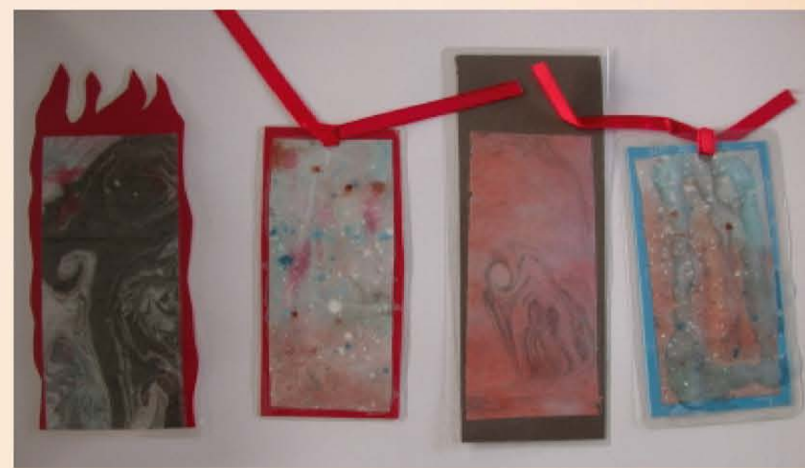
作者：朱茂嘉 題目：書籤 有結合水拓、打點、渲染等技法讓作品呈現朦朧的效果。另外，襯底紙張略作火漆形的變化，也讓作品更具動感。