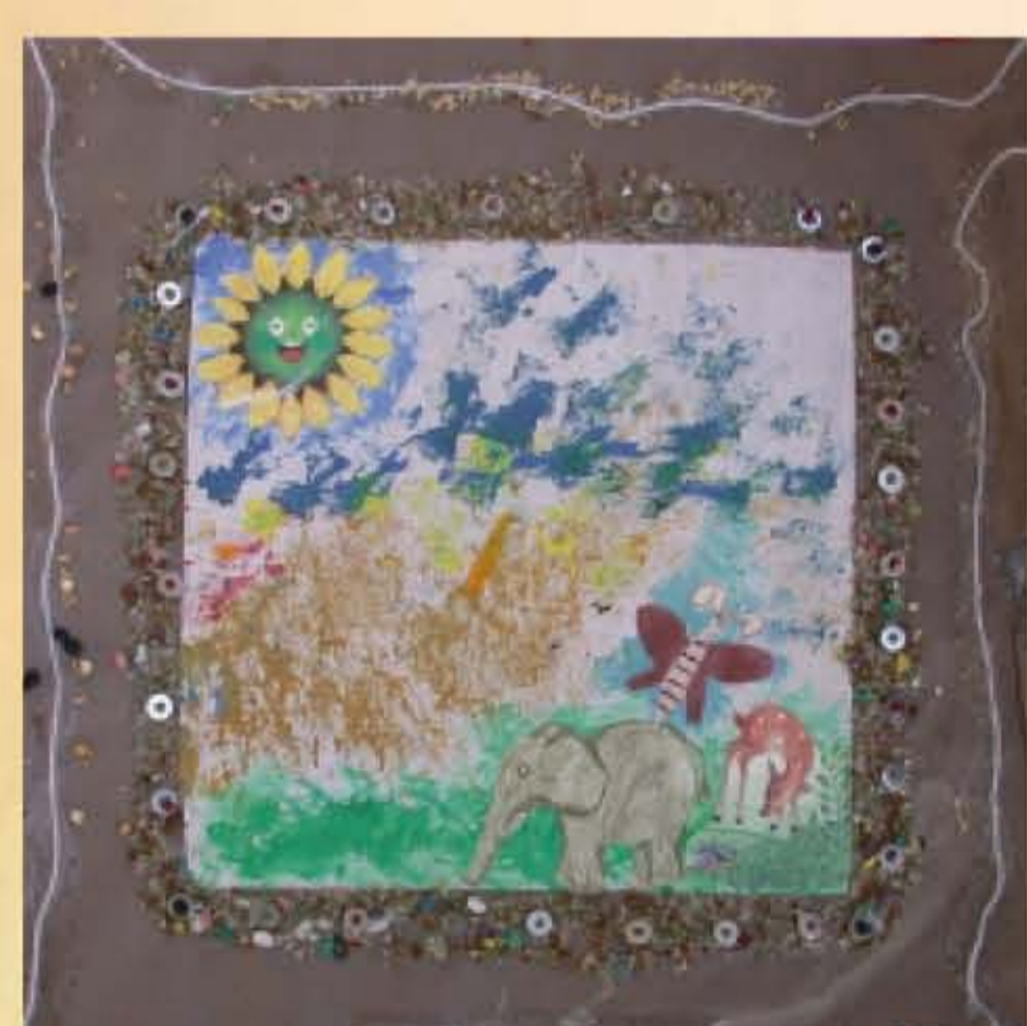
作者：姚嘉媛 題目：春天 巧妙地運用幾種拓印技法作為背景，結合碎玻璃、碎石、豆子、圓形鐵片等不同材質的物品來裝飾邊框，閃閃發光的襯托出作品春暖花開的感覺。