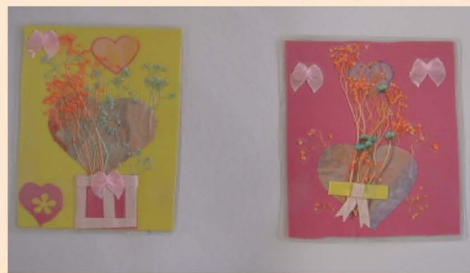
作者：陳芝瑾 題目：愛的書籤 以愛心為主，將水拓圖案剪成愛心形狀，加上乾燥花、緞帶的運用，呈現溫馨協調的感覺。