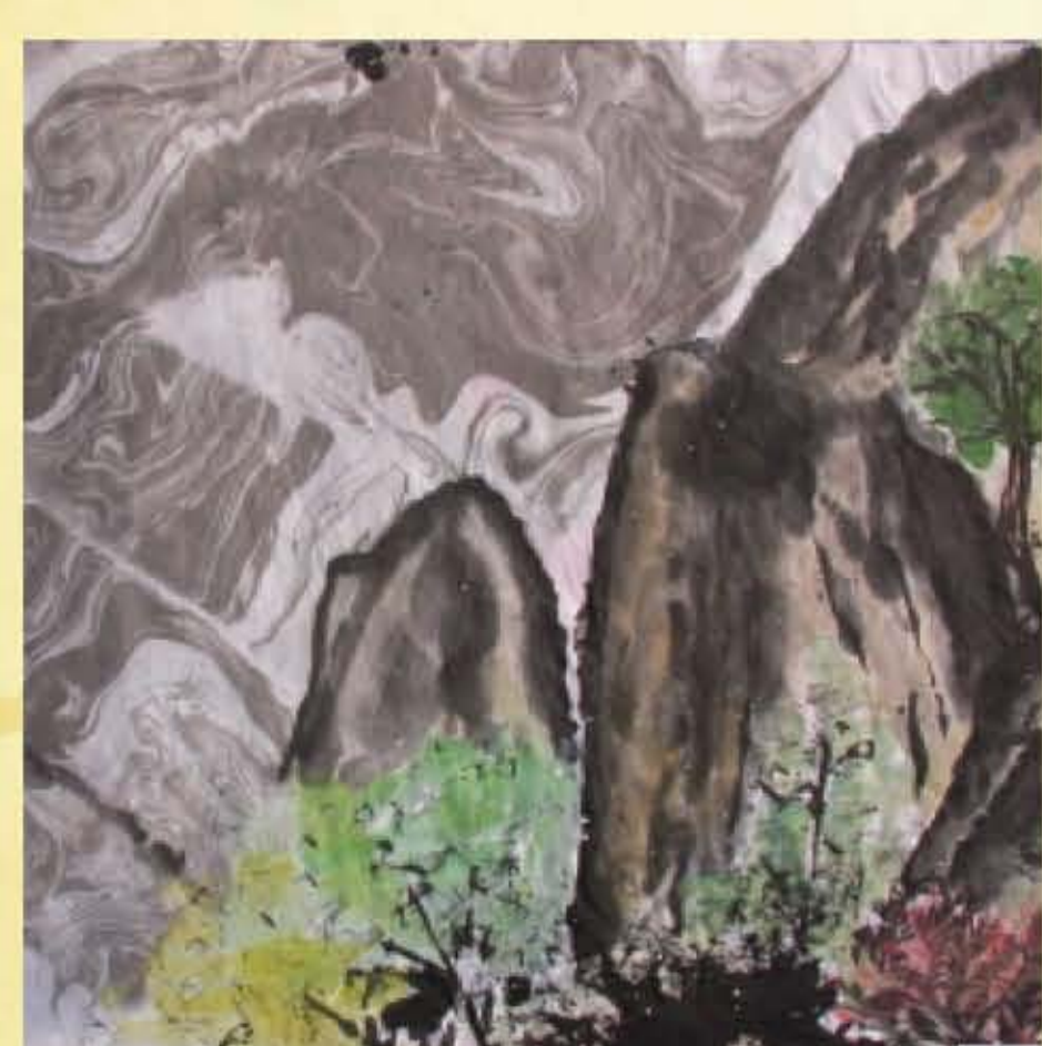
拓印結合水拓作品