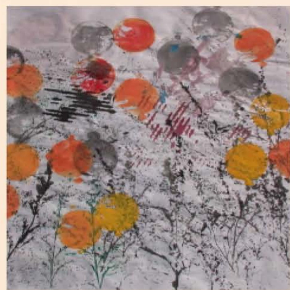
作者：洪惠如 題目：花叢 利用樹枝紋路及深淺色彩，創造出花叢間層層疊疊的空間效果。