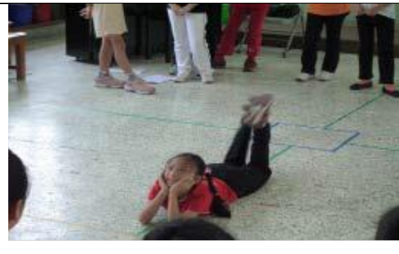
圖 4 低層次也能呈現豐富的肢體表達喔！