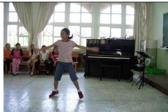
圖 2 讓學生透過肢體，運用身體元素設計一個固定（重覆）的動作，再加入其他部位的變化動作。