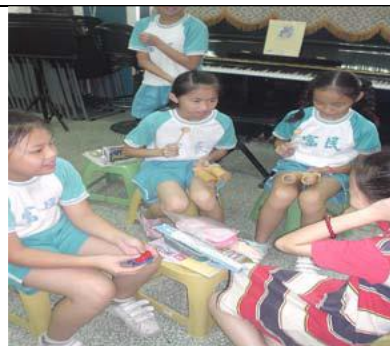
圖 5 大家的節奏要配合才好聽