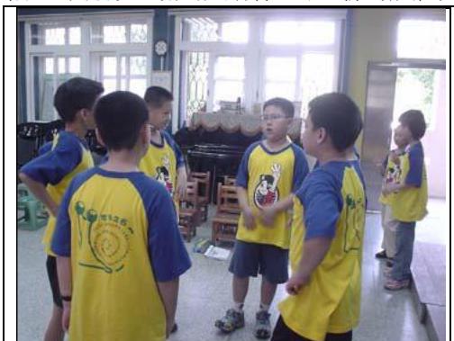
圖 8 從羞澀扭捏的臉部表情

此活動中所用的音樂是曲式相當簡單的《七式進階》，在 B 段音樂元素一一加進去，類似極簡創作手法(陳淑文, 2004)。這「重複性」、「規則化」的音樂形式，讓學生們就跟著音樂逐步增加創作的肢體動作。一開始，學生們彼此有點害羞，只隨意做做，而後老師以誇張的臉部表情要大家放輕鬆，小朋友的肢體動作上逐漸的展開，隨著喜怒哀樂的想像著情緒變化，全身也跟著配合表演。