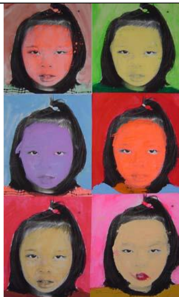
圖 7 學生作品