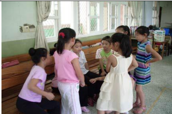
圖 7 觀賞“Bolero”舞曲的演奏，讓學生發表樂曲的特殊手法，並將視覺、先前動覺的表現所探討對「重覆」的共通感受表達意見和看法。

聆賞活動指導策略： 第一次聆賞音樂 → 描述音樂（情意面，如：它讓你有什么感覺，它用什麼方法使你產生這種感覺） → 第二次聆賞 → 發問表達（認知面，如：音樂元素的詢問） → 分析音樂或影片中人物表現的特點 → 再次聆聽（聆賞）。|