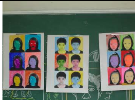
圖 6 把得票最高前三名的作品展示在黑板上，大家一起說說它們有哪一些優點。