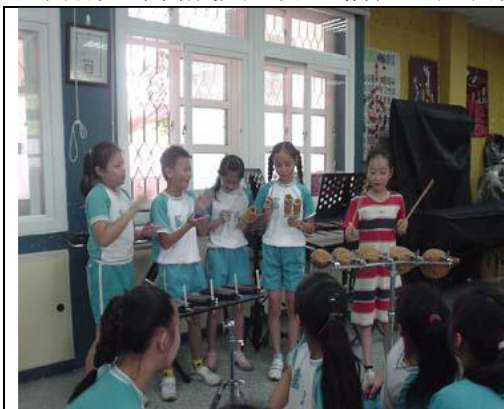
圖 6 我們演奏的多開心！