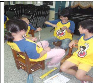
圖 4 運用同樣的樂器做節奏的重疊

以「名字」遊戲帶起了學生們的對聲調的好奇，教師接著發下學習單，引導學生了解聲調和音符間的連結，然後用語言節奏和重覆節奏來做一段自我表演。這是將一組學生中有三至四個人負責敲打重覆的基本拍、其他的組員則以說故事方式做聲調變化或有兩人共同分句來做語言節奏。在活動中發現兩人一起拍節奏，在速度與正確性穩定多了，而且整組一同設計，在表演內容上也明顯增加許多創意。