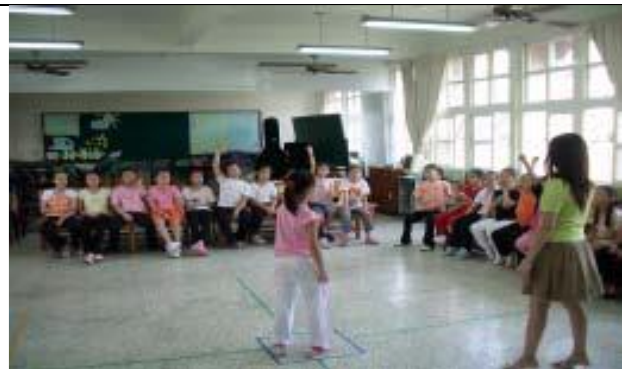
圖 3 讓其他觀摩者分享所觀察的動作，並能指出固定與變化的動作。