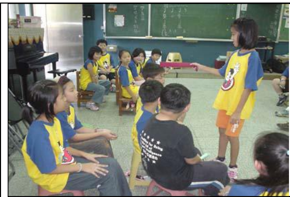
圖 3 運用直笛充當指揮棒更神氣！

接下來就分組進行「名字疊疊樂」表演。每組彼此之間都討論的很熱絡，當有小朋友不知道要如何來說自己的名字時，旁邊的同學就搶著幫忙想稱呼。在來即進行表演活動。每個「小指揮」都煞有其事的自備各種「指揮棒」，有模有樣的帶全組表演，每一組都有令人驚奇的演出。由於只是運用現有的名字稍做變化，無特別技巧，小朋友都喜歡參與，既新鮮又好玩。