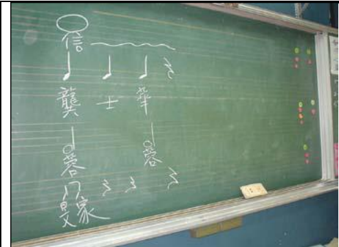
圖 1 將名字和節奏相對應

本課程開始老師用誇張的聲調唸自我的名字，有學生立刻跟著模仿，全班都笑著學叫別人或自己的名字。從三個字基本型名字，到疊字型的叫法，再到具音響效果的綽號型，小朋友的形式、多樣而大膽了起來。然後教師依第一組小朋友的名字，利用節奏的長短、快慢、重覆性加以組合，成為一段語言節奏。對於課程的特色－「重覆性」、「規則化」，已有部分的概念。