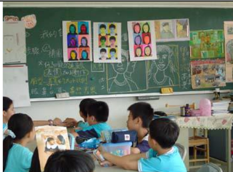
圖 5 把作品展示在教室，大家一起互相欣賞，並票選出最受大家欣賞的作品。