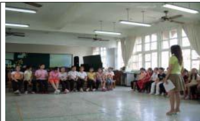
圖 1 透過視覺及景觀在「重覆」的做法上，學生踴躍提出如：壯觀的、有秩序的、規律的、單調的...等看法。

整個動覺部份最後以 3 分鐘的創意舞蹈呈現，主題以「重覆」固定的動作，加點些微的變化性（可以是個人或雙人以上的變化動作）與隊形在空間的設計，除了提昇自我的肢體自覺外，更希望藉此增進四年級的學生在肢體動作上的想像力與創意。