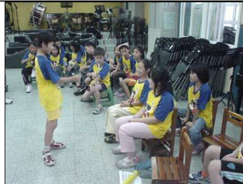
圖 2 說著說著忍不住站起來指揮

接下來就分組進行「名字疊疊樂」表演。每組彼此之間都討論的很熱絡，當有小朋友不知道要如何來說自己的名字時，旁邊的同學就搶著幫忙想稱呼。在來即進行表演活動。每個「小指揮」都煞有其事的自備各種「指揮棒」，有模有樣的帶全組表演，每一組都有令人驚奇的演出。由於只是運用現有的名字稍做變化，無特別技巧，小朋友都喜歡參與，既新鮮又好玩。