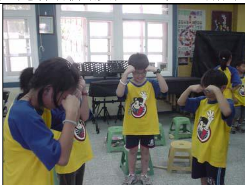
圖 9 到自在、生動的肢體語言