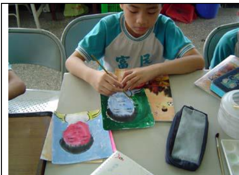
圖 3 學生依照自己的安排，使用水彩上色的方式，將顏色填在影印後的 照片圖像上。

交接處要小心處理，在做出這樣的限制和提醒之後，上色的效果才較為理想。此外在選擇顏色方面，學生還是多少會被固有的色彩觀念所限制，不過在教師鼓勵之下，才開始大膽的嘗試，讓自己的影像變得五彩繽紛。在過程中學生們充分享受改造影像的遊戲。每個人完成六張作品，再把完成的作品拼貼在圖畫紙上，便大功告成。