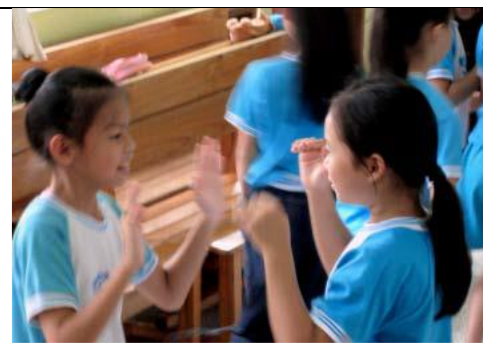
圖 6 兩人以上一組，發揮彼此的想像與創意，設計更多可能的舞蹈動作。