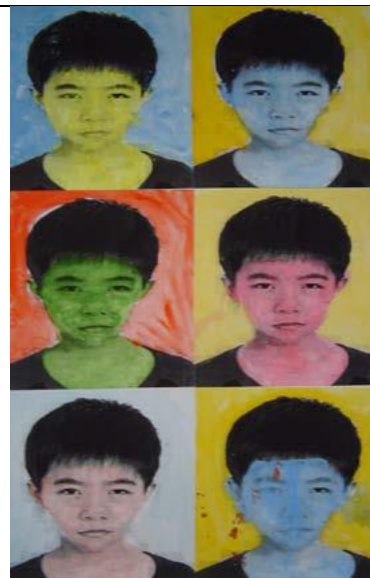
圖 8 學生作品