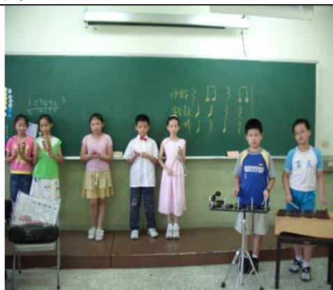
圖 7 加入音磚試試看