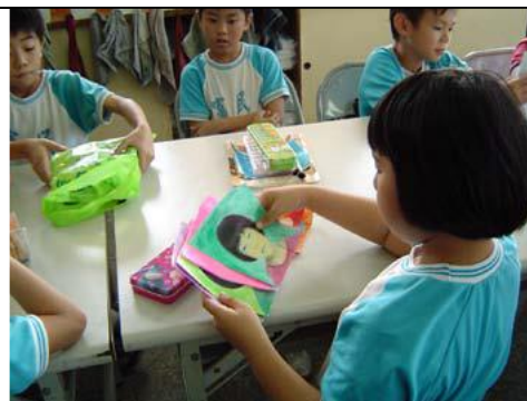
圖 4 上色完成之後，學生把大頭照圖像排列於桌上，依照自己的感覺拼貼於四開圖畫紙上。