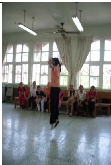
圖 5 高層次（空間）+力量+身體動作，超越先前簡單的動作。