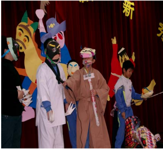
圖中學童能配合角色構想、製作合宜且具特色之裝扮與配件，表現突出。