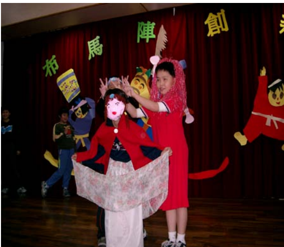
圖中兩位男同學搭配角色反串演出，造型深具創意、趣味橫生。