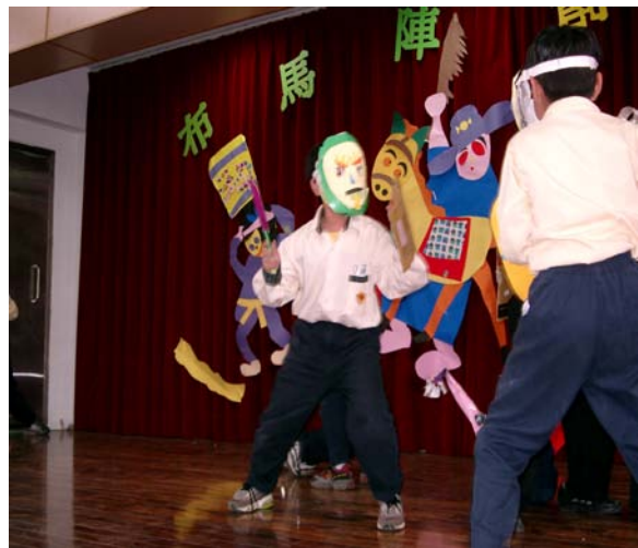
學童易因過於投入，表演危險動作，演出公約中對於表演者與欣賞者的教育與規範更顯重要。