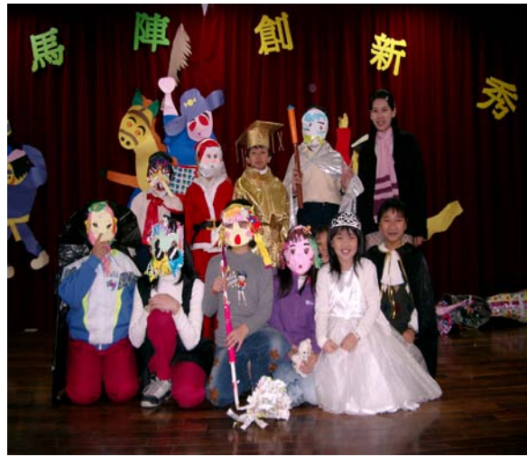
圖中同學能運用豐富創意，以多種現成或環保材料搭配出特別服裝與道具，配合角色演出，各具特色。