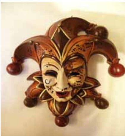
罕見的面具材質：陶瓷面具