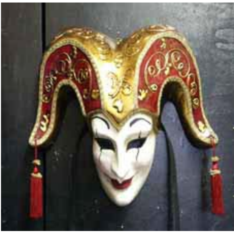
即興喜劇角色面具

早期希臘戲劇很簡單，只有一個演員和一個歌隊。因為所有的角色都由這個演員扮演，所以他必須用面具來改變身份。而當他離開舞台去換裝時，歌隊便以歌唱和舞蹈來填補這段空檔。演員戴面具和歌隊合作這些特質，便成了希臘戲劇演出時的固定形式。