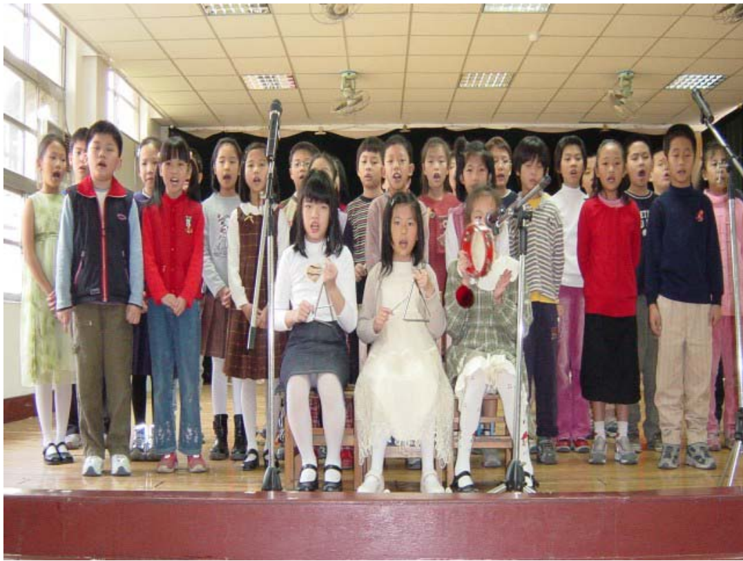
圖四：正式演出的情景之一(初賽)