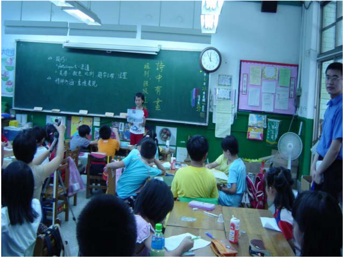
圖十三：各組優良作品在班級發表，由各組進行互評