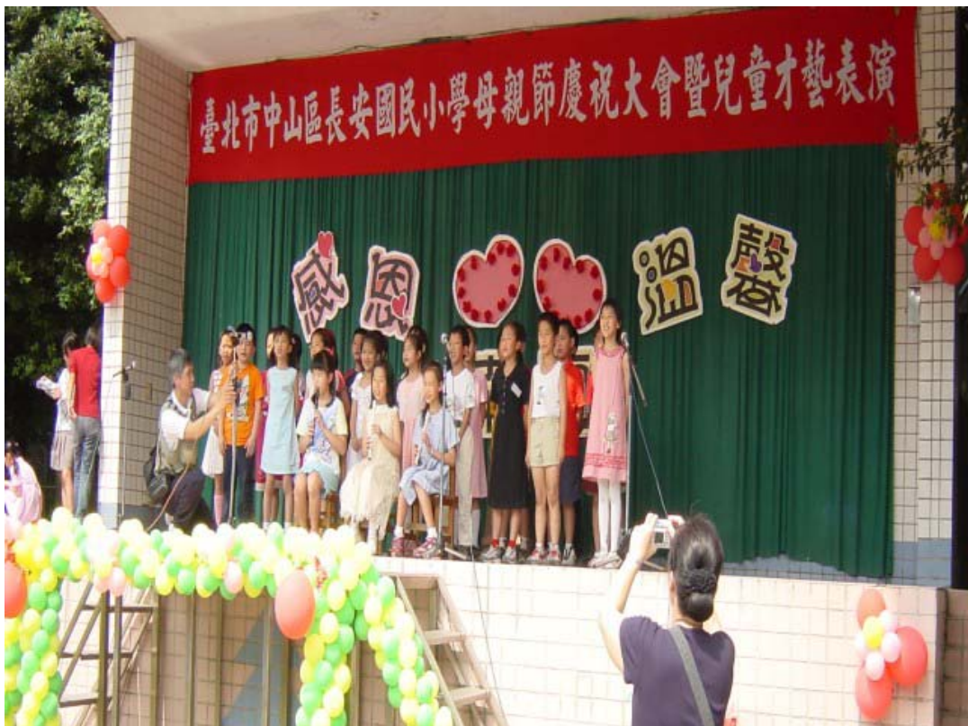
圖五：母親節慶祝大會暨兒童才藝表演會上演出