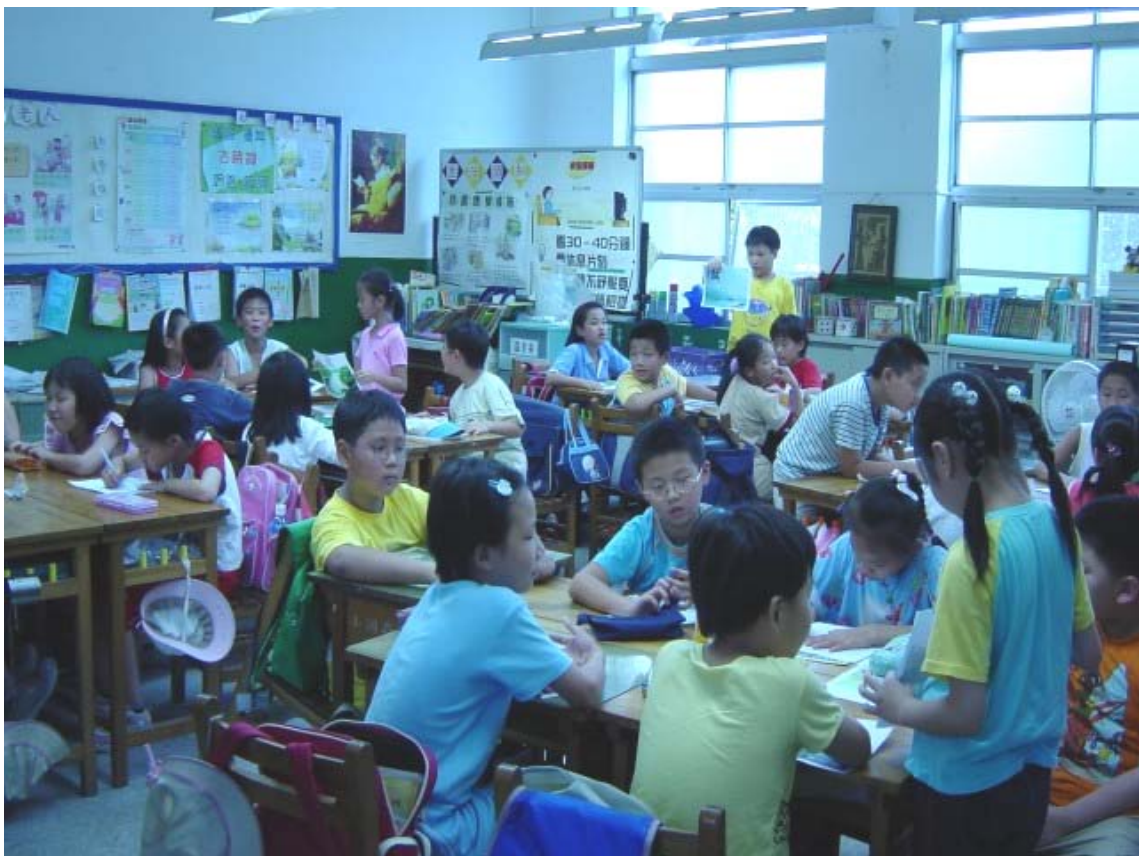
圖十二：各組自行決定組員報告順序，報告者需起立解說自己製作的經過、內容、作品特色等，全部報告完後再選出優秀作品，代表組別參與班級評選。