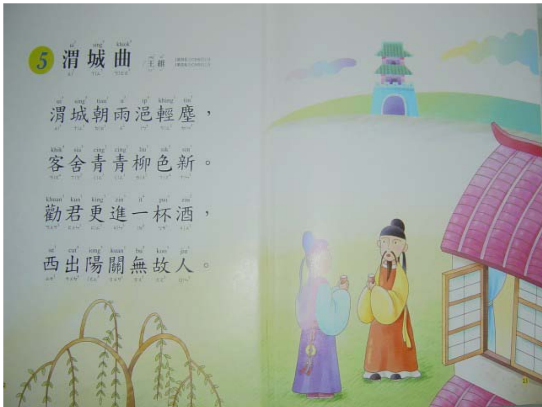
圖一：渭城曲

詩意：渭城清晨的一場雨，濕潤了地面清揚的沙塵。兩旁的柳條兒就像新抽芽似的青翠動人；我們休憩的小客棧也因此顯得碧綠光潔。來吧！老友！讓我們再乾一杯吧！等你出了西邊的陽關，就沒有談心的老朋友了。