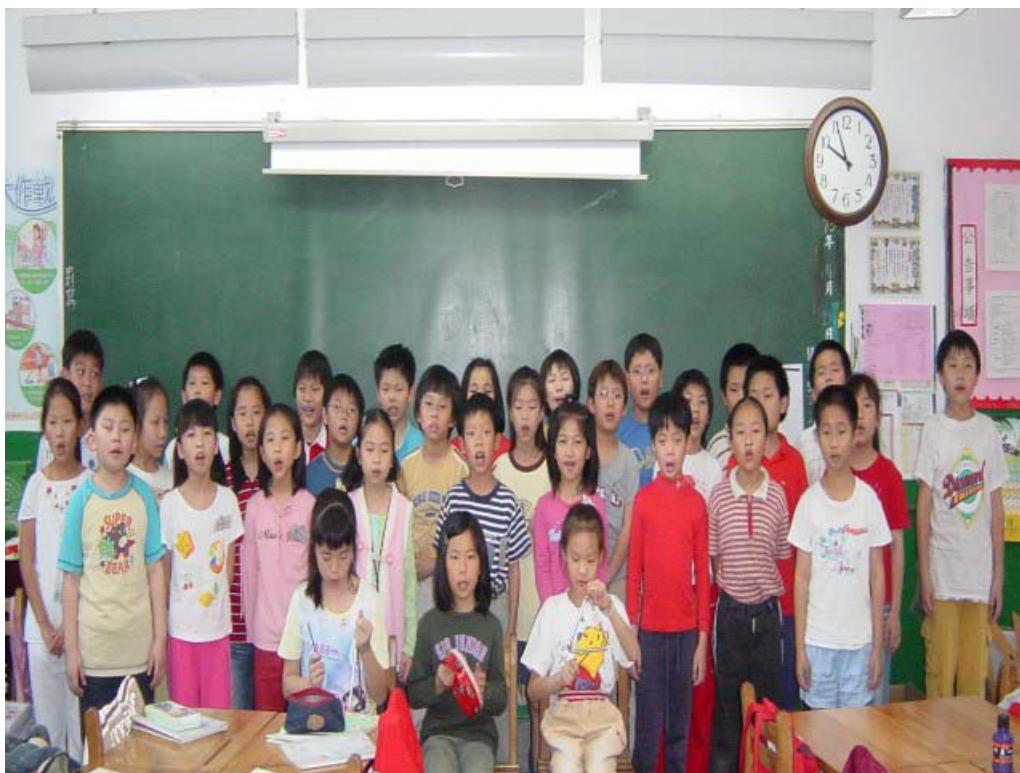
圖三：在教室裡練習的情景