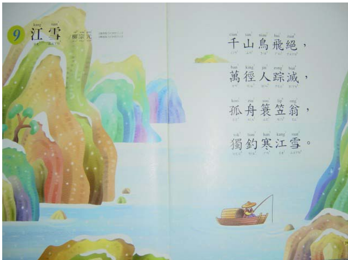
圖二：江雪，攝自《台灣鄉土語言教材：台語古詩吟唱①靜夜思》P. 38~39

詩意：渭城清晨的一場雨，濕潤了地面清揚的沙塵。兩旁的柳條兒就像新抽芽似的青翠動人；我們休憩的小客棧也因此顯得碧綠光潔。來吧！老友！讓我們再乾一杯吧！等你出了西邊的陽關，就沒有談心的老朋友了。