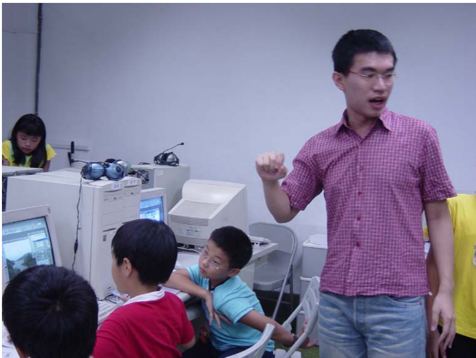
圖九：藝術與人文與電腦課老師協同教學，一邊觀察學生的數位拼貼畫作，一邊就詩的意境跟構圖與學生進行對話，使學生的數位拼貼創作更符合詩中的意境。