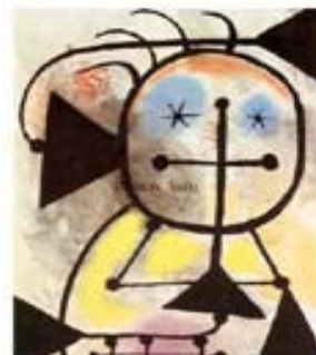
Picnic In Woods