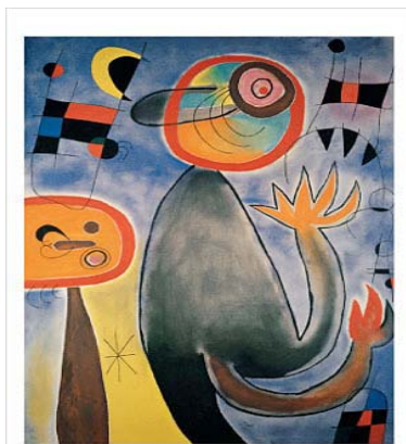
Girl In Garden