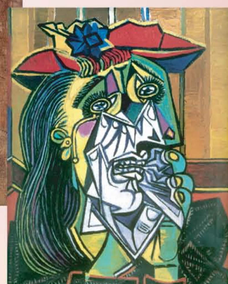
畢卡索 哭泣的女人