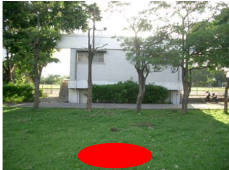
圖 1. 司令台、操場