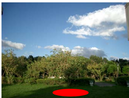
圖 3. 樹木群