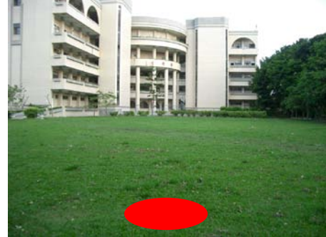
圖 4. 藝能科大樓