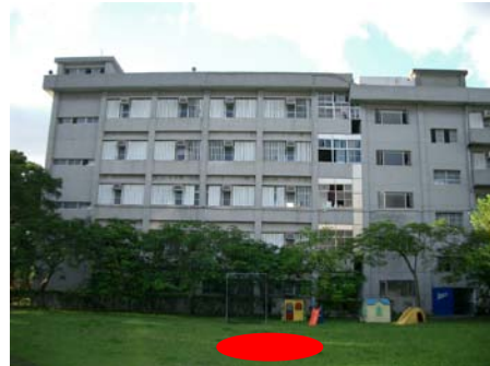
圖 2. 教室大樓