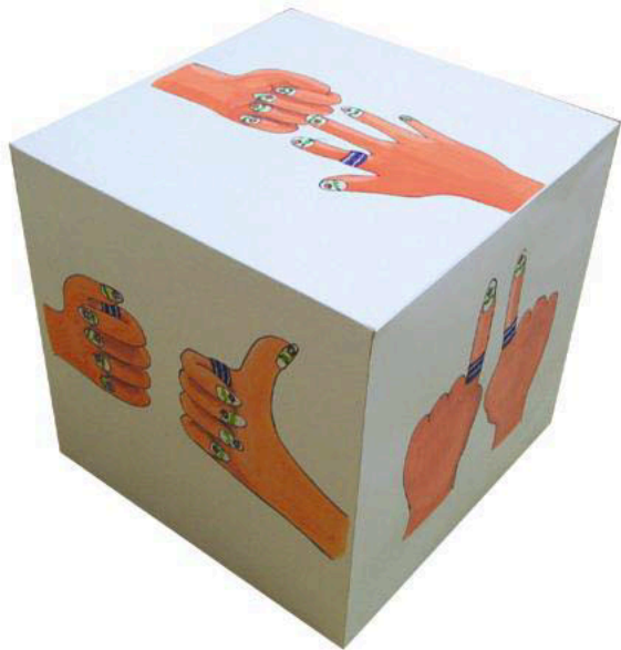
圖片說明：「整型春秋」學習單(垂直發展)