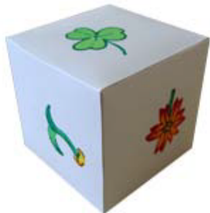
圖片說明：骰子(花/葉瓣數)