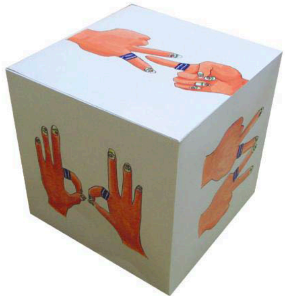
圖片說明：骰子(手指)