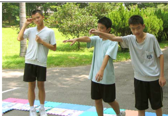
圖片說明：肢體表演－命運(大熱天追公車)