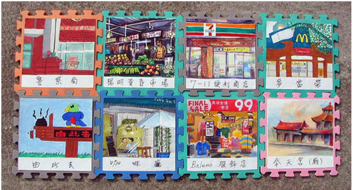
圖片說明：「閒畫家常」水彩畫(巧拼板)