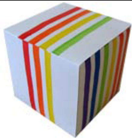
圖片說明：骰子(平行線數目)