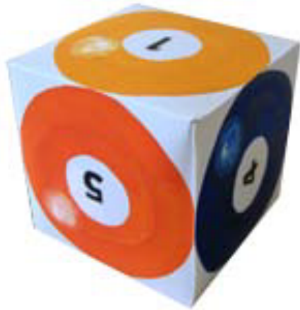
圖片說明：骰子(撞球編號)