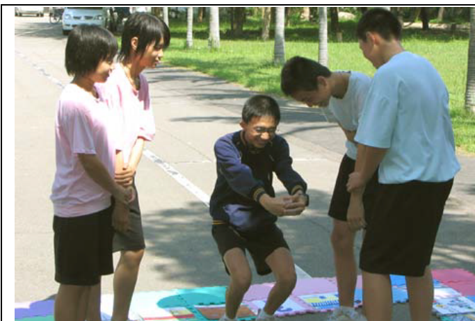
圖片說明：肢體表演－命運(逛街肚子痛急尋廁所)