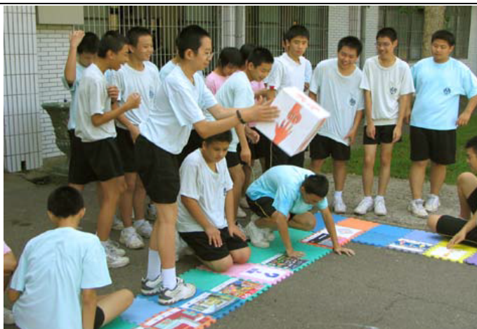
圖片說明：上課情形