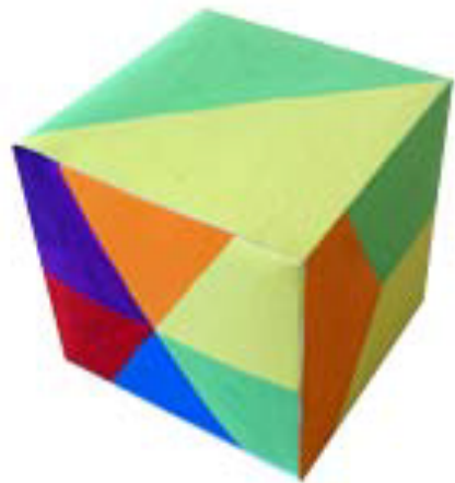
圖片說明：骰子(色塊數目)