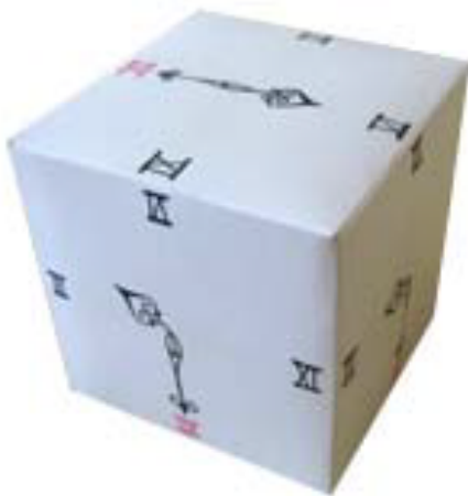
圖片說明：骰子(幾點鐘)