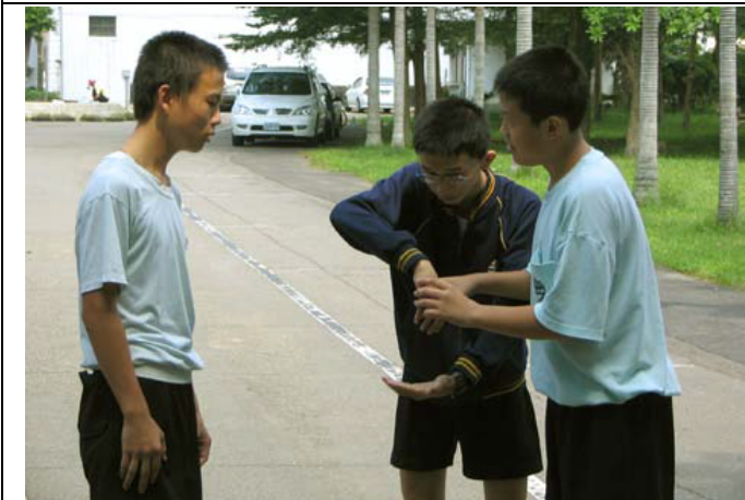
圖片說明：肢體表演－場所(剉冰果汁店)