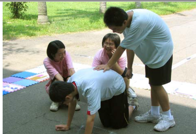
圖片說明：肢體表演－場所(機車修理店)