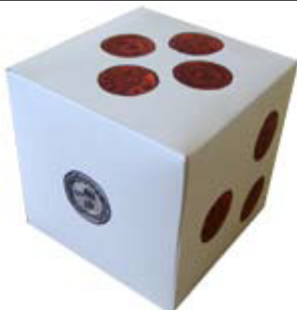
圖片說明：骰子(幣值總額)