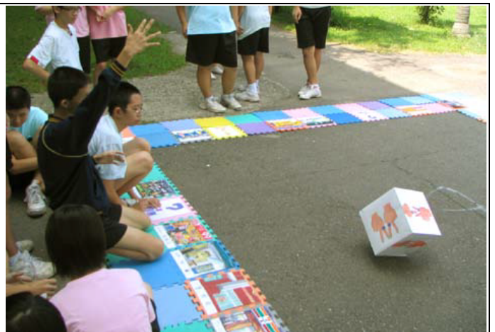
圖片說明：組長丟擲骰子