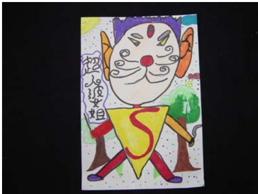
19.「超人婆姐來囉，專們懲治壞人喔！」畫面中主角安排大方有趣，令人不得不佩服小朋友的豐富想像。-----遇到困難找我就對了。