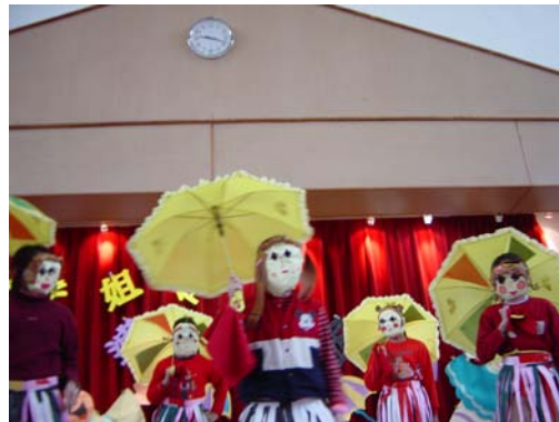
20.隨著時代演進，十二婆姐似乎快被忘記了，但透過實作展演，她將永遠留在我們的記憶深處！