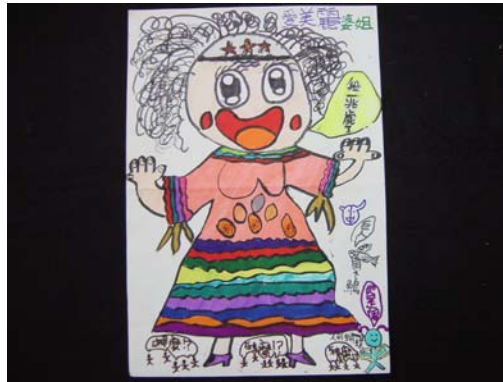
18.作者說：「我是一兆歲的年輕婆姐喔！」畫面中婆姐既時髦活潑又充滿自信，輕快的色彩，令人感染了愉快氣氛。