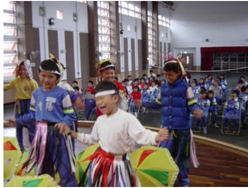
14.看我的「最新婆姐電動馬達」，保證您看得「頭昏眼花」！圖中同學的賣力和自信演出，為表演藝術作了最佳注解。