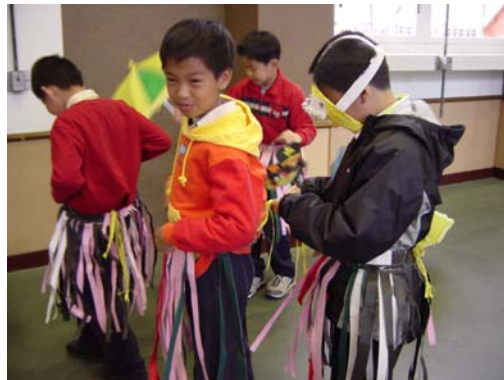
16.圖中同學正於演出前進行相互幫忙著裝，相關課程的順利進行，有賴老師的事前規劃和安排。