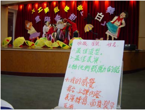
13.台上忙演出，台下欣賞的同學有時會干擾演出，「評審單」的運用，對提升學童的上課參與具有很大的幫助。