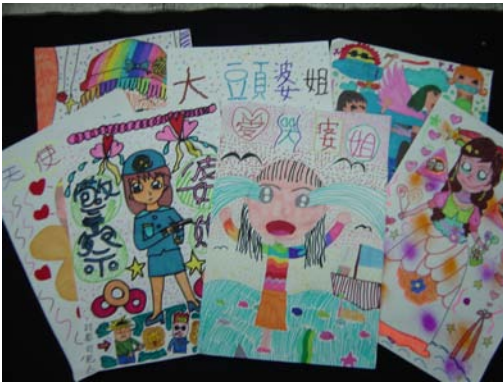
17.新時代婆姐造型設計，旨在提供學童對新時代婆姐角色功能的思考機會，進而能培養關懷他人的精神，並成為他人生命中的貴人。