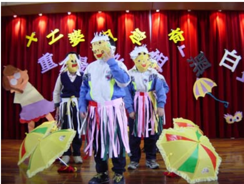
15.「我們是可愛的白髮婆姐隊----才三千歲而已，很年輕喔！」透過小組的協商與合作學習，中年級學生已能將服裝、道具作適當安排，進而提升演出的氛圍！